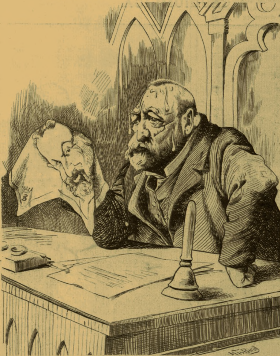
Júst Gyula. — Proh pudor!