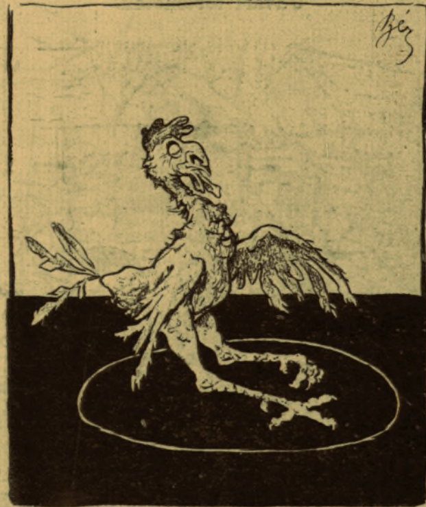
Eötvös Károly kép-eszméje.