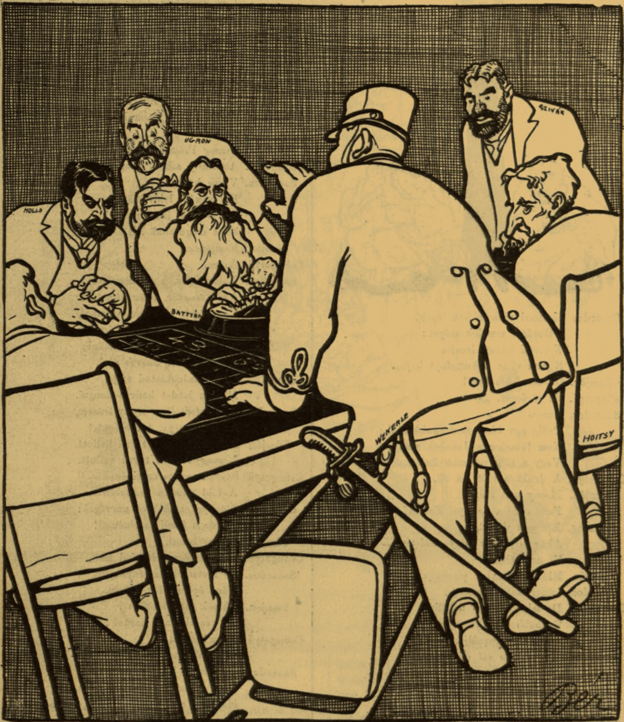
W. S. — A császár nevében betiltom a játékot.