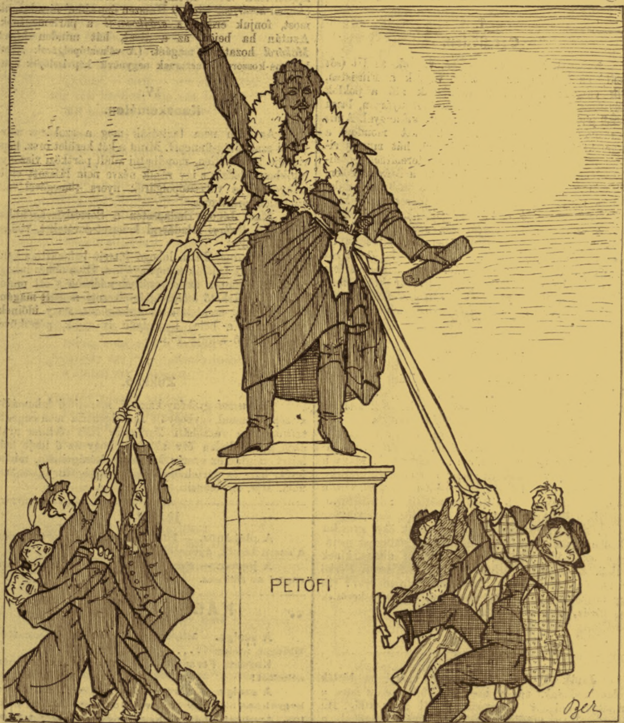
Petőfi szobra. (A tulipános ifjúsági brigádhoz és a »hazátlan bitangok-hoz.« — Mit háborgattok. Takarodjatok innen!