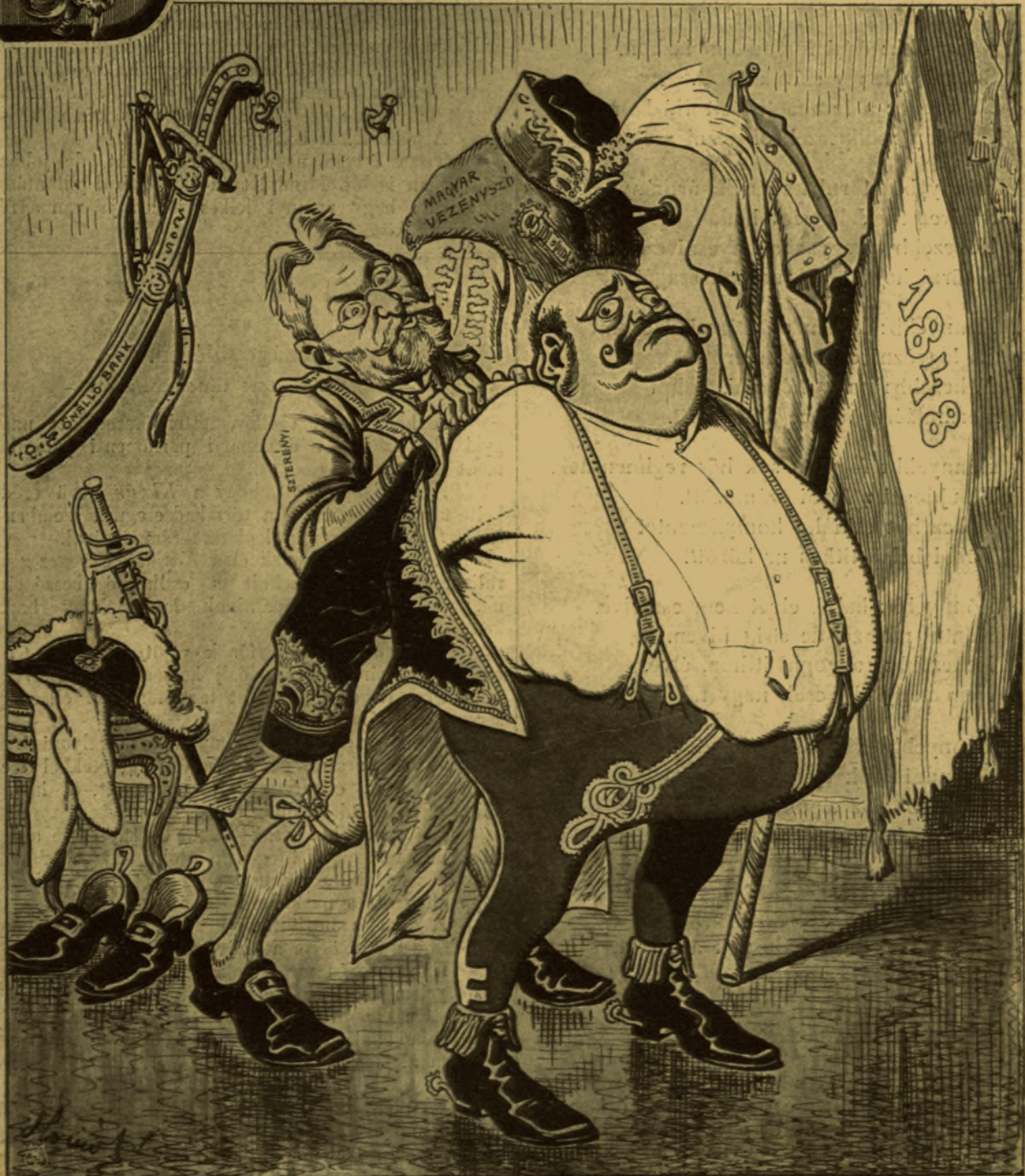
K. F. — Phű, de kényelmetlen volt az a fránya diszmagyar. Add fel Pepi az udvari gálámat.