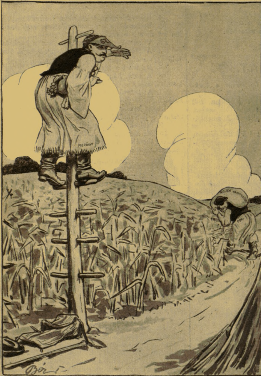
Mezőssy Béla. — Már nem látlak, Náci!