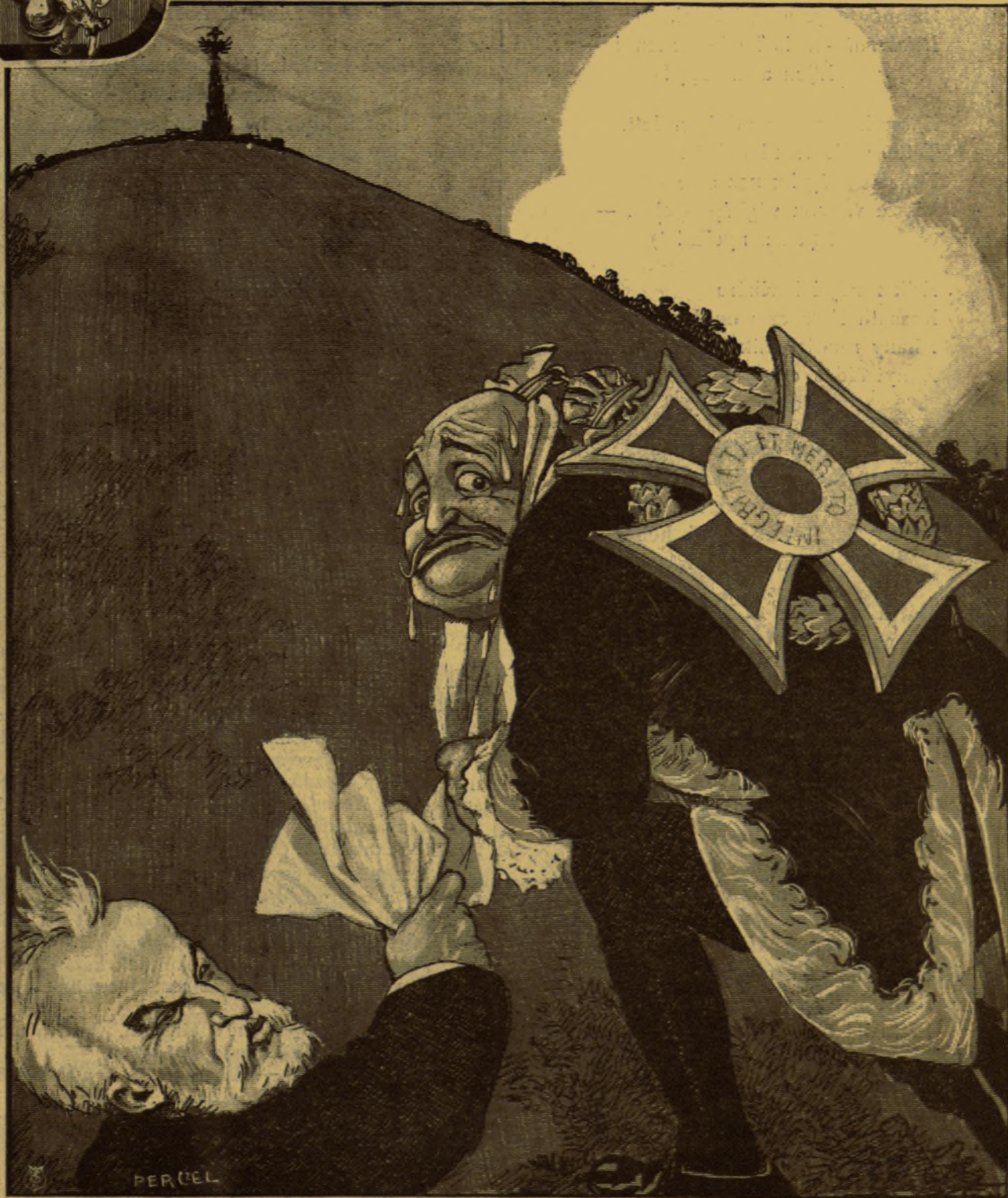
FERENCZ SALVATOR roskadozik a nagy-kereszt sulya alatt.