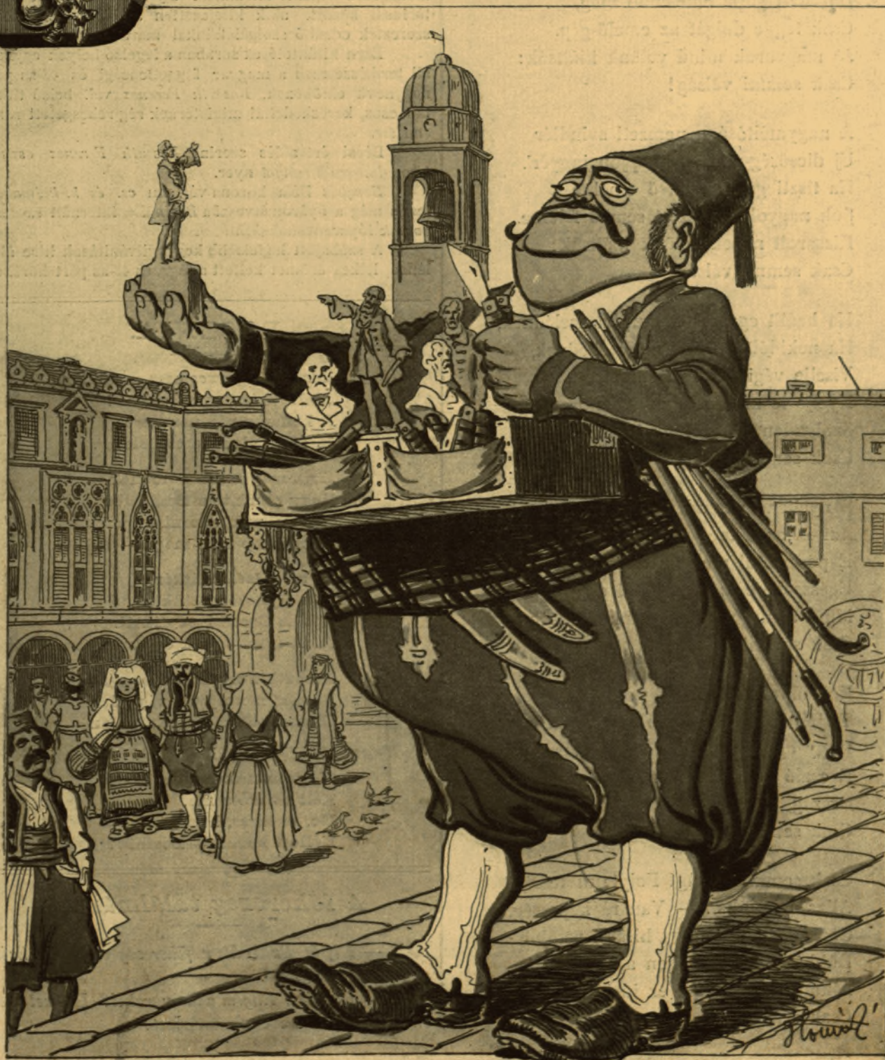
A Megváltó az idén incognito jelent meg a hű dalmatáknak.