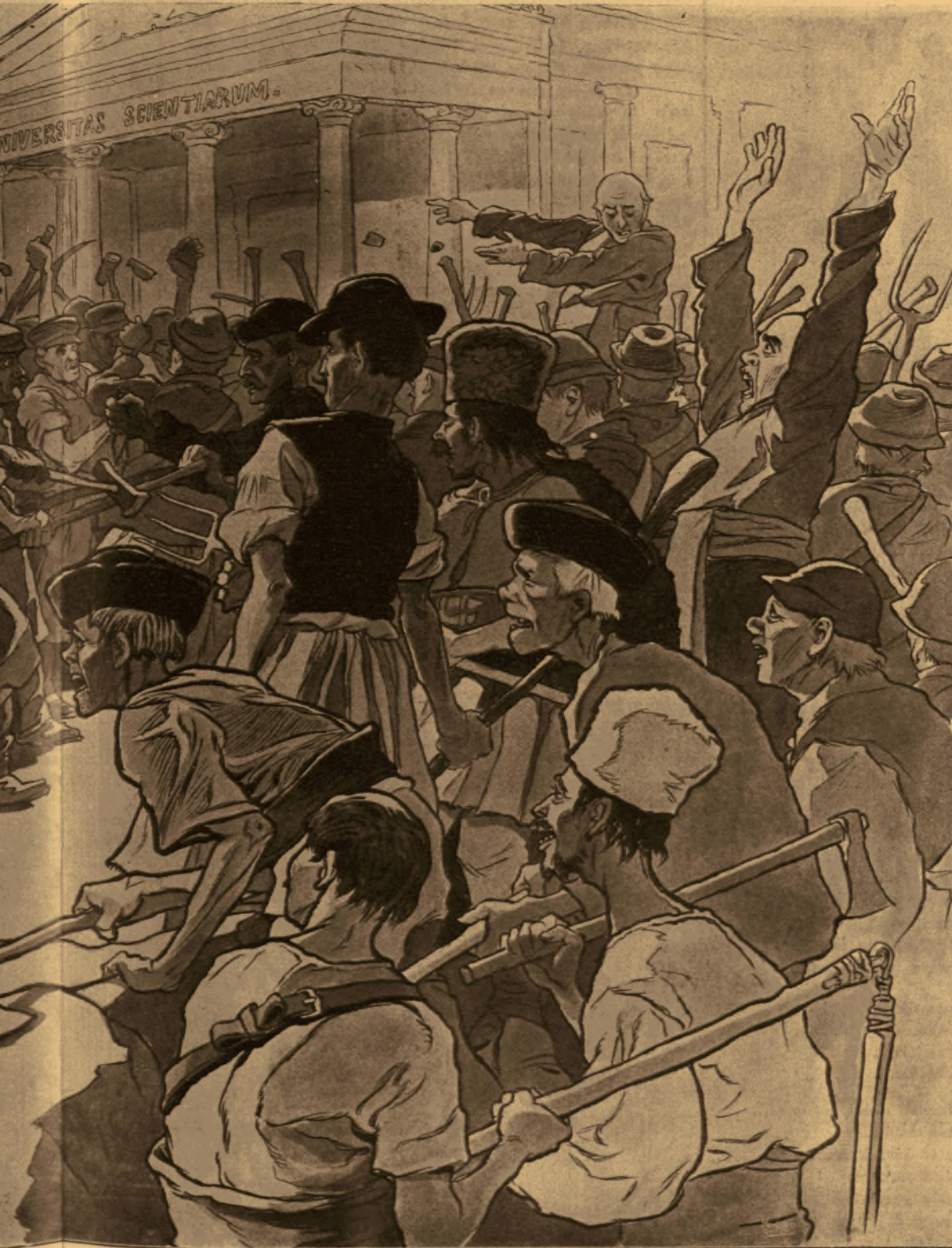
a verset a 2-ik lapon.)