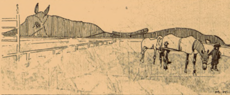
Horizont II a láthatáron.