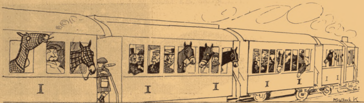
Fel a derbyre.