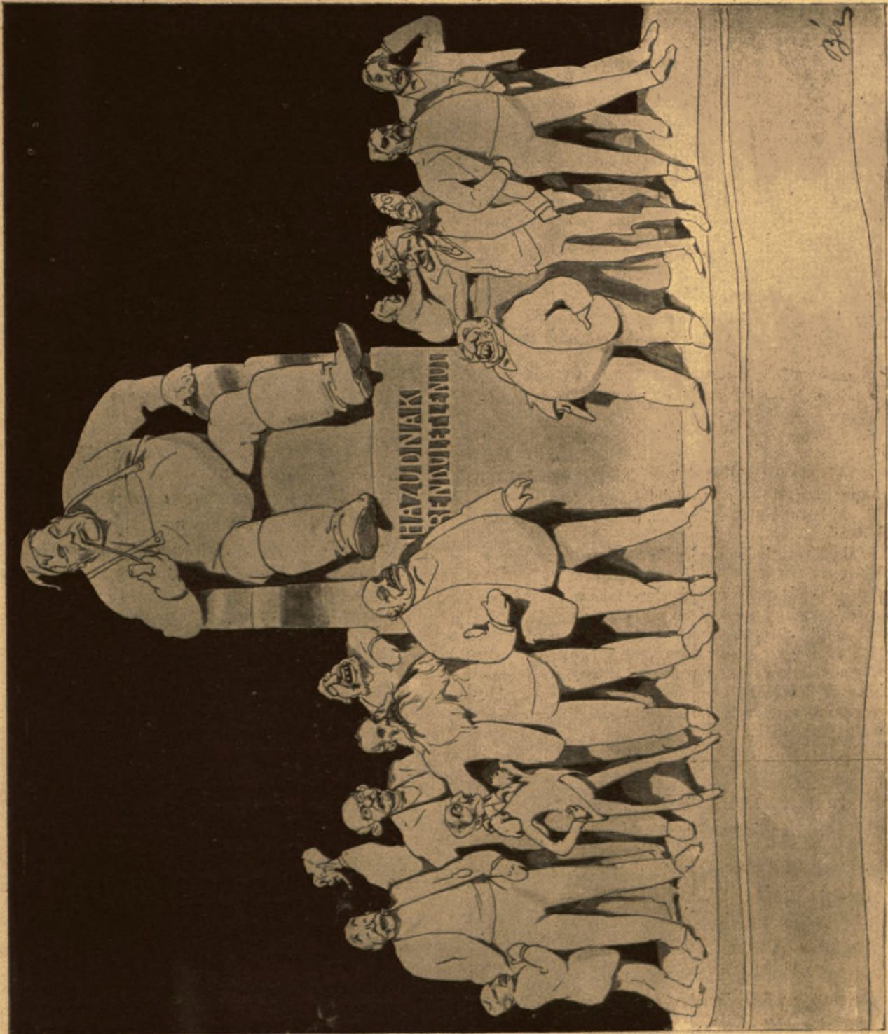
a valóságnak megfelelően kigazítani. Persze, hogy 'használnak' és nem 'használnak'. *) A közönség köréből eredő számos felszólalás folytán 'közteleességünknek tartjuk ezen, közelebb. közölt képünk/felirátát A B. J. szerk.