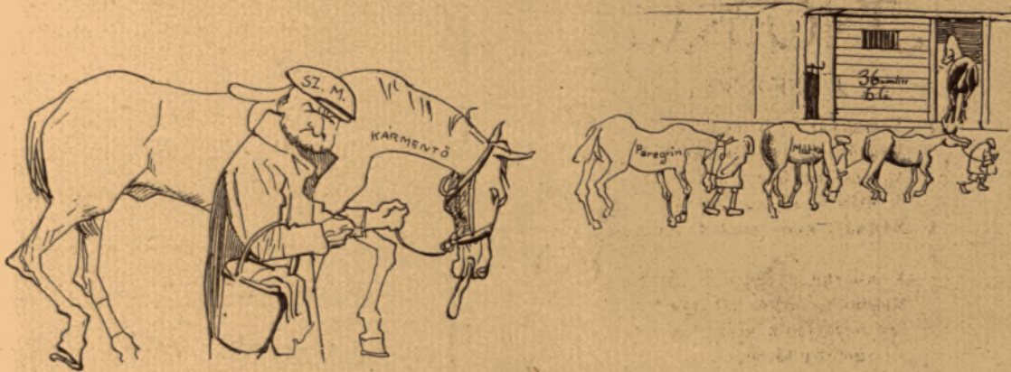
A letört magyarok.