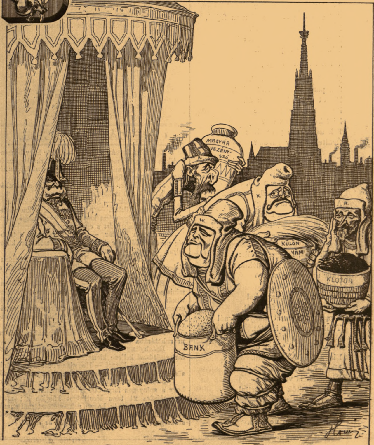
— Tervezte gróf Zselénszki Róbert. —