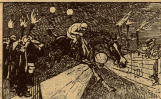
Kármentő éjjeli galoppja.