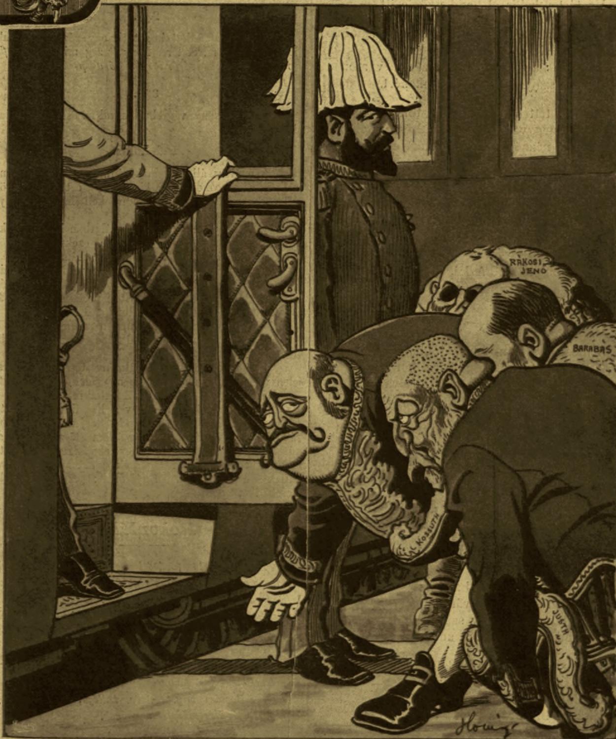
Kar. — Ime felséged legszolgálatkészebb lázadói!