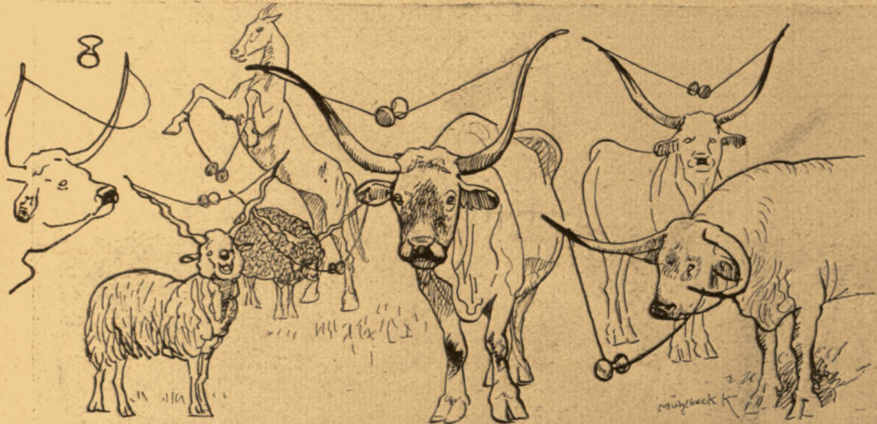
— a Hortobágyon.