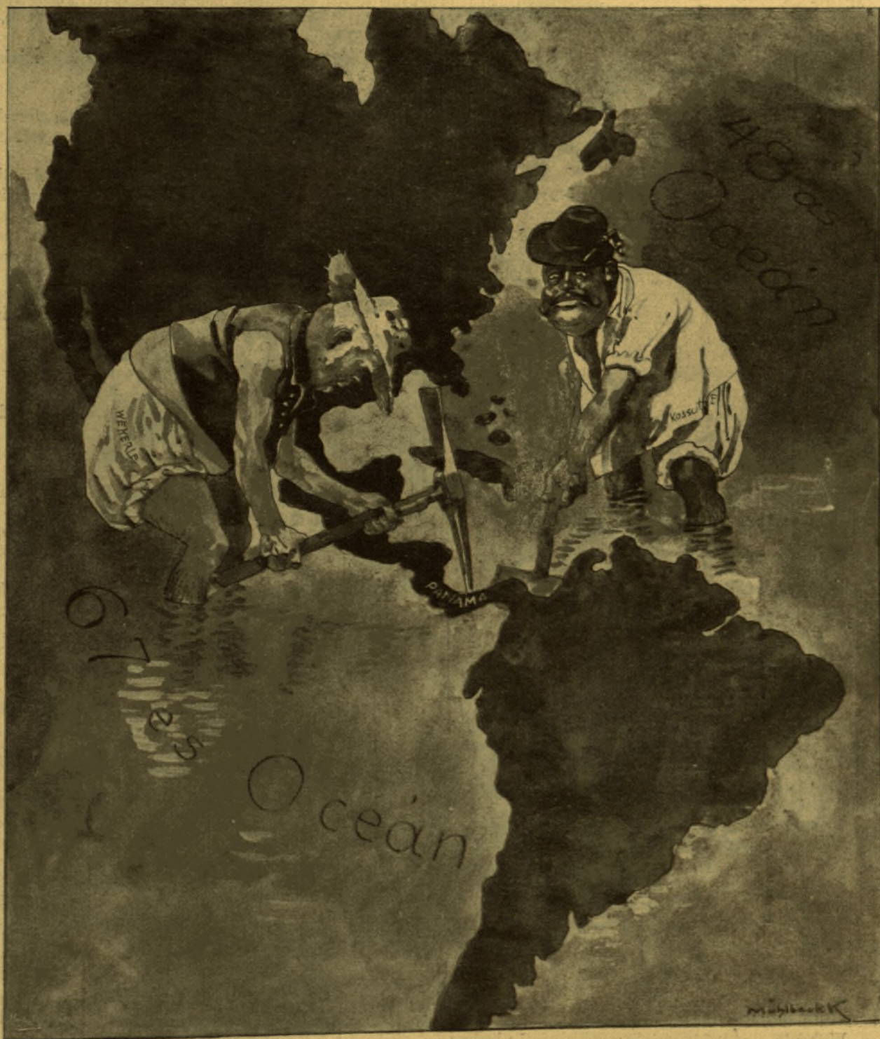
Hogy készül a fuzió?