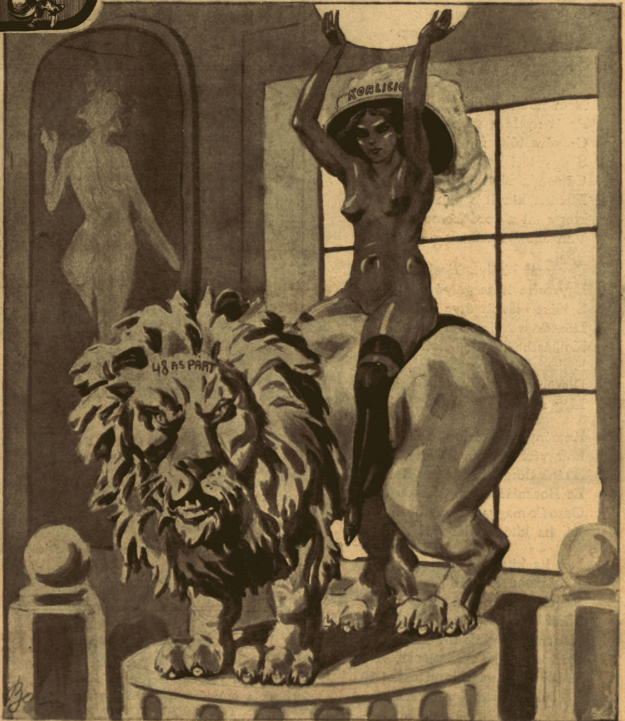
— Kossuth-mulató az Erzsébet-kőrúton. —