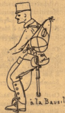
à la Bausil