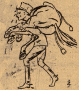
«Ha nem jössz, viszlek»