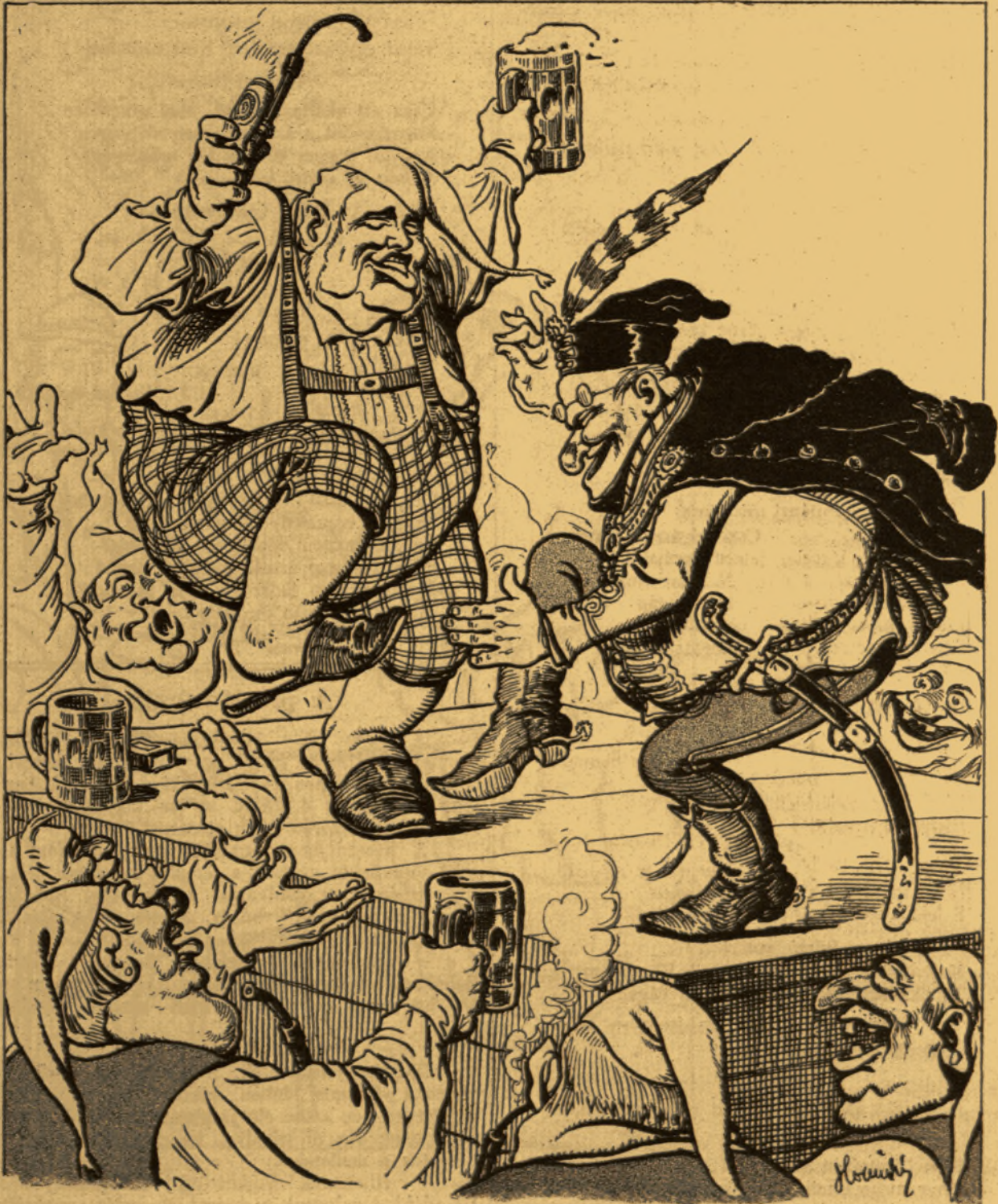
— Sváb-apotheózis Nagyzsámon. —