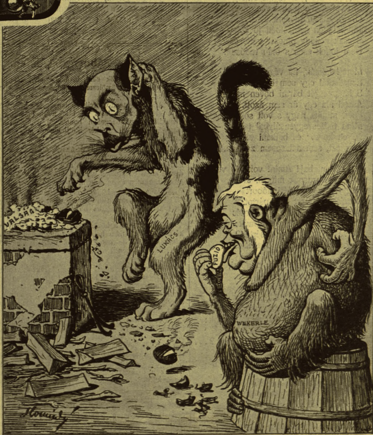
A macska. — Az ördög vigye ezt a gesztenyét, de forró! A majom. — Ne törődj vele, csak kapard ki szépen — nekem.