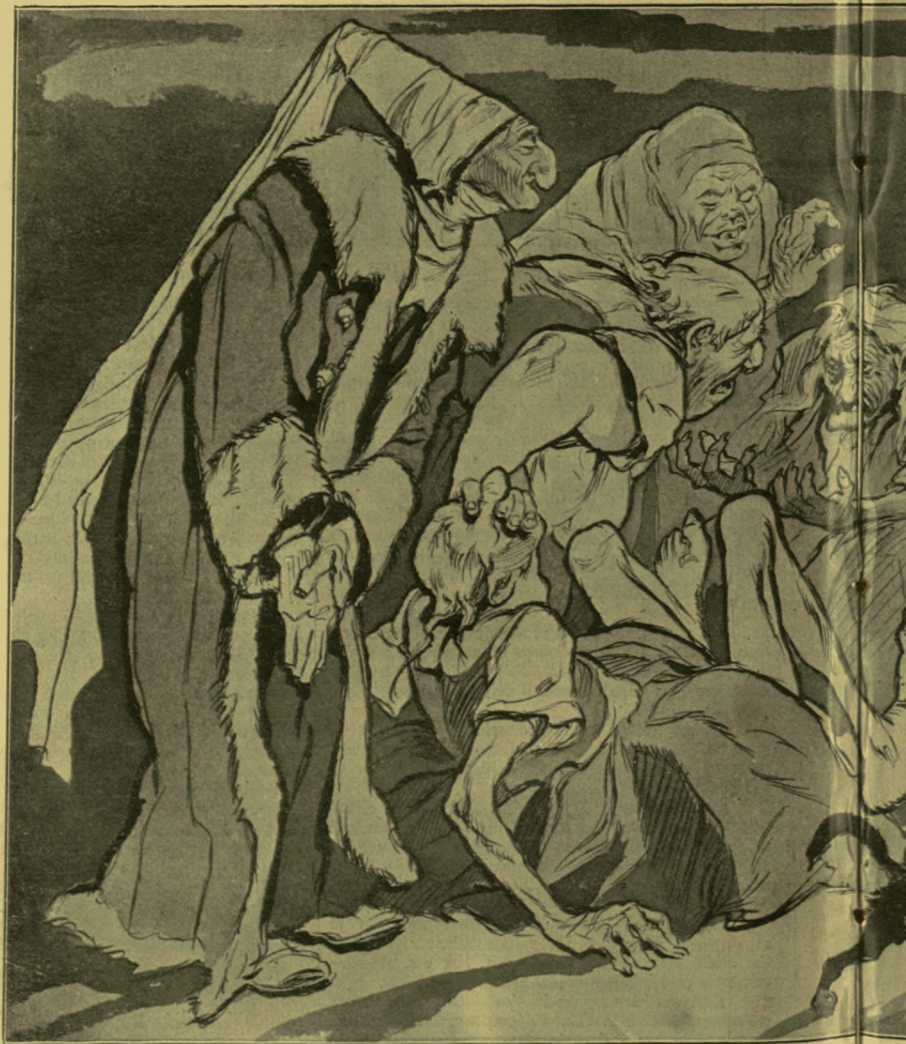
Magyar kuruzslók és boszorkányok nagygyűlése a Gel