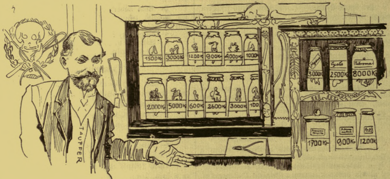
— Egy tudományos gyűjtemény bemutatása. —