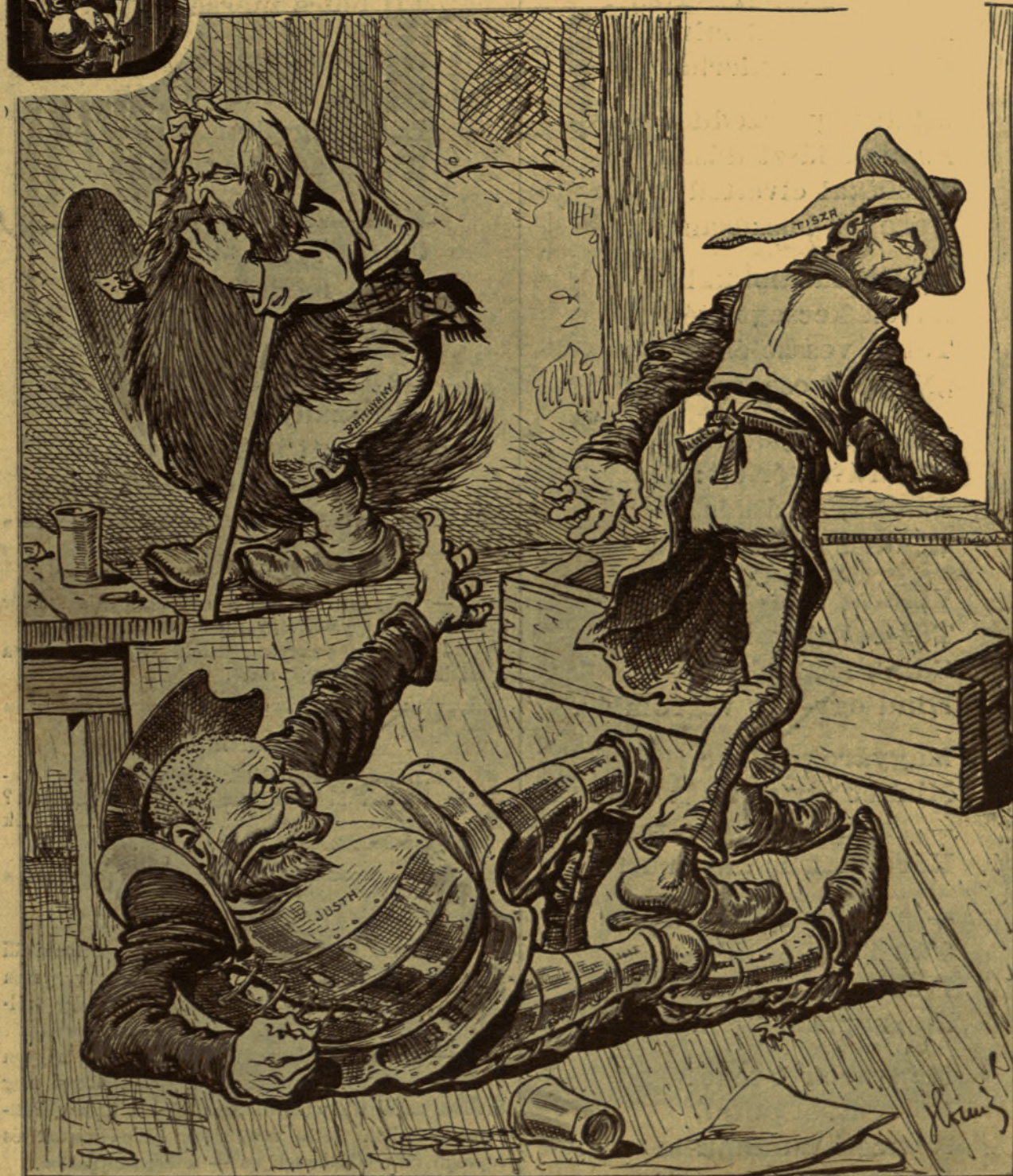
Batthyány-Sancho Pansa. — Jaj, jaj, letepert bennünket ez a szabólegény! Don Justh-Quijote ( Tisza után kiállva. ) Legyőztél lovag! De azért mégis Dulcinea-Banca a legszebb leány!