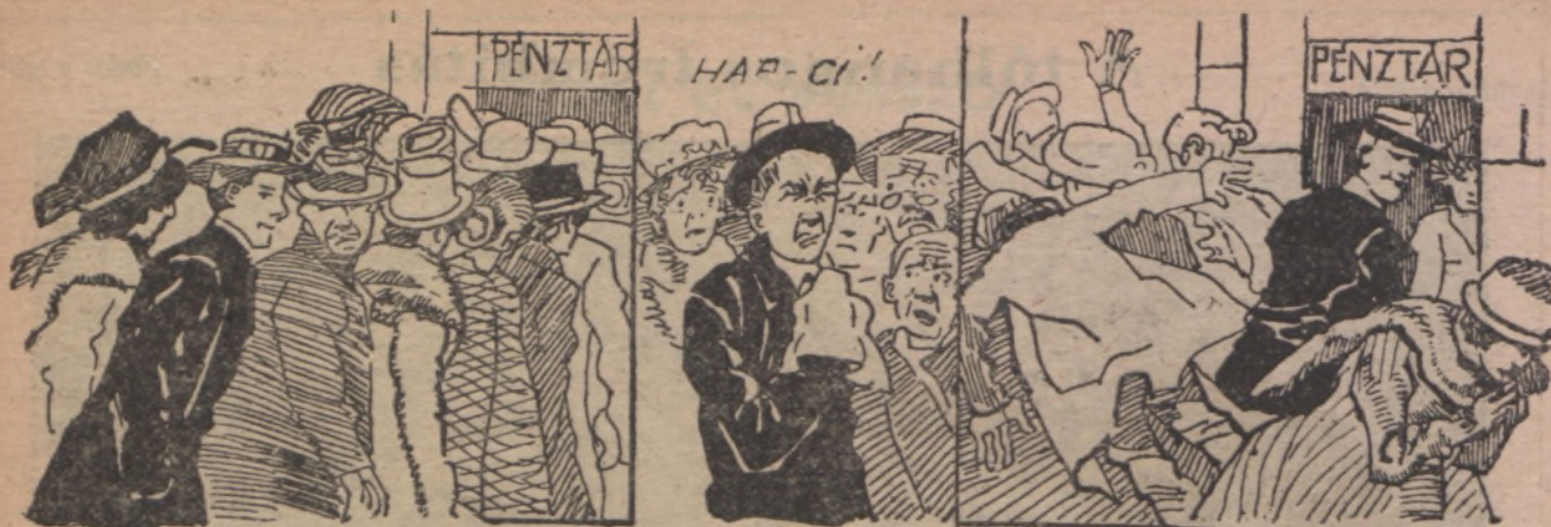
Hogyan jut színházi jegyhez a ravasz pesti