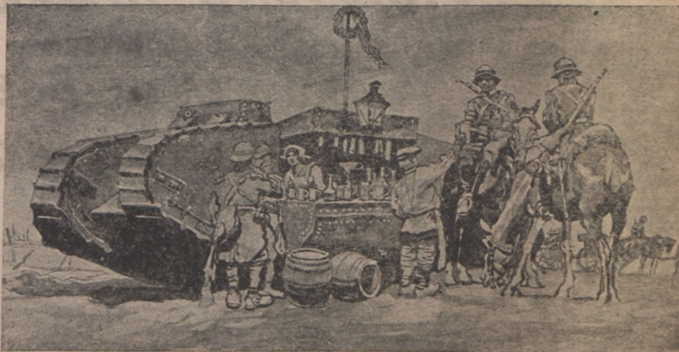
Tank-idill a nyugati harctéren.