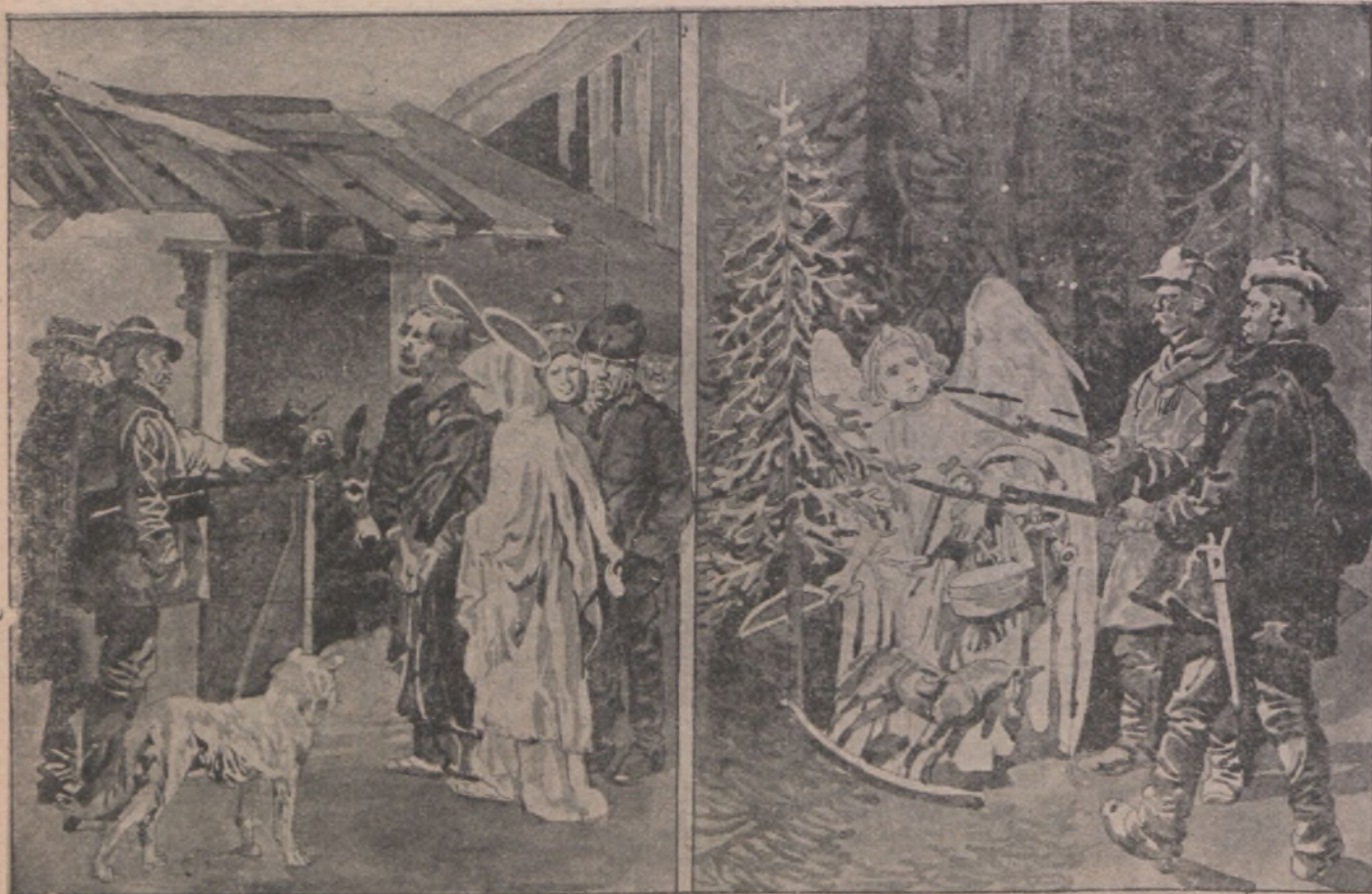
A jászolt hivatalos úton kell rekvirálni