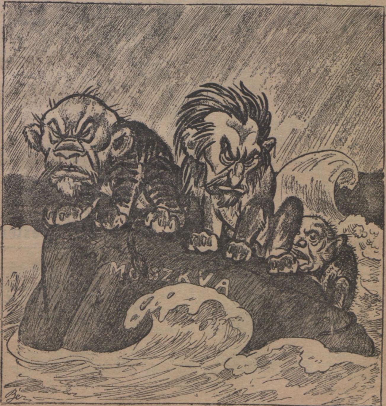
Lenin — Teneked már praxisod van a maglógépez. Dikt. Moszkva...