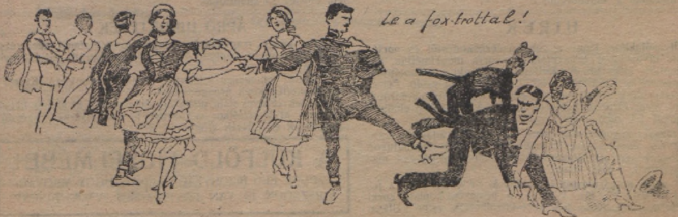
Le a fox-trottal!

— Lári-fári Új Nemzedék, avval csak letakarta kívülről az Egyenlőséget!