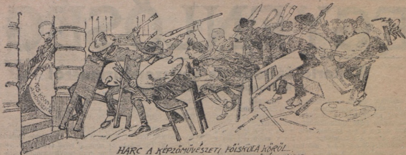
HARC A KÉPZŐMŰVÉSZETI FŐISKOLA KÖRÜL... MŰVÉSEK MOZGALMA AZ ISKOLA VEZETŐSÉGE ELŐTT