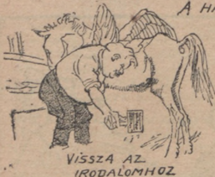
VISSZA AZ IRODALOMHOZ