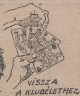
VISSZA A KLUBÉLETHEZ