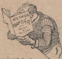
VISSZA A TUDOMÁNYHOZ