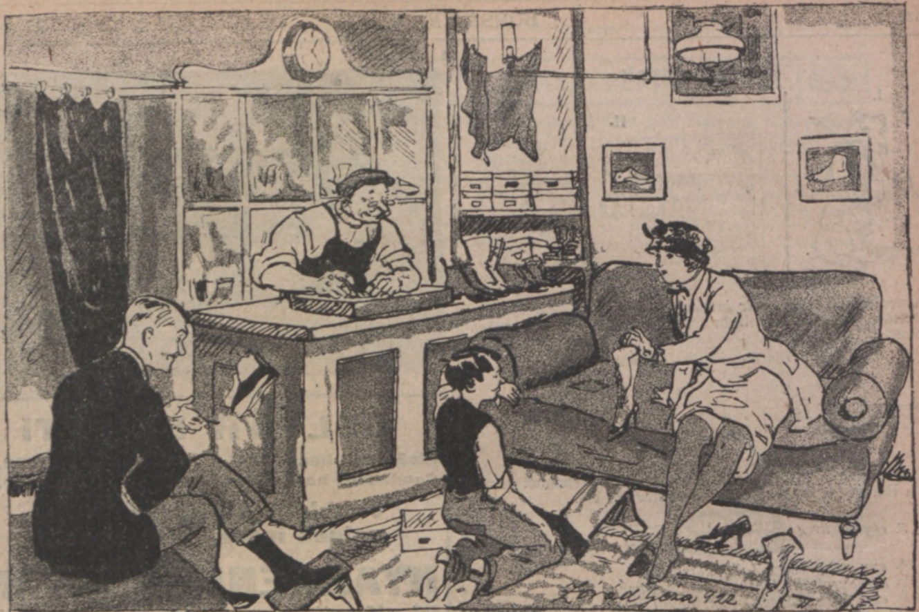
Férj. — Mi-i-i?... A feleségem cipője négyezer koronába kerül? Cipész. — Nagyságos uram, nálam nem szokták nézni azt, amibe kerül, csak azt, ami belekerül.