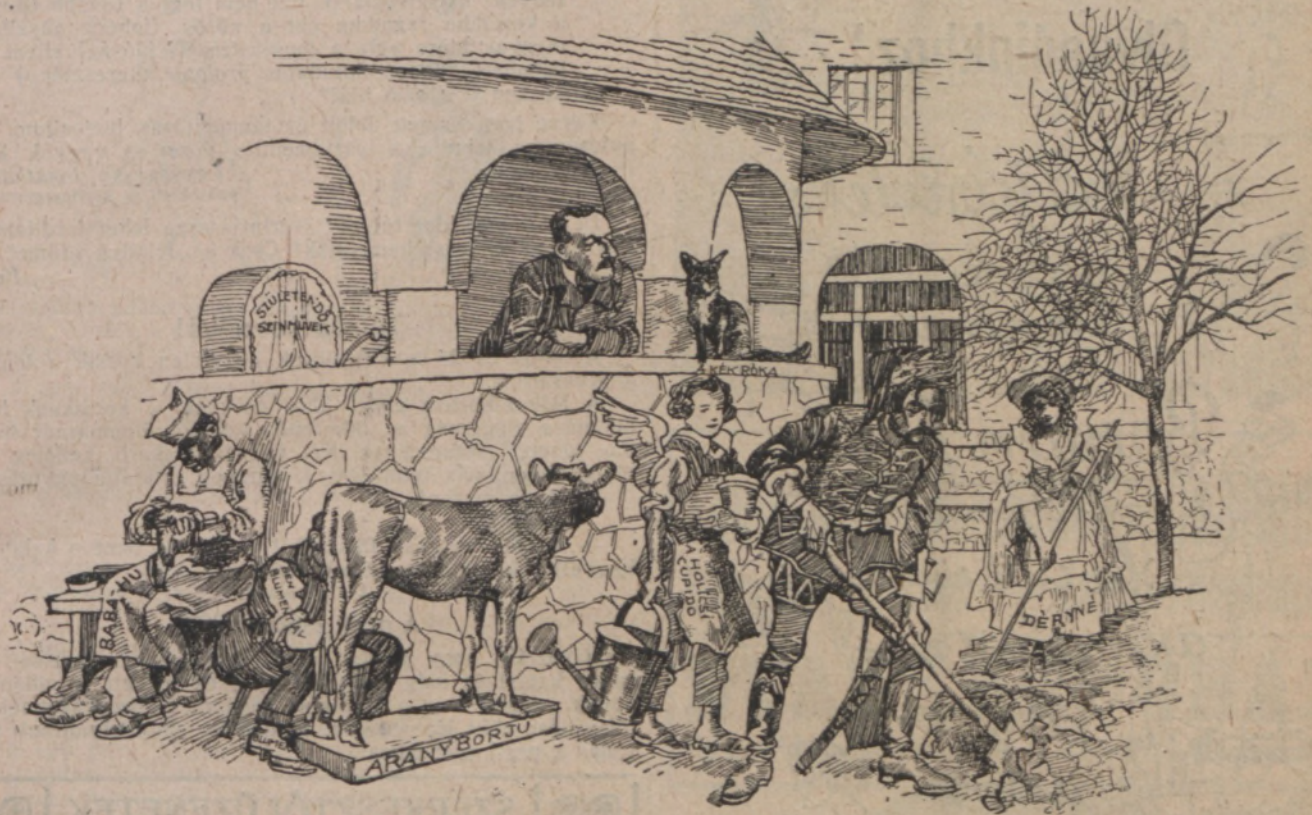
Idill a Hűvösvölgyben