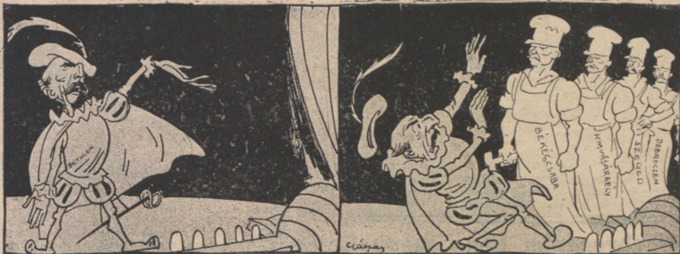
Bethlen-Macbeth a választáson Banquo * szellemét idézte — és a szocialisták jelentek meg.