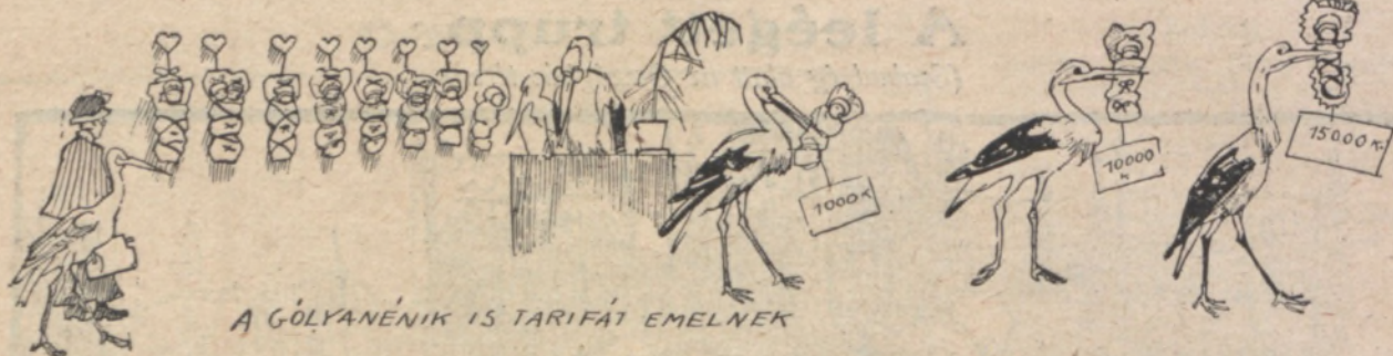
A GÖLYANÉNIK IS TARIFÁT EMELNEK