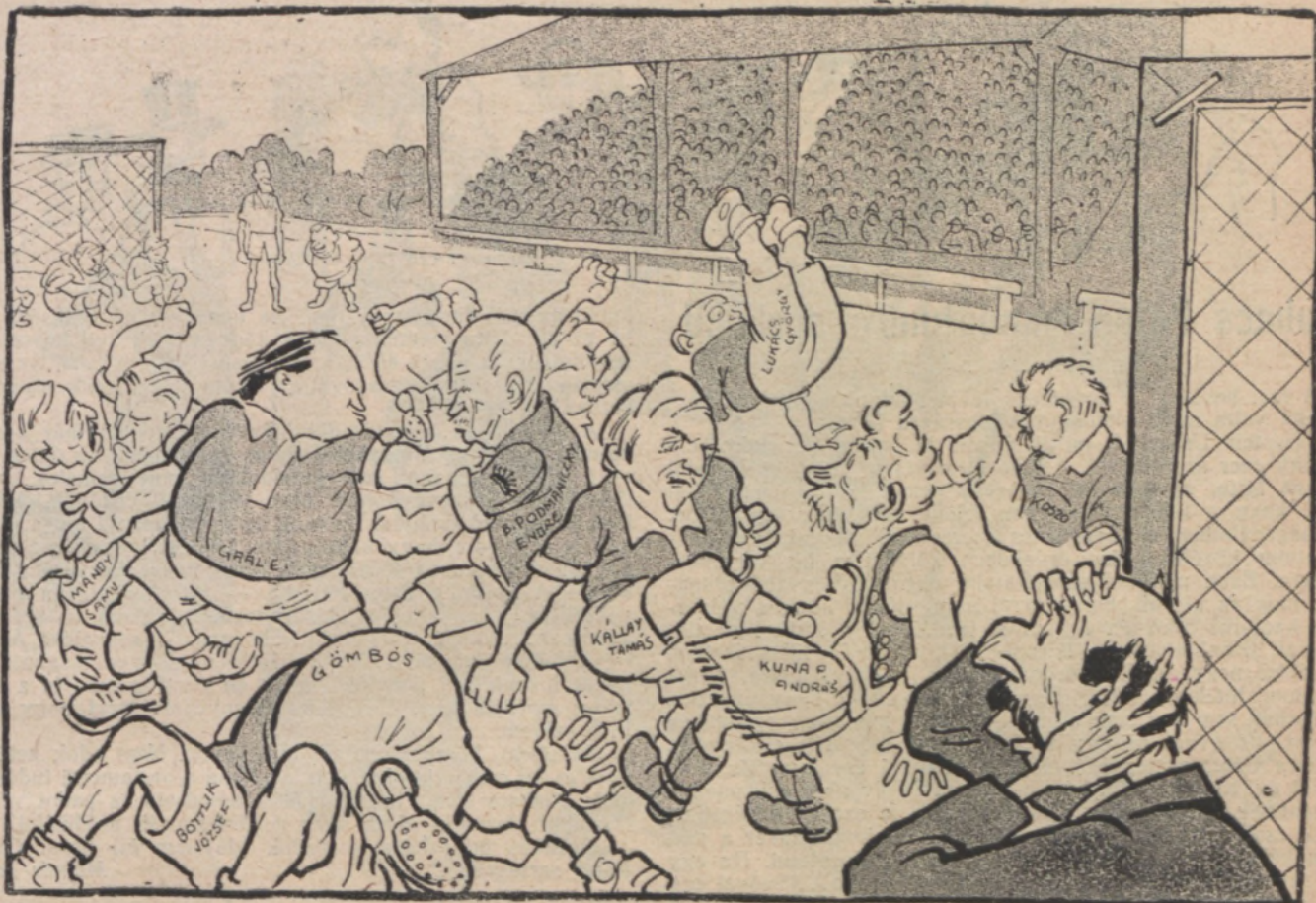
Bethlen, a manager. — Te jóságos isten, hiszen ezek egymás ellen játszanak!...