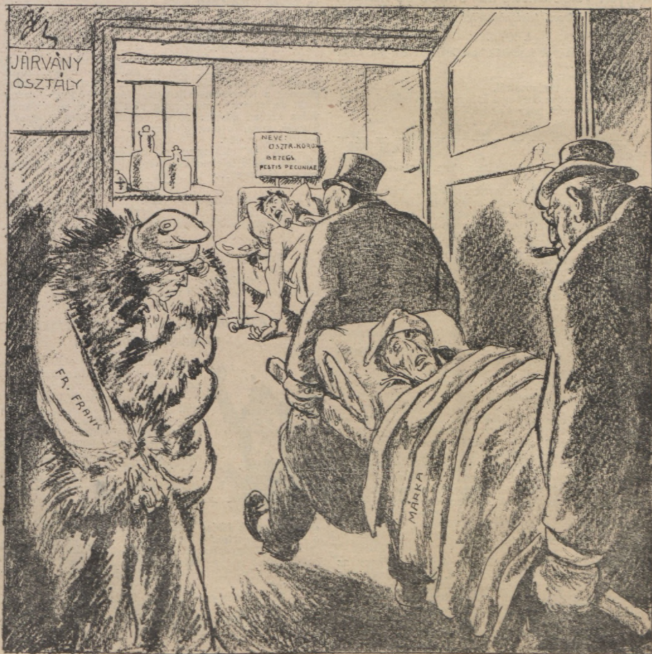
Herr von Mark. — Hasztalan itt az előkelőség, Madame... önt sem fogja elkerülni az epidémia.