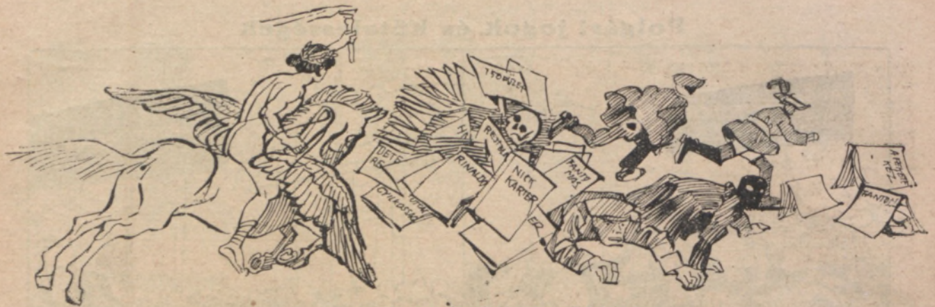
A PONYVAIRODALOM ELLEN