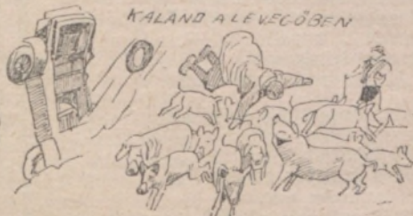
KALAND A LEVEGŐBEN