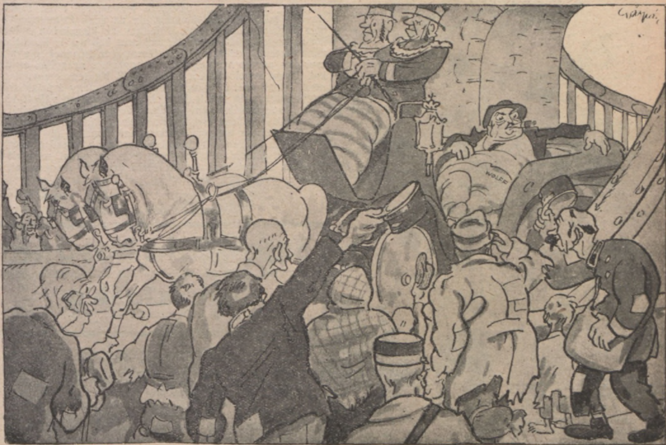
Pillanatfölvétel a budapesti hadszinterről