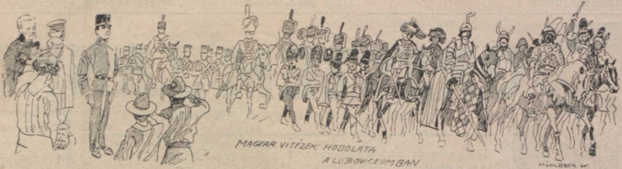
MAGYAR VITÉZEK HOZJOLATA A LUBOVICEUMBAN