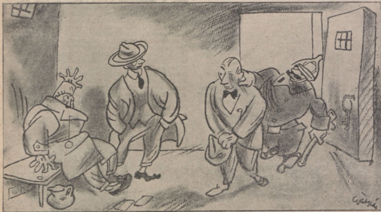
legelőször a rendőrség adja le a hivatalos zárlatot.