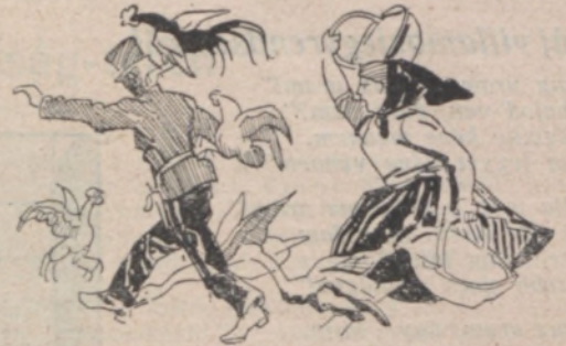
A PENZÜGYÖR ES A KOFA