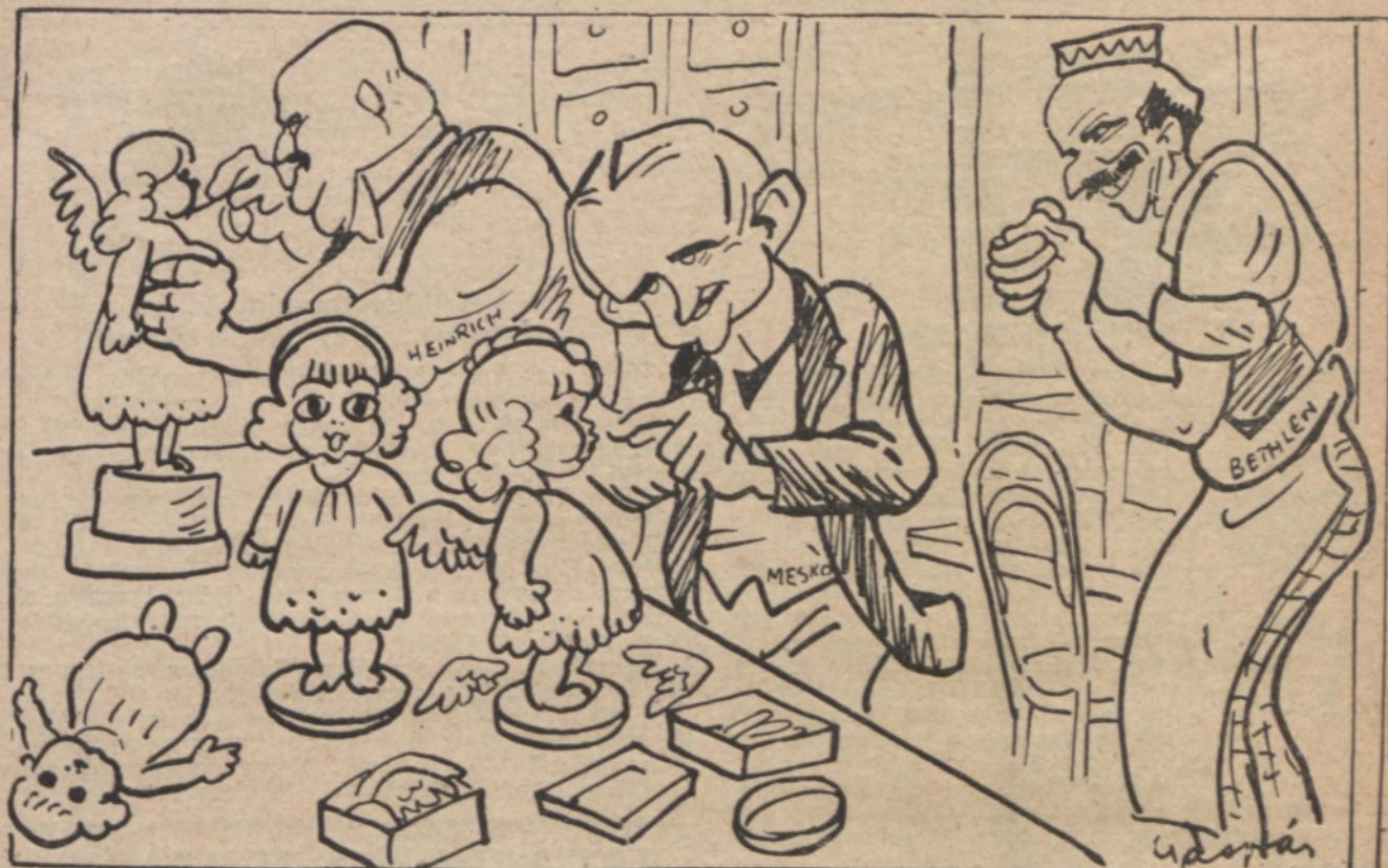
Bethlen. — Siessetek avval az angyalcsinálással, míg a szezon tart.