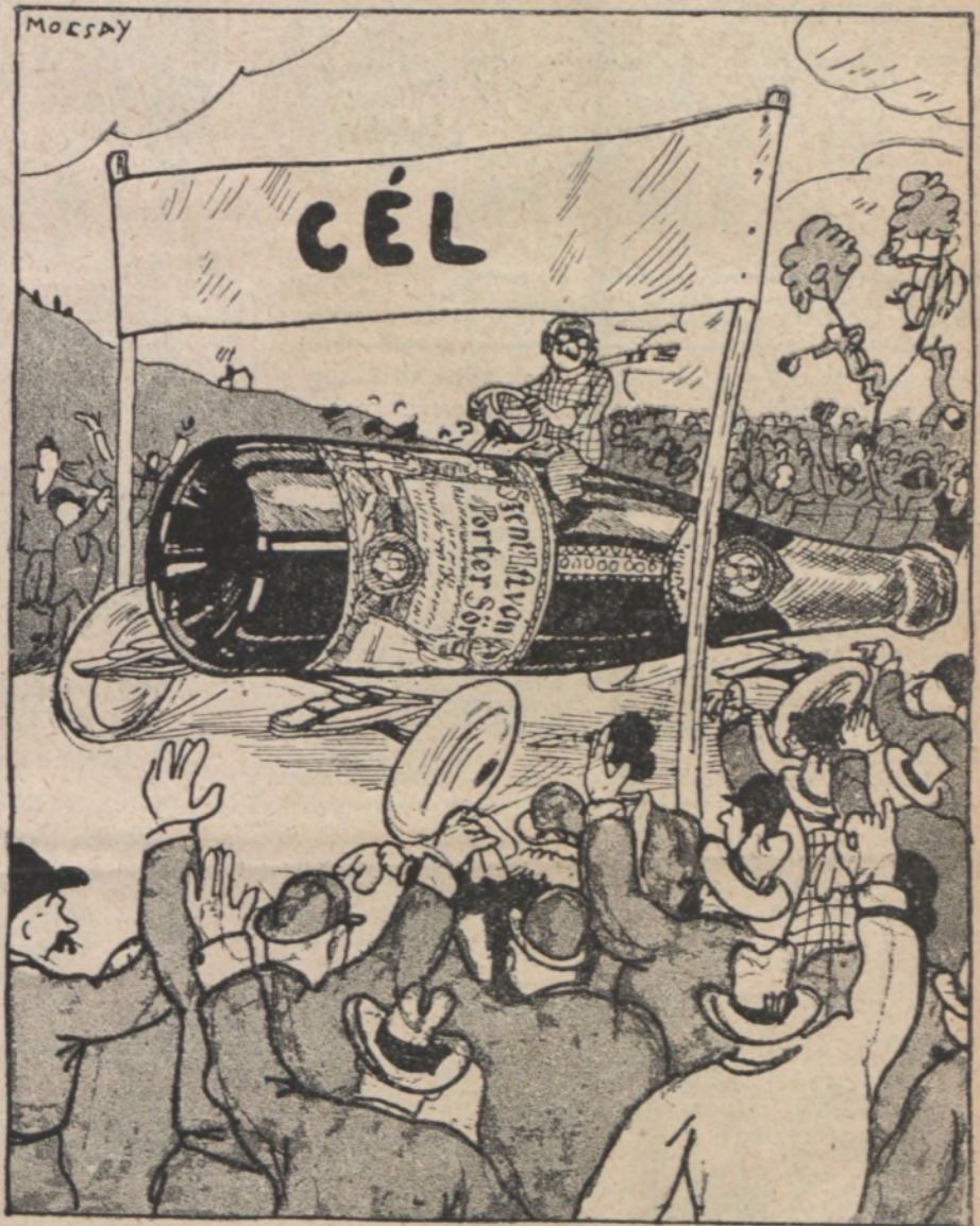
Mindig első — a Szent István Porter-sör!