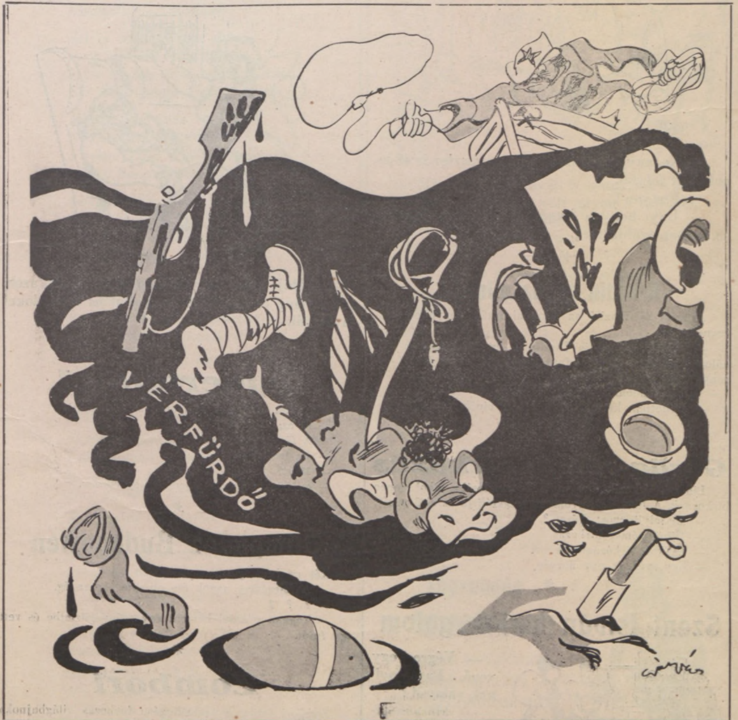
A SPANYOL BIKÁ: Már éppen elég volt ebből a fürdőszezonból. Ideje volna valahol partra érni.