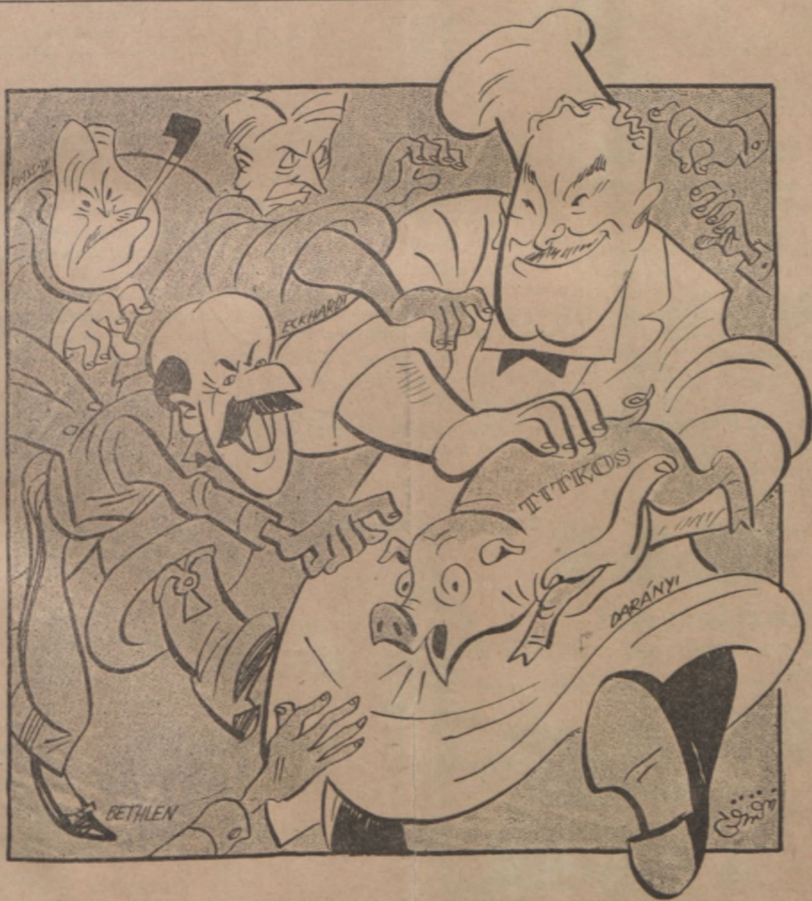
SZAKACS: Ilyen fiatal szegényke és máris mindenki nagyot akar főzni rajta...!