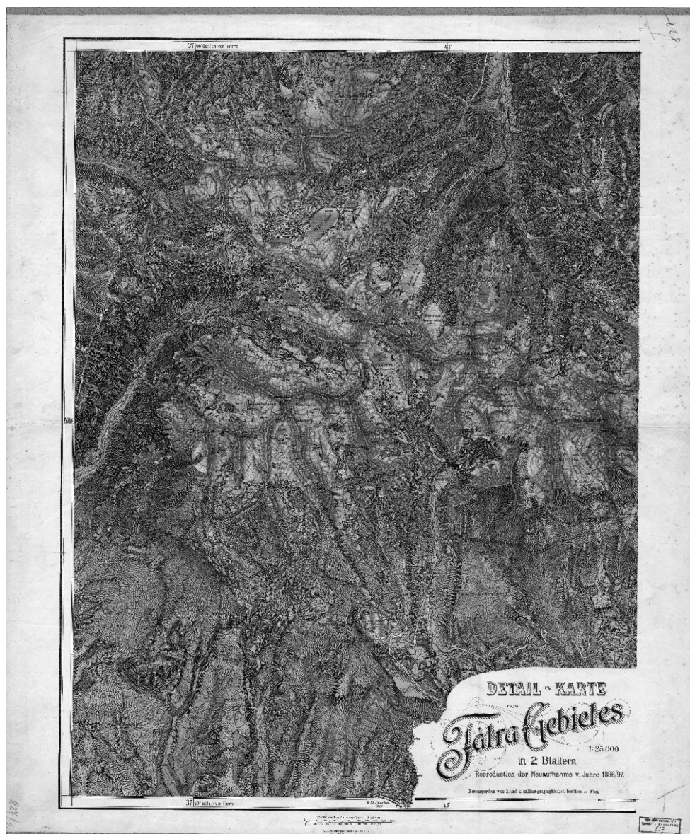
Forrás: ELTE Térképtudományi Tanszék Könyvtára, leltári szám: 827