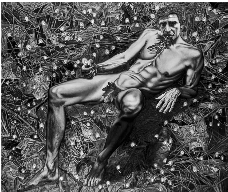
Jován György: A lány III. (Bajjós előérzet), 2021