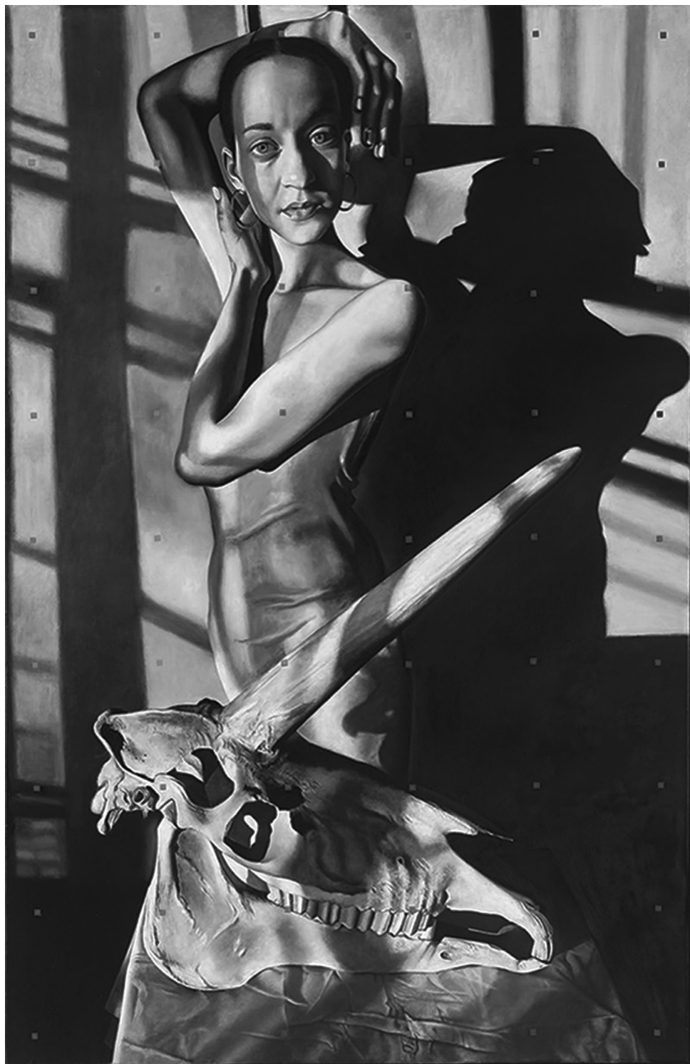
Jováni György: Lány unikornissal IV. (Hallás), 2018