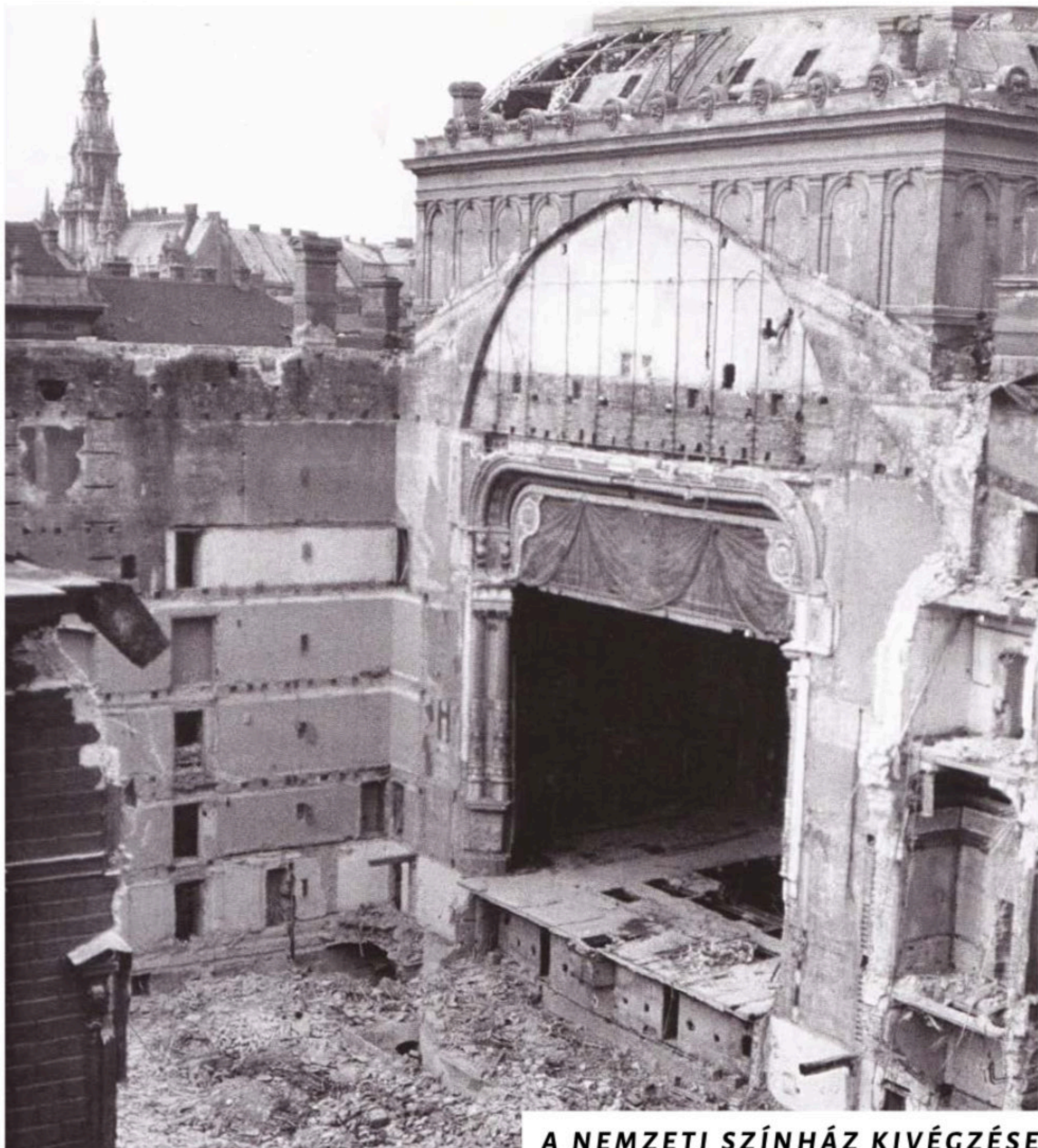
A NEMZETI SZÍNHÁZ KIVÉGZÉSE