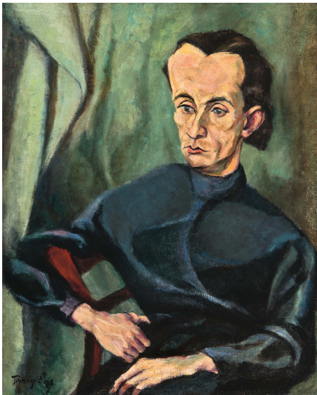
Tihanyi Lajos: Kassák Lajos arcképe, 1918 (olaj, vászon, 86×70 cm, Szépművészeti Múzeum – Magyar Nemzeti Galéria)