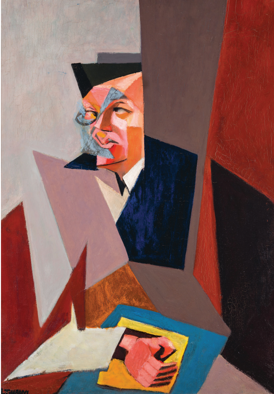
Tihanyi Lajos: Tristan Tzara arcképe, 1926 (olaj, vászon, 102×73 cm, Szépművészeti Múzeum – Magyar Nemzeti Galéria)