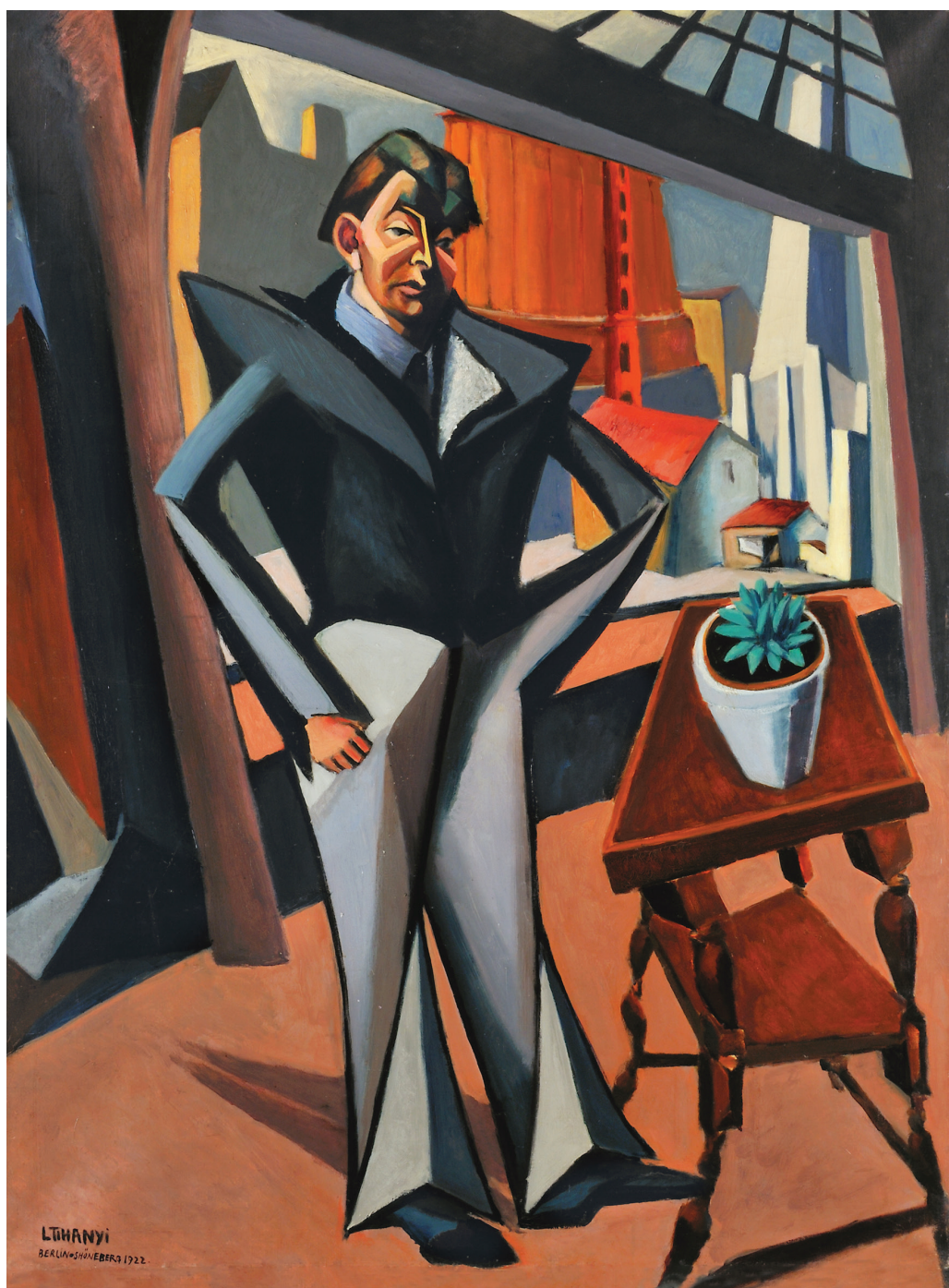
Tihanyi Lajos: Nagy önarckép intérieur (Ablaknál álló férfi), 1922 (olaj, vászon, 140,5×105 cm, Szépművészeti Múzeum – Magyar Nemzeti Galéria)