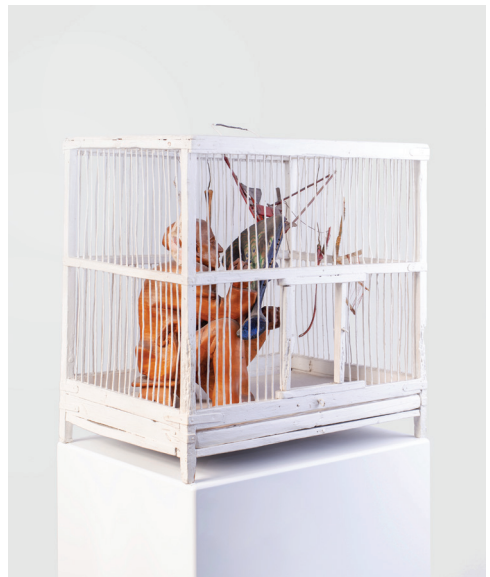
Szárnykészítő , 1975 (festett fa, csont, madárkalitka) [jl]