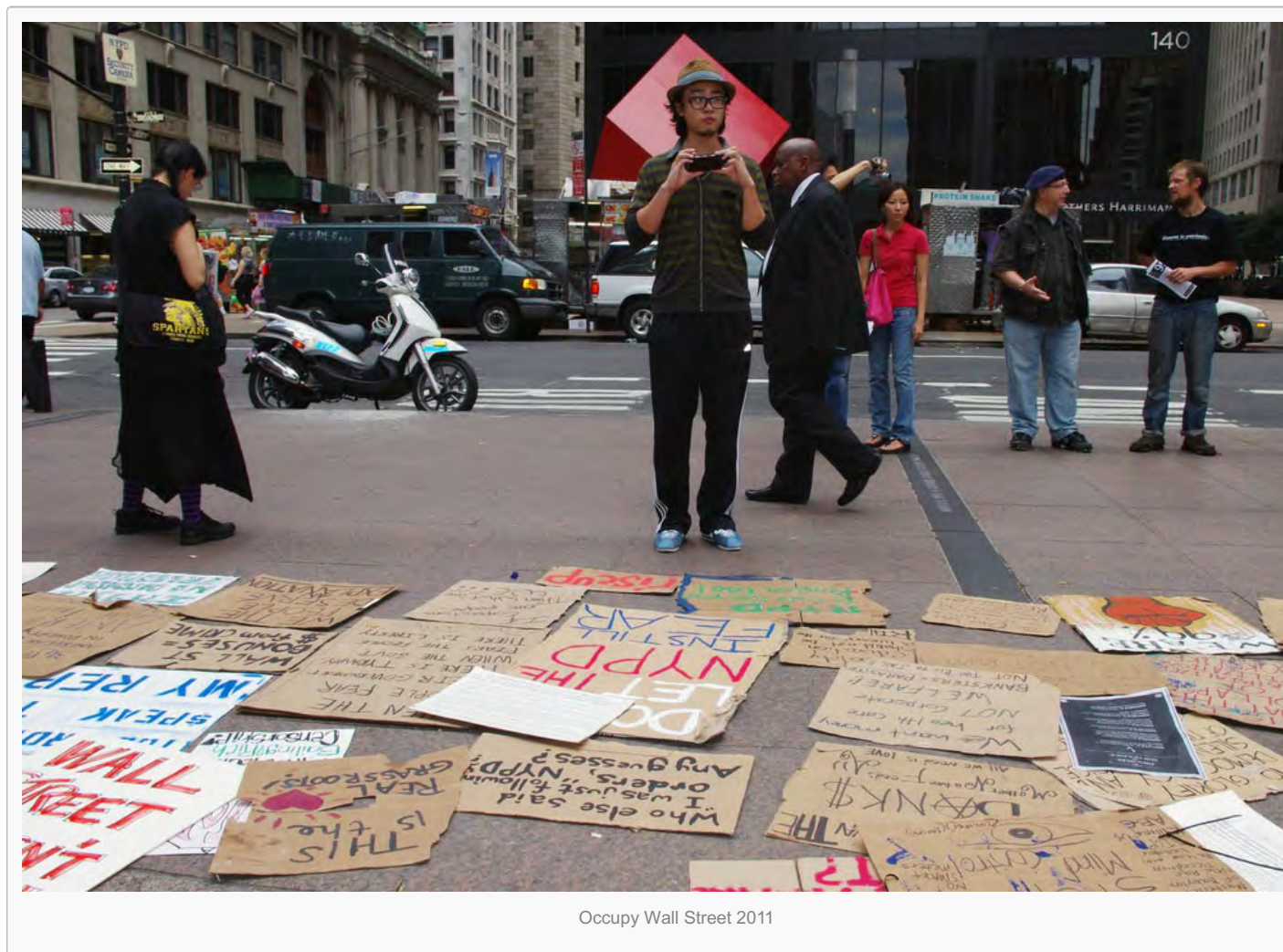
Occupy Wall Street 2011