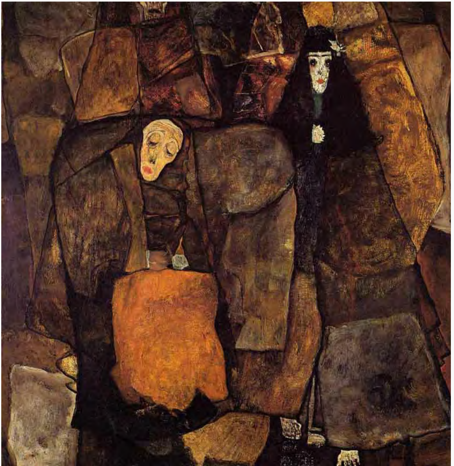
Egon Schiele: Körmenet