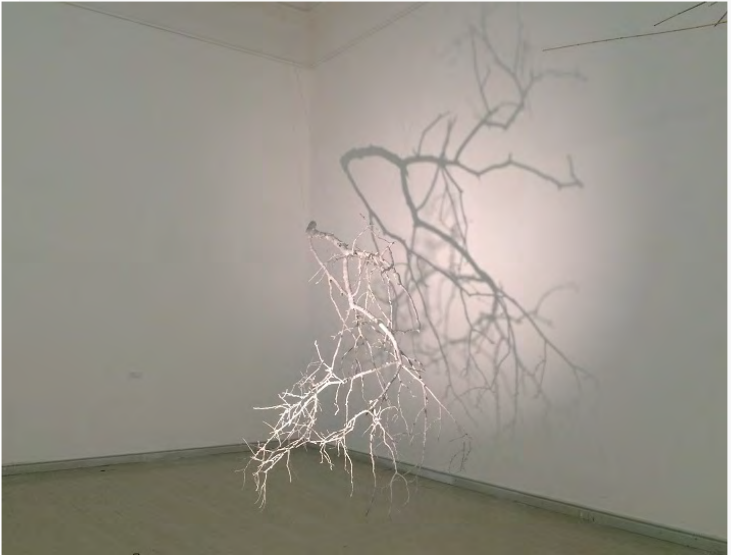
Természetművészet, Múcsarnok, 2016 kiállítási enteriőr