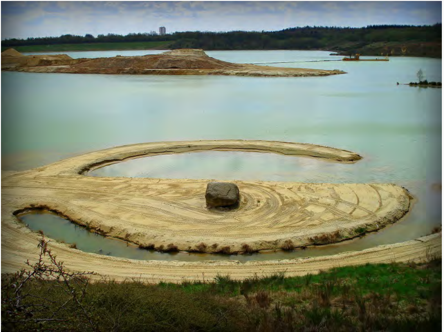
Robert Smithson: Broken Circle Spiral Hill 1971

Manapság új, környezetbarátabb művészeti irányzatok veszik át a hagyományosan az anyatermészet erejét dicsőítő művek helyét. A jellemzően együttműködésre épülő művészeti projektek bevonják a helyi közösségeket, a lokális kulturális és társadalmi szereplőket a környezeti rehabilitációba. Erre már a hetvenes években is volt példa, Hans Haacke Rajna víztisztító rendszer című 1972-es munkája során a Krefeld városában a Rajnába engedett szennyeződés mértékét és káros hatásait vizsgálta a helyi Haus Lange Múzeum felkérésére. A kéthónapos projekt alatt egy teljes biotechnológiai rendszert épített ki a művész, amely szűrők és vegyi anyagok segítségével megtisztította a Rajnát. A projektnek persze negatív sajtóvisszhangja támadt, amikor kiderült, mely magáncégek tehetők felelőssé a környezetkárosításért. A politikai reakciók jelezték [7]: a környezetvédelem nem választható el a társadalmi feszültségek kezelésétől. Ezt a bonyolult összefüggésrendszert Haacke „valós idejű társadalmi rendszernek” nevezi [8].