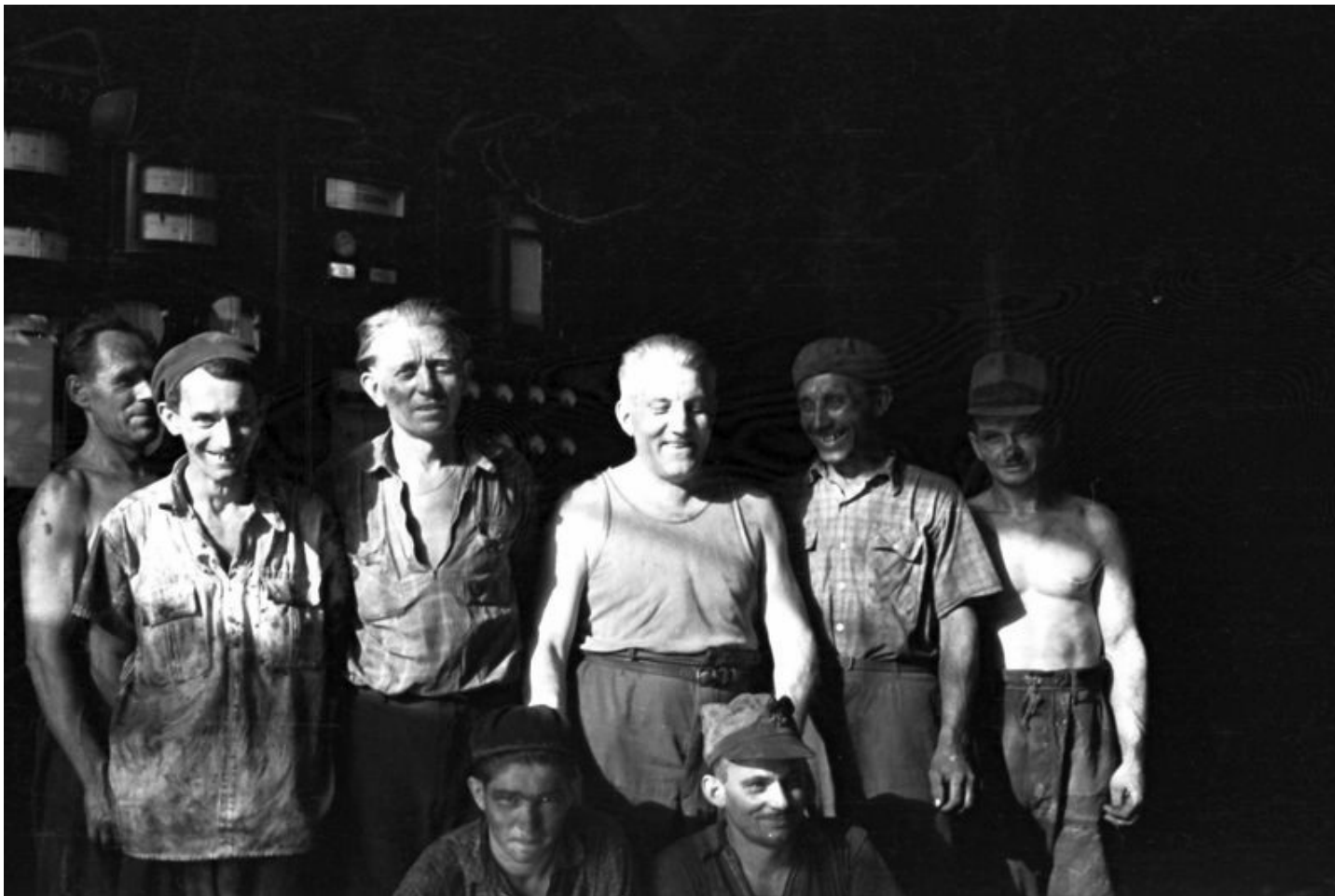
Kelenföldi Hőerőmű; 1957. Adományozó: Szánthó Zoltán.

Az ízlés fogalmában mindkét pólus – a társadalmi mobilitást lehetővé tevő és a represszív – jelen van, s bár az utóbbira koncentrálok, a probléma bonyolultabb, semhogy az ízlésfilozófiákat ki lehetne hajítani mint az elnyomás legitimálásának eszközeit. Az ízlés identitást alakító, ezáltal közösséget létrehozó hatása a társaság, illetve a társiasság egy máig létező modellje. Annak vizsgálata, kit és milyen elméleti alapon lehet kizárni az ízlés birodalmából, pedig különösen aktuális téma.