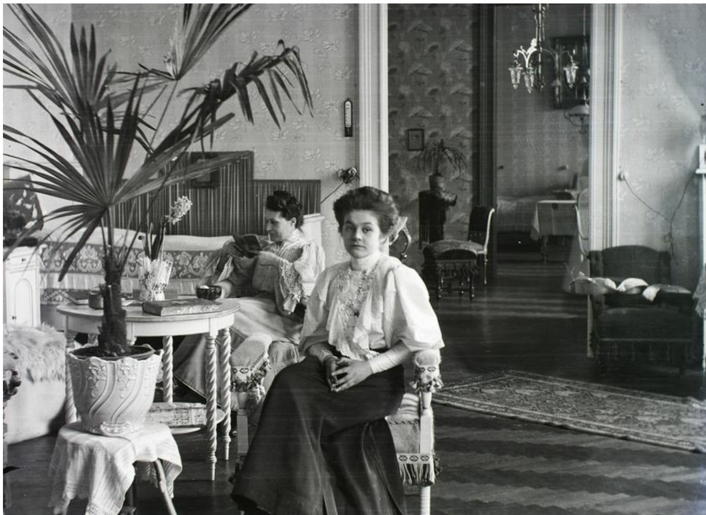
Adományozó: Schmidt Albin.

Az ízlés koncepciójában jelen van a felvilágosodás ízlésnevelésben látott demokratikus lehetősége és az autoriter, egyenlőtlenségeket újratermelő dimenzió is. Bourdieu elméletére támaszkodva, kifejezetten az utóbbira koncentráltam, és ezt a szempontot is csupán néhány kiemelt szerző megközelítésével érvényesítettem, ezért szükségszerűen nem alkothattam teljes képet az ízléelméletek Kantot megelőző történetéről. Az ízlés csiszolásának szociális vetületét alapul véve vizsgáltam a természetesség fogalmának jelentését a kora modern ízléelméletekben, s megpróbáltam rámutatni, az ízlés kutatásának szociológiai természetűvé válása nem jelenti, hogy a régi, normatív ízlésfilozófiák ma már ne tartalmaznának érvényes tudást a társadalmi interakciók természetéről, a politikáról mint az érzékelhető felosztásáról, s ne lenne lényeges figyelmet szentelni megoldásaik között húzódó – olykor kisebb, olykor nagyobb – különbségekre. A tárgyalt szerzők heroikus küzdelme természetesség és műviség meghatározásában és szétválasztásában mintegy megelőlegezi a természet kulturális konstrukciókénti felfogásának posztmodern problémáját, természet és kultúra éles elhatárolásának lehetetlenségét, természetes és mesterséges bináris oppozíciójának tarthatatlanságát.