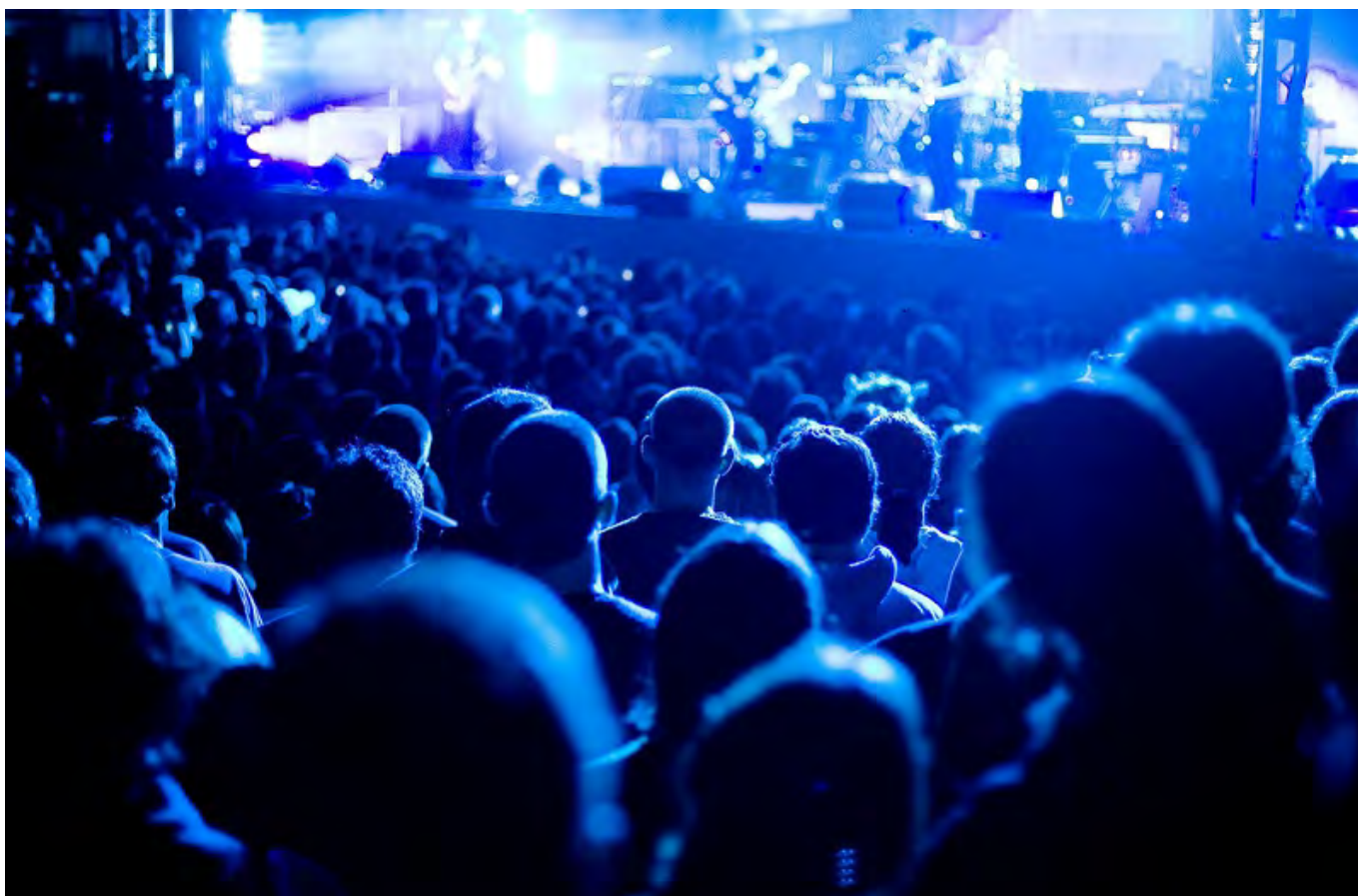
Thomas Hawk, flickr.com

A szorongást a máshol-nem-lét frusztrációja generálja, valamint a készültség: mi lesz holnap, hova menjünk este? A mindennapokból egyre ismerősebb stressz a szabadidőre is rátelepszik, és a valódi kikapcsolódás megoldása korántsem a technikai eszközök kikapcsolása. Minden választás stresszt jelent, hisz sajnálkozva írjuk a veszteség rovatba mindazt, amit nem választottunk. Magunkat azonban nem tudjuk kikapcsolni: egzisztenciális szorongásaink ősi eredetűek.