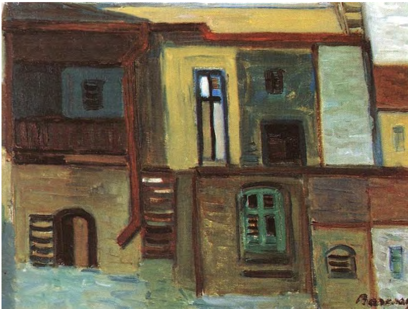
Barcsay Jenő: Házak, hung-art.hu

A csillagok háborúja trilógia filmjei[4] – az első három részt évtizedek választják el a későbbi folytatástól – elmesélik, hogy a régi köztársasági rend elitjének maradéka, a misztikus erejű yedik lovagrendjének néhány túlélője hogyan veszi fel a harcot a Galaktikus Birodalom ellen, s hogyan pusztul el a főgonosz, az Erő sötét oldalának hatalmával a galaxist leigázó császár és hadvezére, Darth Vader. Amikor évtizedekkel később az alkotók folytatják, az eredeti történet előzményeihez térnek vissza: a birodalom a történelem kiteljesedése, nem az érdekes, ami utána következik, hanem a hozzá vezető út. Az újabb részek a Galaktikus Köztársaság végnapjairól szólnak. A képsorok a galaktikus szenátus intrikáit és romlottságát mutatják meg, hogy miként lesz Palpatine szenátorból összeesküvések és fondorlatok segítségével császár, hogyan omlik össze a köztársasági rend a régi elit tehetetlensége és vaksága miatt.