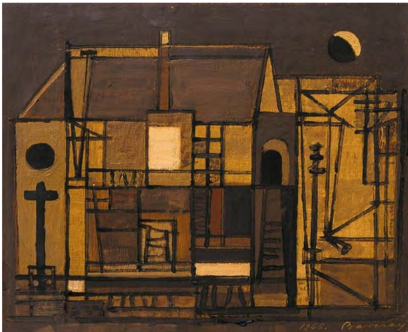
Barcsay Jenő: Sárga templom keresztrel, hung-art.hu

lényege a kulcsfontosságú történeti pillanatok egymás mellé helyezése. Reménye szerint így a jelen új perspektívába kerül: lehetőségessé válik az előttünk álló alternatívák felmutatása.[16]