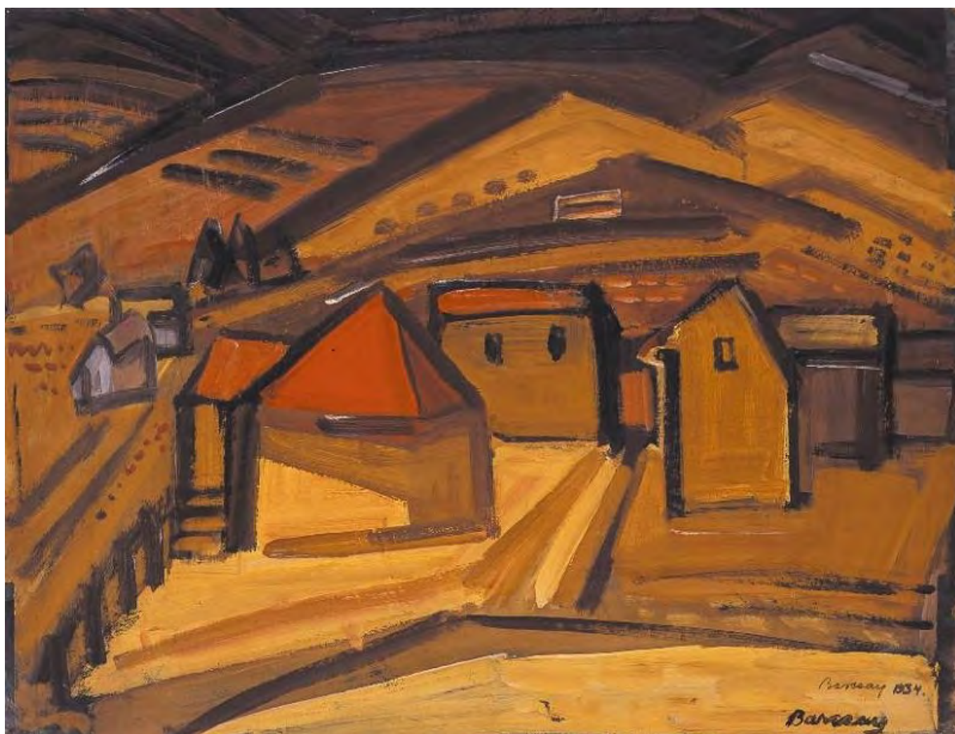
Barcsay Jenő: Szentendrei táj, hung-art.hu

Hogy valaki mennyire tartja vonzónak a David Engels által elkerülhetetlen birodalmi Európát, politikai értékválasztás dolga. Egy konzervatív alighanem hajlik arra, hogy rokonszenvezzen számos elemével, egy liberális elborzad tőle. Ám nehezen megkerülhető a kérdés: vajon a belga történész javaslata nem olyan orvosság-e, amely rosszabb, mint a gyógyítani kívánt betegség. A birodalmi kormányzat miért kevésbé álságos? Nem olyasféle berendezkedésekről van szó, amelyet Engels az i. e. 1. évszázad köztársasági Rómájáról írva republikanizmussal díszített dirigizmusként jellemez?[30]