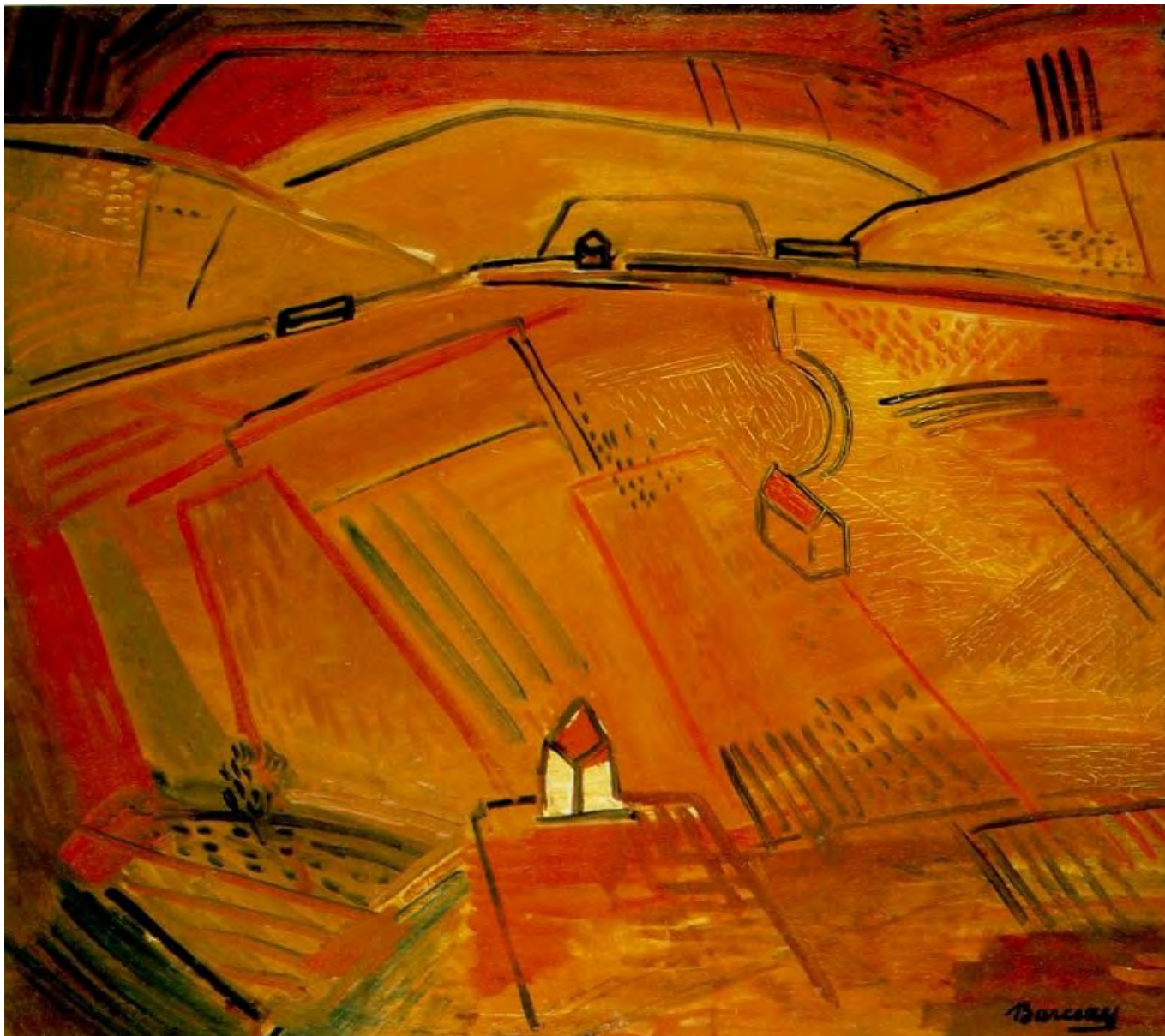
Barcsay Jenő: Dombos táj, hung-art.hu

Az új autoriter birodalmi kormányzat legfontosabb feladata a közbiztonság helyreállítása, a lakosság félelemérzetének megszüntetése. Sor kerül majd a véleménynyilvánítás szabadságának korlátozására, de túl nagy sokkot ez vélhetőleg nem okoz, mert a terrorizmus miatt hozott intézkedések jó ideje előkészítették a terepet. Az új autoriter civilizációs birodalmi államban a polgárok részvétele a rendszeres vélemény-megkérdezésekre, afféle nyilvános konzultációkra korlátozódik; ezeket összekötik egy széleskörű, a szóban forgó probléma kormány által elképzelt megoldását egyedül helyesnek beállító propagandával. Így biztosítható az egyébként már előre elhatározott döntések többségi igazolása. Az autoriter kormányzat ezzel azt