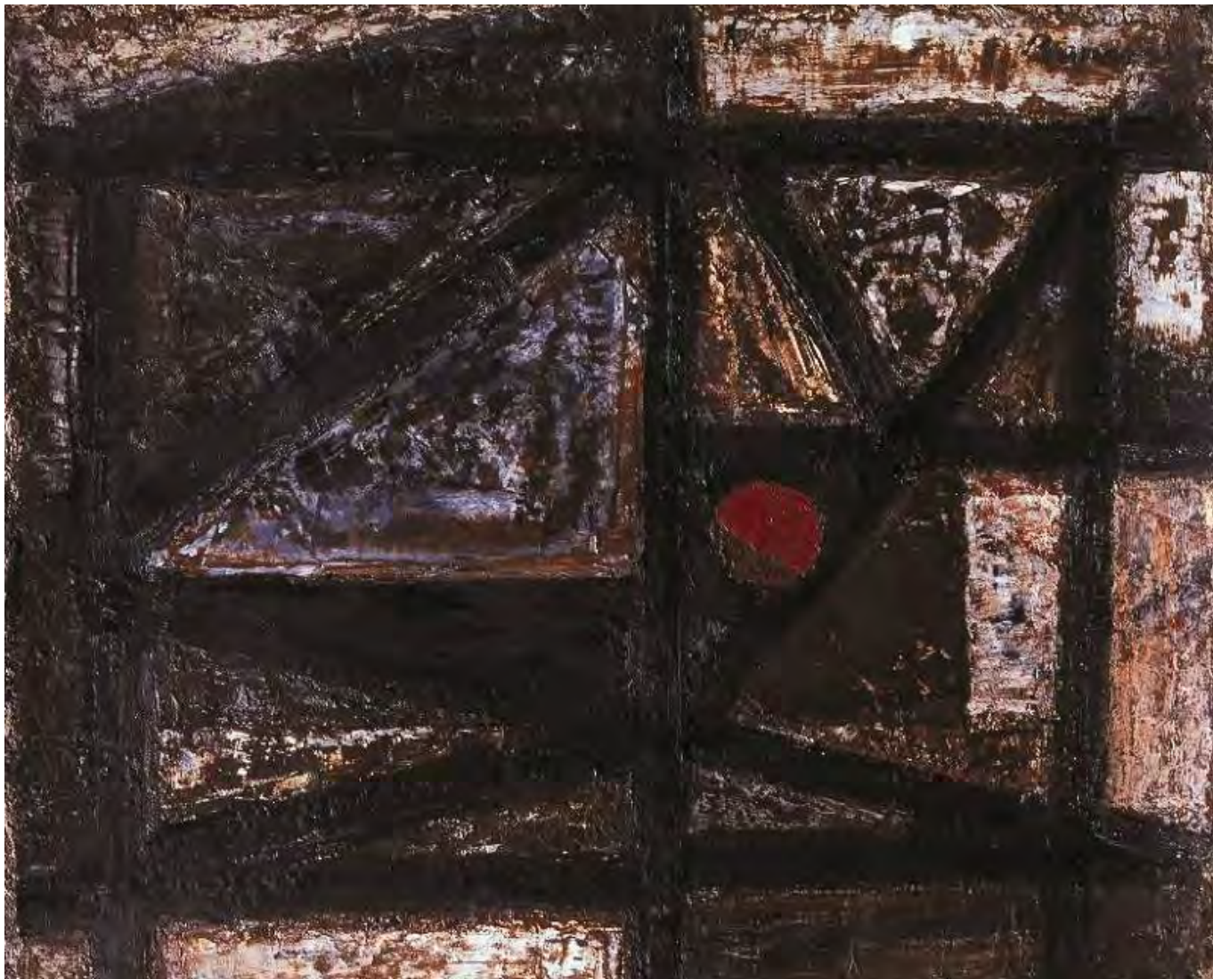
Barcsay Jenő: Csendélet