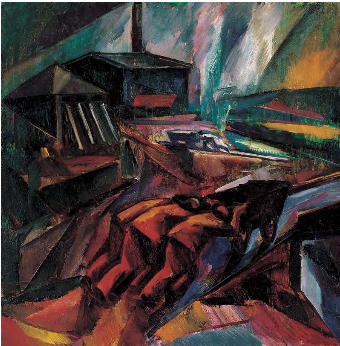
Barcsay Jenő: Bánya, hung-art.hu

A végeredmény is hasonló: a demokrácia mindinkább homlokzattá válik, amely mögött oligarchikus érdekcsoportok harcolnak a hatalmi-gazdasági pozíciókért. A hagyományos etikai értékek megkérdőjeleződnek, a család felbomlik; a szélsőséges individualizáció következtében a társadalmi szolidaritást felváltja az anyagi jólétet a spirituális-szellemi kiteljesedés elé helyező önmegvalósítás vágya. Az Európai Unió