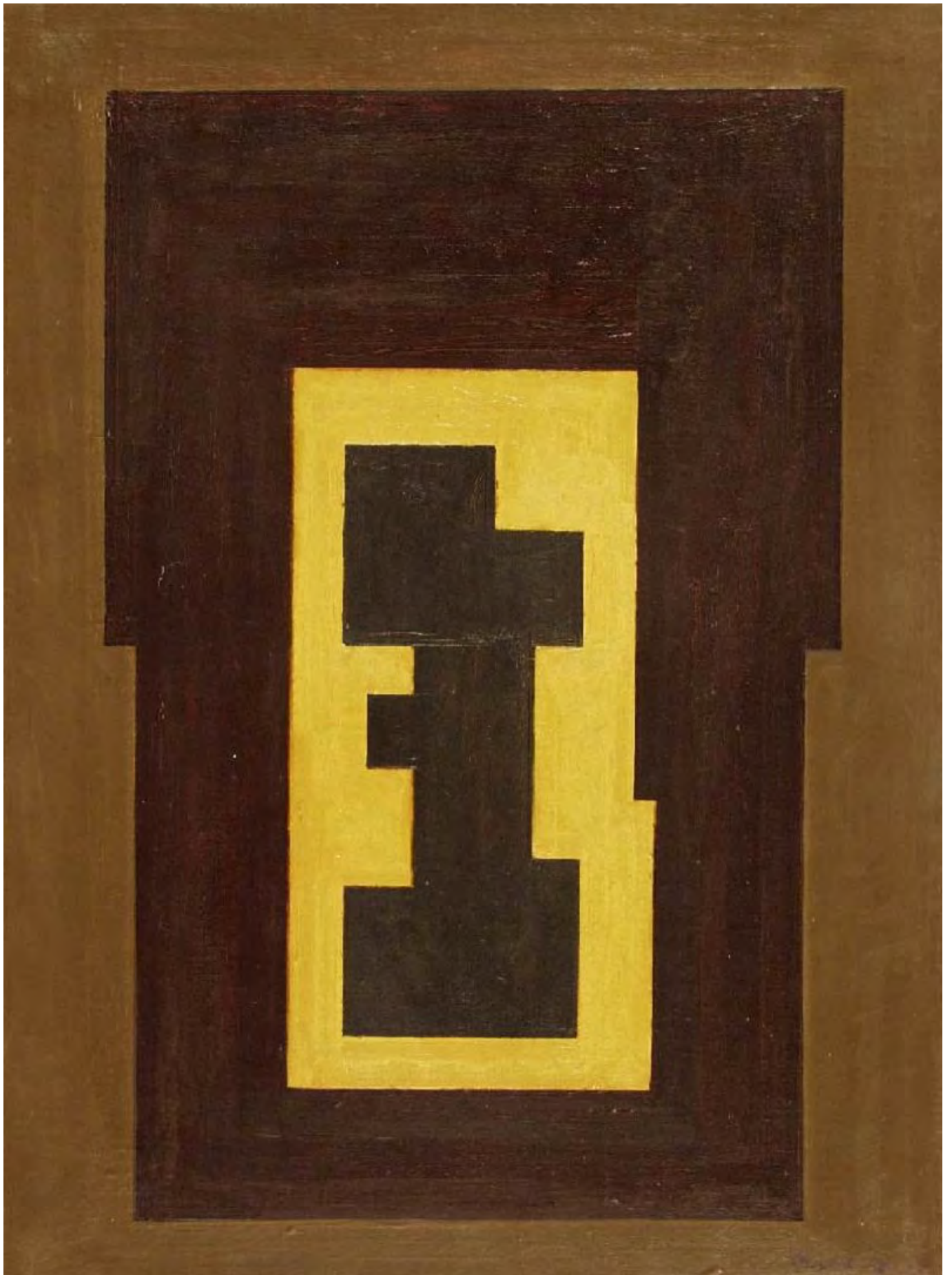
Barcsay Jenő: Szorongás, hung-art.hu