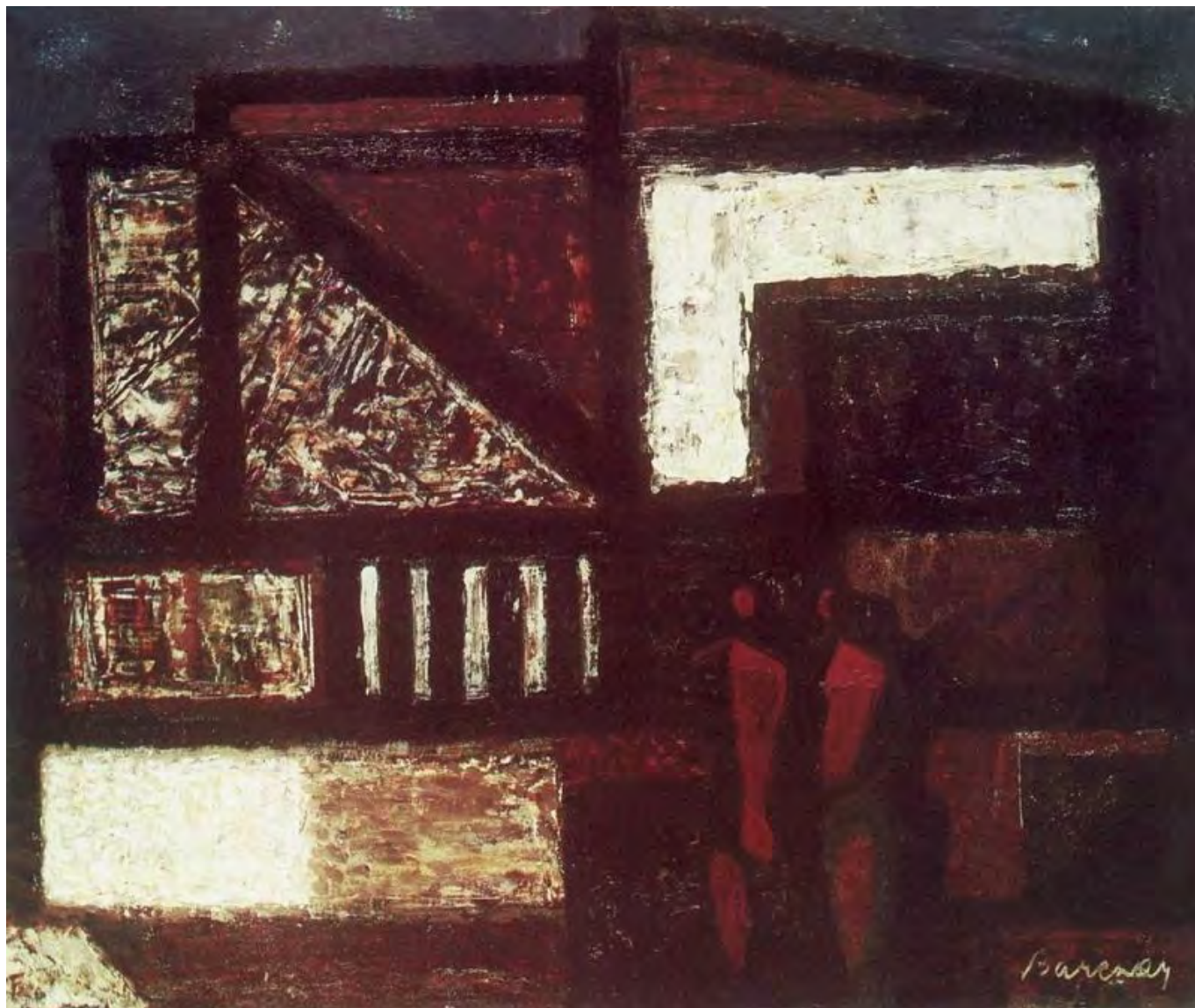
Barcsay Jenő: Gyár

Csak egymásra rétegződött múltbeli tapasztalatok dinamikus összességként; csak így tudja betölteni konfliktuskezelő, kompenzáló, problémaértelmező, orientáló, a kultúrát átlelkesítő funkcióját, amely a tagok számára lehetségessé teszi a közösség céljaival – nemcsak értelmi, hanem érzelmi – azonosulást. Az identitás nem csupán közösen elfogadott értékek mechanikus összegződése, hanem organikus egész, amelynek egyedisége alkotórészeinek sajátos és megismételhetetlen konstellációjából fakad.[19]