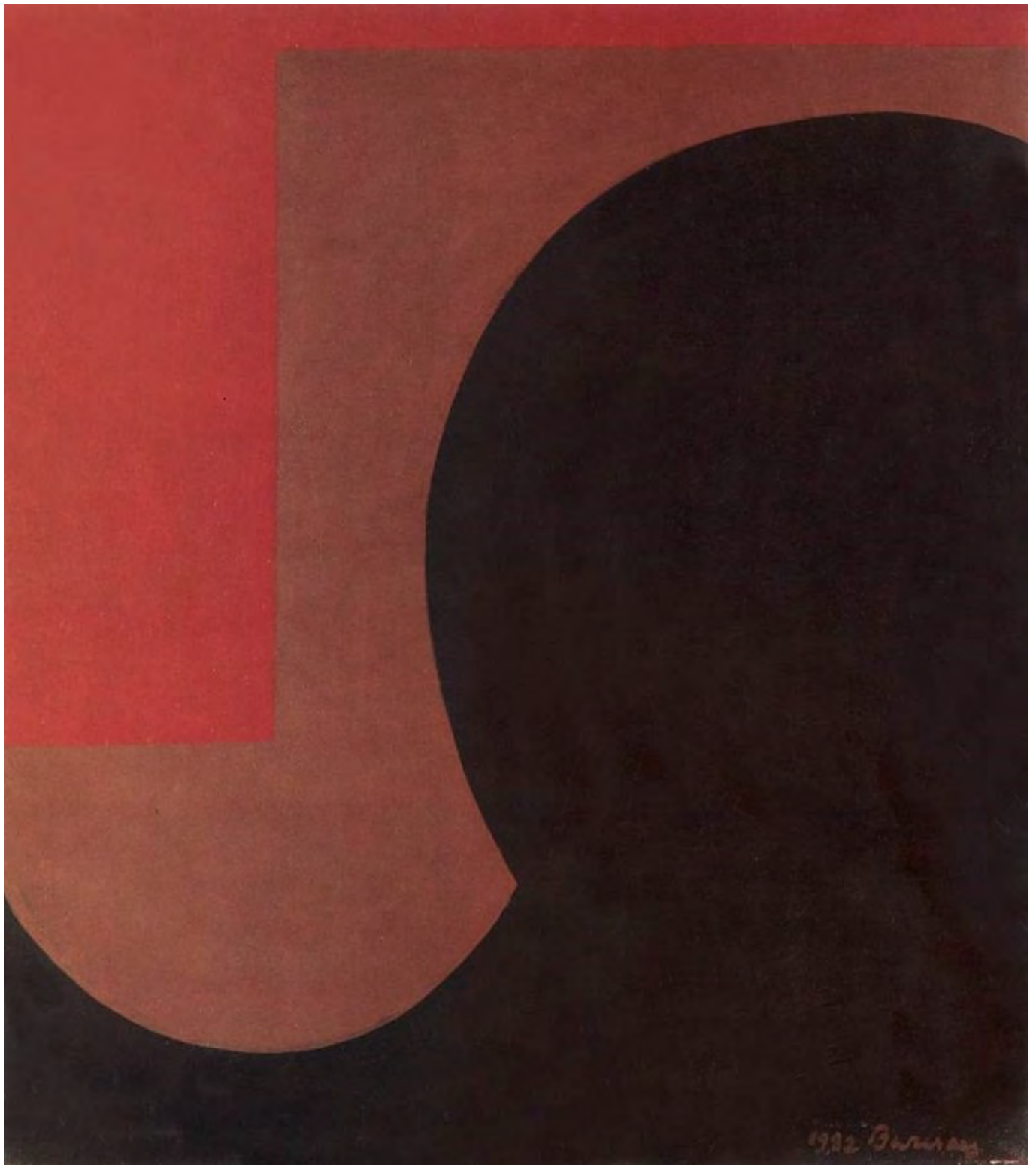
Barcsay Jenő: Titokzatos figura

Környezetével szemben határozott felsőbbiségtudattal rendelkeznek. Ennek alapja a birodalmi civilizáció szomszédaival szembeni fölénye és a polgárainak biztosított magasabb életszínvonal, amely annak ellenére létezik, hogy a centrum és a periféria között ebben a tekintetben komoly különbségek mutatkoznak. Fontos jellemzője a