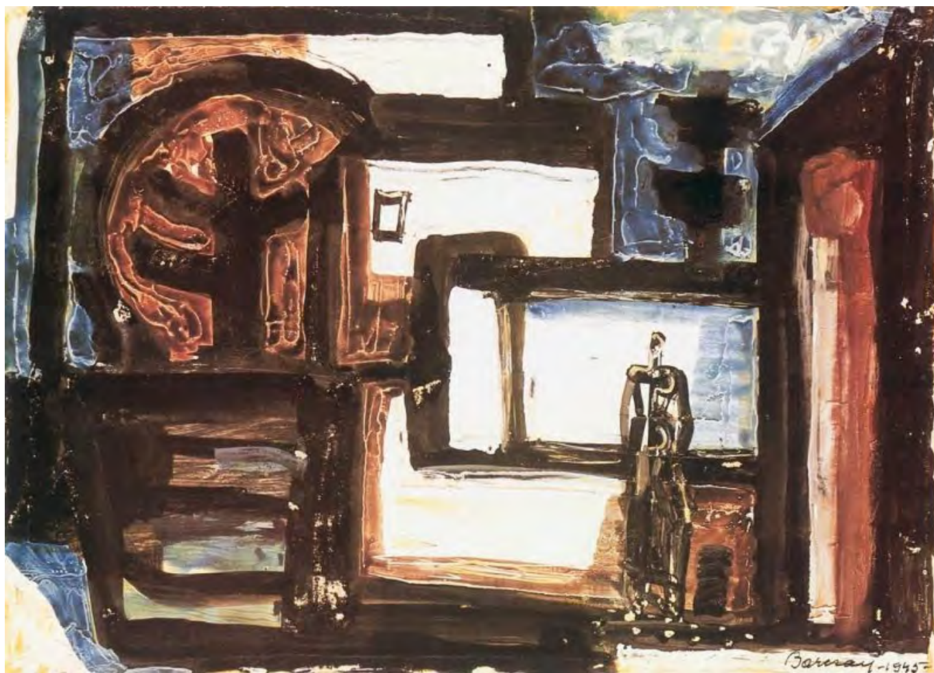
Barcsay Jenő: Templomudvar, hung-art.hu

Osztrák–Magyar Monarchiája és a Hohenzollernek Németországa régi formájában megszűnt. Legrosszabbul az Osztrák–Magyar Monarchia járt: az államforma változása nem csupán kisebb-nagyobb területvesztéssel társult, mint Oroszország és Németország esetében, hanem a régi politikai keret teljes szétesésével. Helyét nemzetállamok foglalták el. Valami hasonló történt a félig európai, félig ázsiai Török Birodalom esetében, azzal a különbséggel, hogy itt egyedül a hajdani birodalom uralkodó etnikuma, a török tudott egy modernizációs ideológia – a kemalizmus – jegyében nemzetállamot szervezni; a birodalom hajdani tartományai népszövetségi mandátumként különböző európai hatalmak protektorátusává lettek.