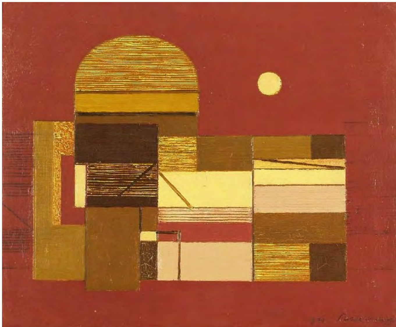
Barcsay Jenő: Este, hung-art.hu

Coudenhove-Kalergi azokra a jegyekre gondol, amelyekkel az európai civilizáció sajátos jellegét szokták leírni: az antik és keresztény hagyománytól, a reformációtól és a humanizmustól a felvilágosodásig és a modern eszméig.[9] A mából, az Európai Unió valóságából visszatekintve nyilvánvaló a koncepció gyenge pontja: közös politikai és gazdasági intézmények és az európai magaskultúra teljesítményei az egységes Európát legfeljebb elit-projektként – az európai felvilágosult abszolútizmus hagyományait követve – képesek megalapozni, de hogy mennyire tudnak orientációs pontokat szolgáltatni egy közös európai identitáshoz, az bizony fölöttébb kétséges. Márpedig ha ez így van, akkor csak a birodalom marad végső menedékként az egységes Európa számára.