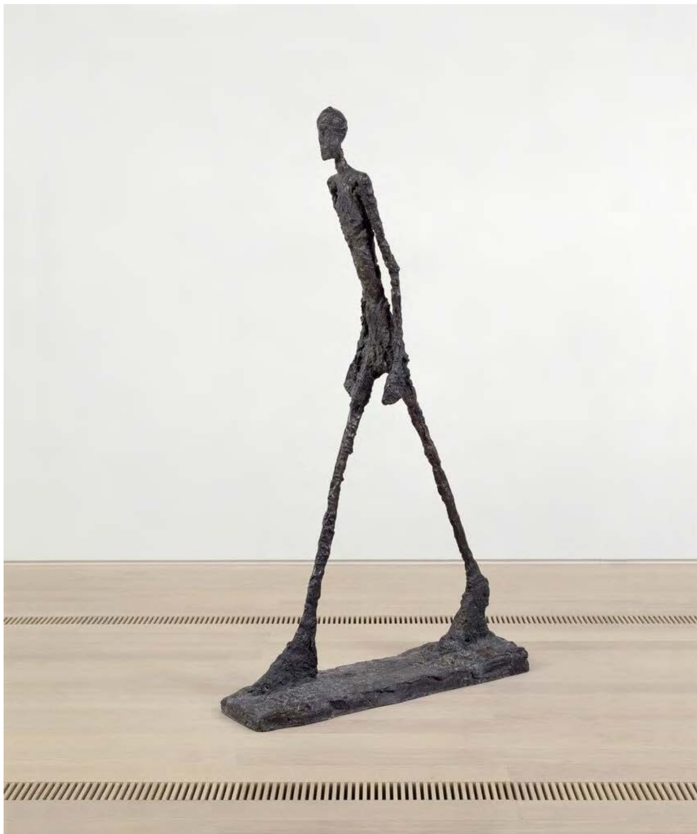
Alberti Giacometti: Masírozó férfi

gestusok mágiája” – ahogy Sartre fogalmazott, „mindig félúton a semmi és a lény között”. Furcsán magányosak, távoliak, csendesek, szabálytalanok, szinte megközelíthetetlenek és mégis intímek, intenzívek. Súlyosak és súlytalanok.