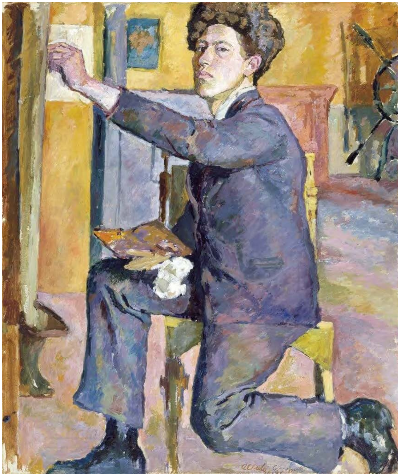
Alberto Giacometti: Önarckép

A húszas években párizsi életük berendezésekor legfőbb modellje öccse, Diego, akiről a rajzok, szobrok mellett közös portrékat is készített. Sokan hasonlítják kapcsolatukat a Van Gogh testvérek, Vincent és Theo bensőséges viszonyához. Ekkoriban festett