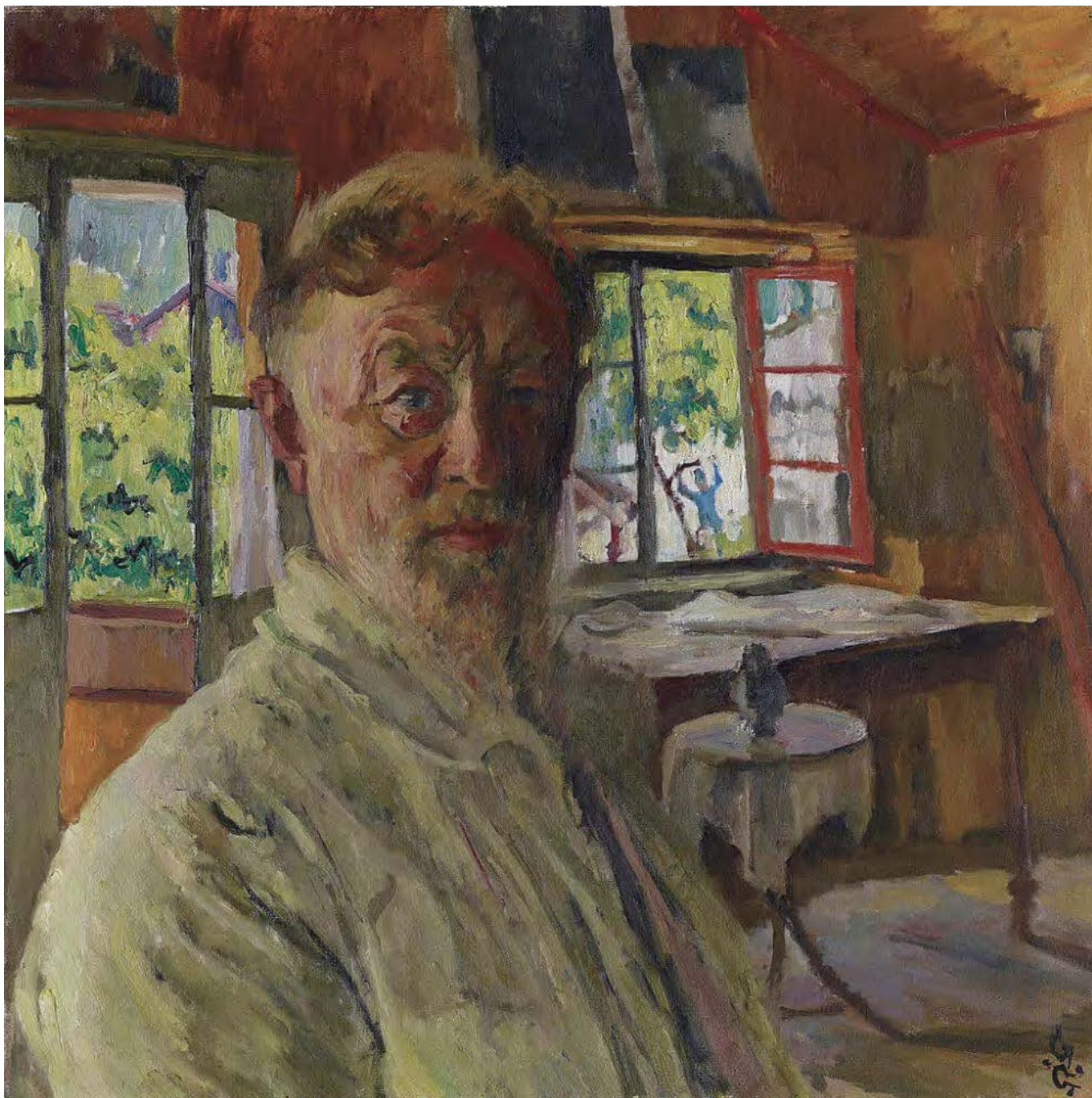
Giovanni Giacometti önarcképe

gyakran látogatta meg a Giacometti családot és kísérte figyelemmel a gyerekek munkáit. Alberto ceruzával és ecsettel bebarangolta és megörökítette a völgyet, a hegykoszorút, rögzítette szülőhelye látványait.