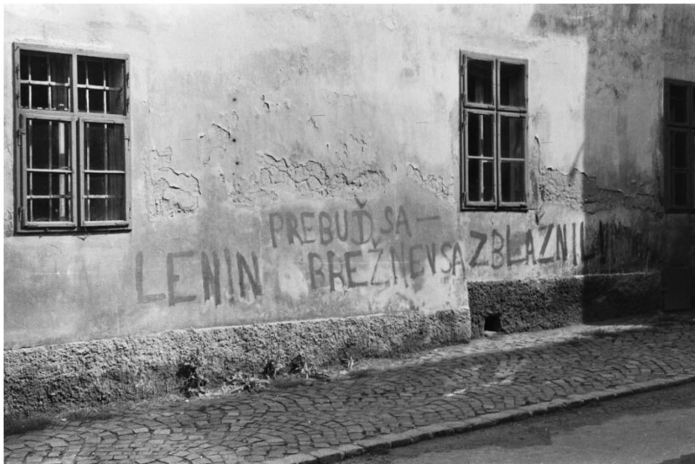
A felirat magyarul: „Lenin, ébredj, Brezsnyev megőrült”, Prága, 1968

Nyilvánvaló, hogy Lukács tragédiaként éli meg a Varsói Szerződés csapatainak csehszlovákiai bevonulását. Eörsi beszámolója szerint nem sokkal a bevonulás után így sóhajtott fel: „az 1917-ben kezdődött kísérlet alighanem kudarcot vallott, és az egészet majd máskor és máshol kell elkezdni.” [8] Az életművét egyetlen organikus fejlődés eredményének tekintő Lukács viszont nem engedi meg magának, hogy e nézetét teoretikus formában is kifejtse. De azt sem gondolja, hogy párthűsége és az agresszív pártpolitika közötti különbségek „partizánharcok” vagy kvázi-vallásos lelkesültség által leküzdhetők. Lukács teoretikus megoldása, hogy hűségének és pártjának konfliktusát világtörténeti perspektívába helyezi. A narratíva szerint, amely a demokratizálódás -tanulmányban is hangsúlyt kap, a marxizmus felvetései helyesek voltak, és annak a forradalmi élcsapatnak a szerepe is megkerülhetetlen, amelyhez Lukács hűséges. De a létező „szocialista” rendszerek nem tipikus formái a szocializmushoz tartó útnak, következésképpen újabb és újabb torz és embertelen társadalmi formációkat eredményeznek. [9] E „patologikus” fejlődés sajátosságai