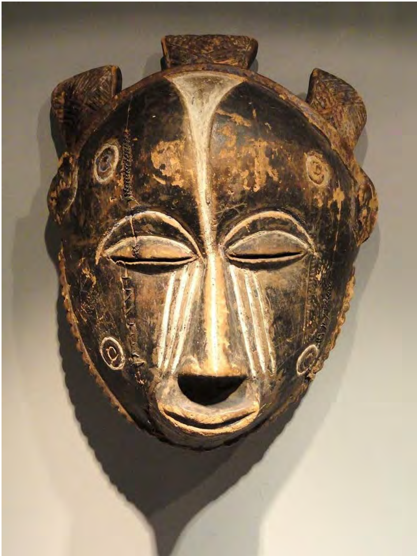
Törzsi maszk, Kongó