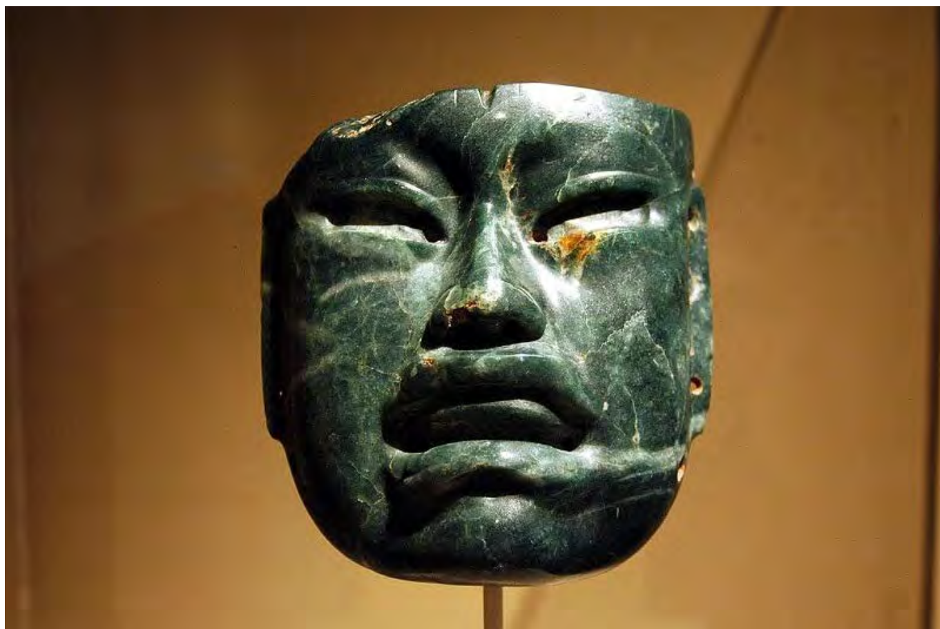
Olmec jádekő maszk

Zavarodottságunkat, mint látjuk, nem Derrida idézi elő, de tovább fokozza radikális alapállásával. Egyes értelmezők rámutatnak, [10] hogy maga is a nyugati emberre telepedő skizofréniától szenved, melyben kénytelen két, egymással már nem kommunikáló világ, a szent és a profán között szétszakítania magát. Én inkább azt mondanám, hogy Derrida, számot vetve a szétszakítottsággal, megpróbál a két világ határán maradni, ahol az abszolútum, a normativitás és a moralitás (szent) követelményei még a társadalmi cselekvések, az etika és a politika (profán) világának mértékévé válnak. A feltétlen (morális) és a feltételes (politikai) viszonyrendszerének felmutatásával nem elkendőzni, inkább megtapasztalttá szeretné tenni egyébként mindenkor aporetikus léthelyzetünket. A szemrehányás, hogy a tényleges praxissal nem törődve, csak „a kulturális örökség, s nagyon erősen a vallási hagyomány által alakított fikciós képzetekben” fejt ki a kérdést, szintén nem állja meg a helyét.