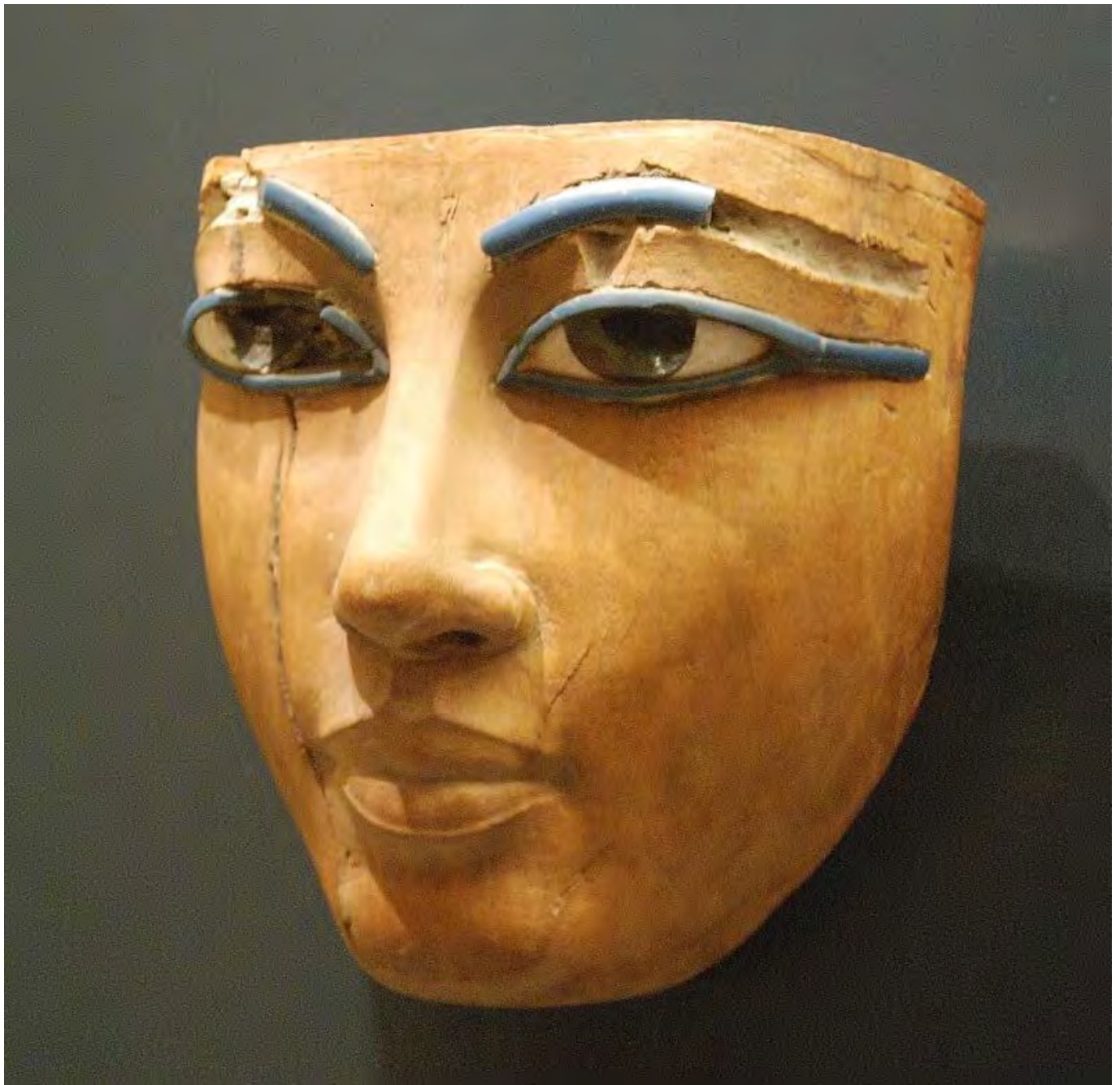
Ókori egyiptomi temetési maszk, Wikimedia Commons

A ház urának szuverenitása köré épülő vendégbarátság hagyományos alakzataiban a jövevény valójában ellenség, amit az a nyelvi tény is mutat, hogy „a klasszikus latinban hostis már a vendég és az ellenség értelmével egyaránt rendelkezik. A másik ember státusza az 'idegen = vendég/ellenség' szerkezetben nyer meghatározást.” [14] Derrida fogalmával élve a hospitalitás eredendően valójában hostipitalitás [15] , mert a vendég ( hospes ), akinek fel kell kínálnunk a