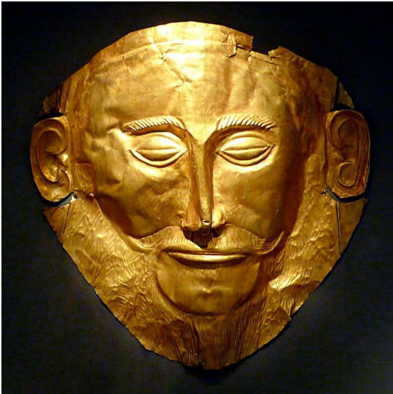
Agamemnon maszkja

Ezen a nullponton úgy kell újra intézményesítenünk a vendégbarátságot, hogy minden jogot, s azon túl minden „erkölcsöt” fölülírjon, és fölötte álljon még az „etikának” is.[7] Ehhez – és éppen az eljövendő vendégbarátság felől – újra kell gondolnunk, amit eddig az erkölcs és az etika lényegének tartottunk, amiben Derrida írásai szerint Lévinas etikája vezethet bennünket: