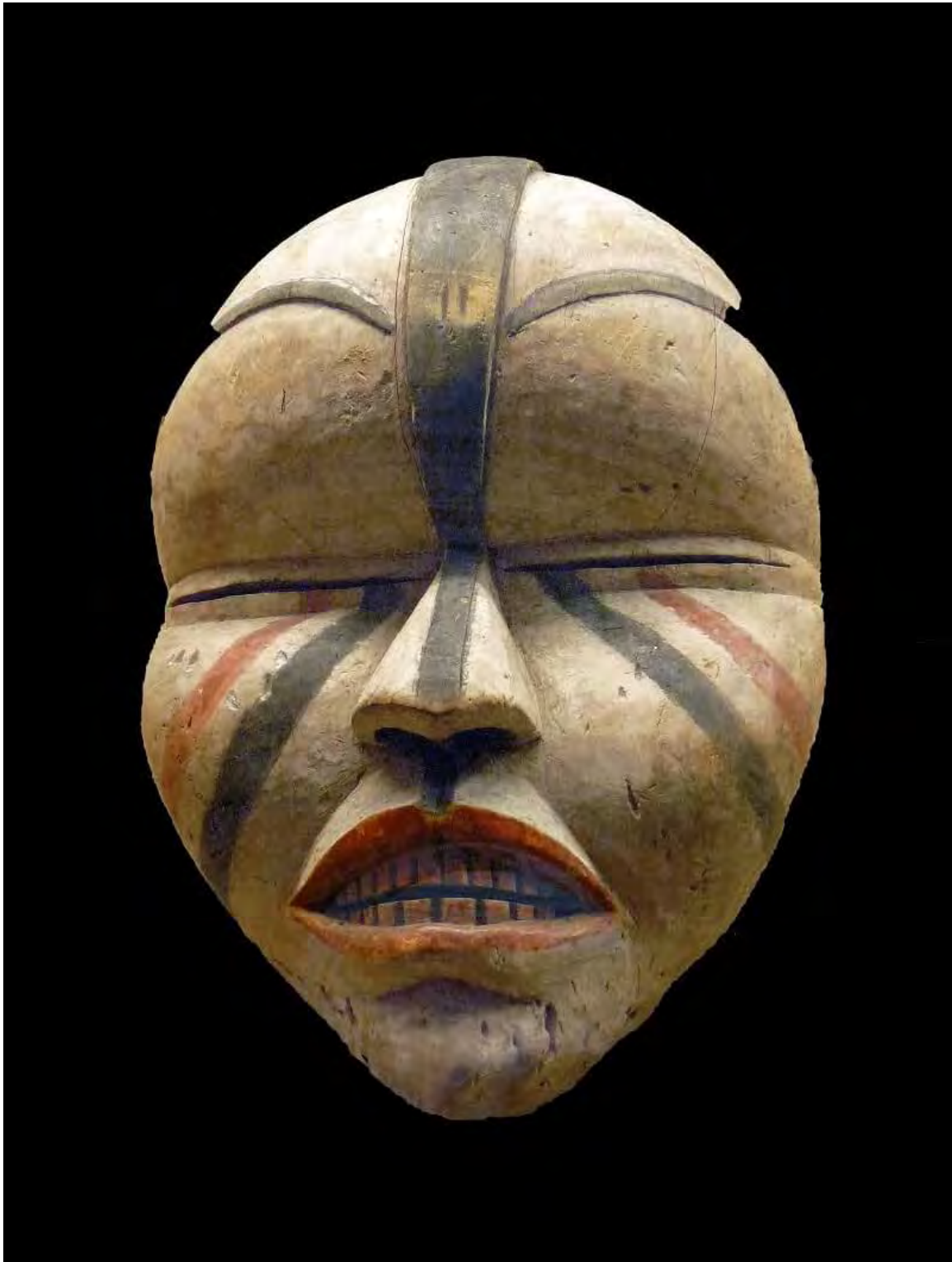
Woyo maszk Közép-Afrikából, Wikimedia Commons

barátságtalan magaviseletét, valóban elrémítő az a jogtalanság, melyről idegen földeket és népeket meglátogatván (ami náluk egyértelmű azok meghódításával ) tanúságot tesznek.”[37]