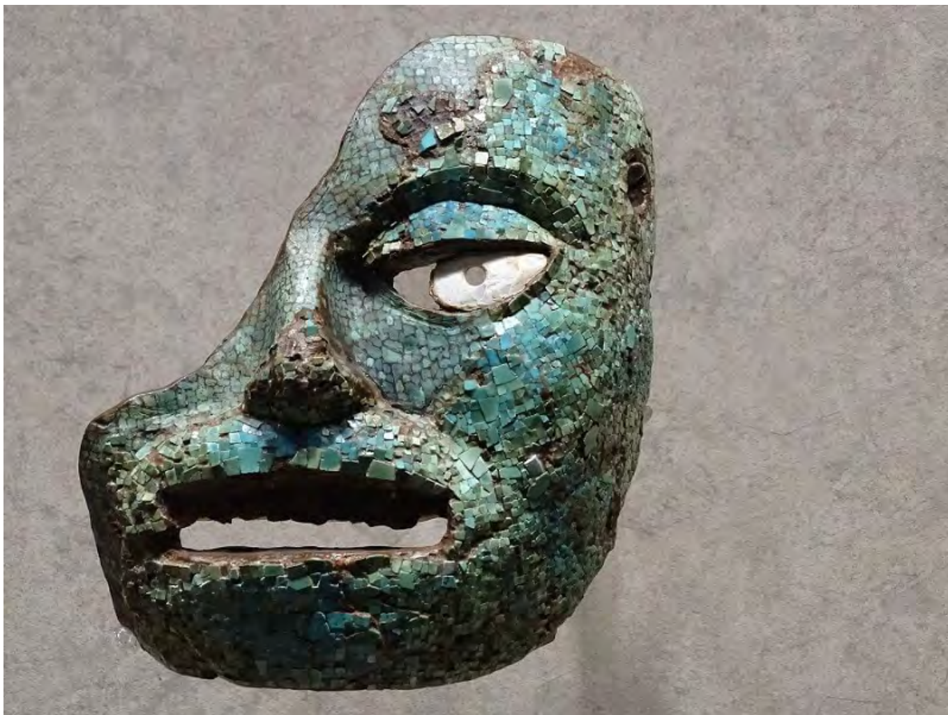
Mexikói maszk

Minden érkező (jövevény, idegen, más) parazitaként, és vendégbaráti viszonyba érkezik. A találkozás annak ígéretét hordozza – és a vendégbarátság egész koreográfiája és dramaturgiája ennek az ígéretnek a beteljesítését célozza –, hogy az asztalhoz ülhet. A szituáció akkor fordul ki, amikor a jövevény titokban lopakodik a fogadó otthonába, visszaél a bizalmával, a felkínált ajándékokkal. Csakhogy a jogi szabályozás, mely a menedékjog feltételeivel mindenkor leszűkíti az utat a találkozástól a (be)fogadásig, sokakból e/leve parazitát képez. A vendégfogadó a szűréssel védi otthonát, és kiszámíthatóvá akarja tenni a találkozást az idegennel, akinek a megjelenése szükségképpen felbolygatja a megszokott rendet. Persze, mondhatnánk úgy is, hogy eseményt kelt benne. A „rossz” parazita sem szükségképpen kártékony, mert próbára teszi az immun rendszert, és kikényszeríti annak autopoétikus újraszerveződését (ami a társadalmi szerveződés alapja), s akár még új társadalomszerveződési mechanizmusokat is életre kelthet.