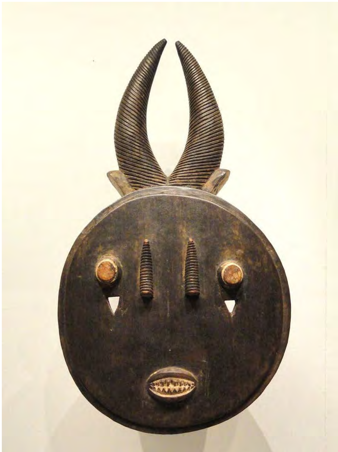
Baule maszk, Elefántcsontpart, Wikimedia Commons

helyre a rendet és szabja meg a törvényt. Benveniste nyomán az elfogadással és egyenlővé tétellel „jótékonyan”, hiszen mindkét fél szuverenitása megerősítést nyer. Derrida szerint azonban a fogadó fél, a helyzetéből adódóan, mindig erőfölényben marad.