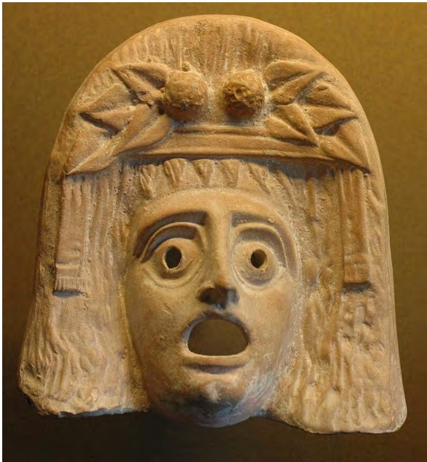
Dionüszosz maszk, Wikimedia Commons

A másik fogadása, egyszerre a genitivus subjectivus és objectivus értelmében, a másakra mondott igen mint a másik által az elfogadására felhívó, pusztán jelenlétével kimondott igenre adott felelet, felelősségünk megnyilvánításának lehetősége. Ennek a kettős genitívusznak ugyanaz a szerkezete, mint amelyben a jövevény joga a hospitalitáshoz a vendéglátó kötelességévé válik. A jog és kötelesség kölcsönös