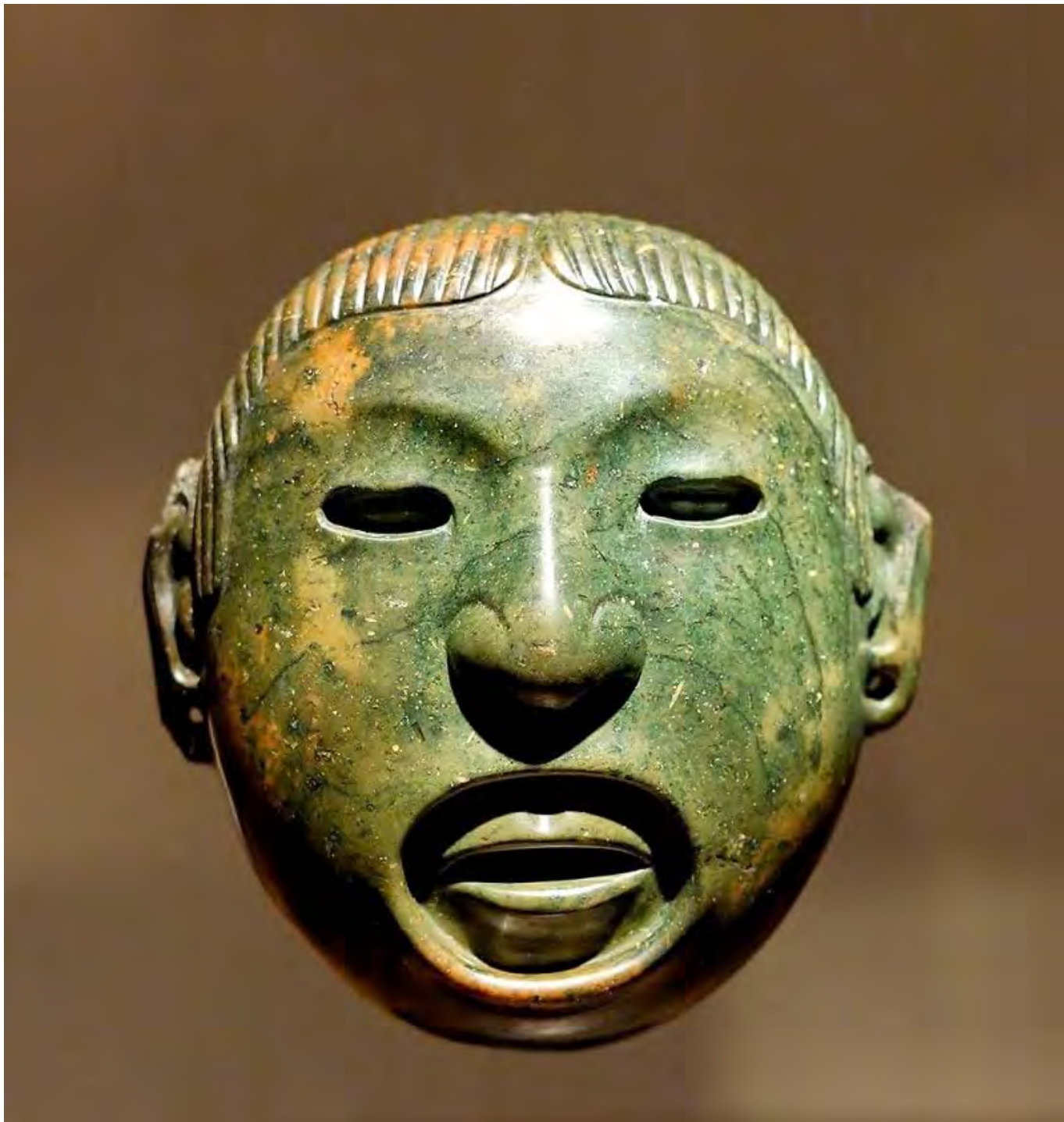
Xipe Totec azték maszk

Hiszen ezek a formák, tiszteletre méltó és gazdag hagyományuk mellett is rendre a jogi és egyezményi szabályozás keretében bukkantak fel. Ideértve az összes olyan formát, mely Európában intézményesült[34], ahol „az egyetemes vendégbarátság joga a legradikálisabb meghatározását és kétségkívül a legformálisabb meghatározását elnyerte – többek között Kant Az örök béke... című szövegében.”[35]