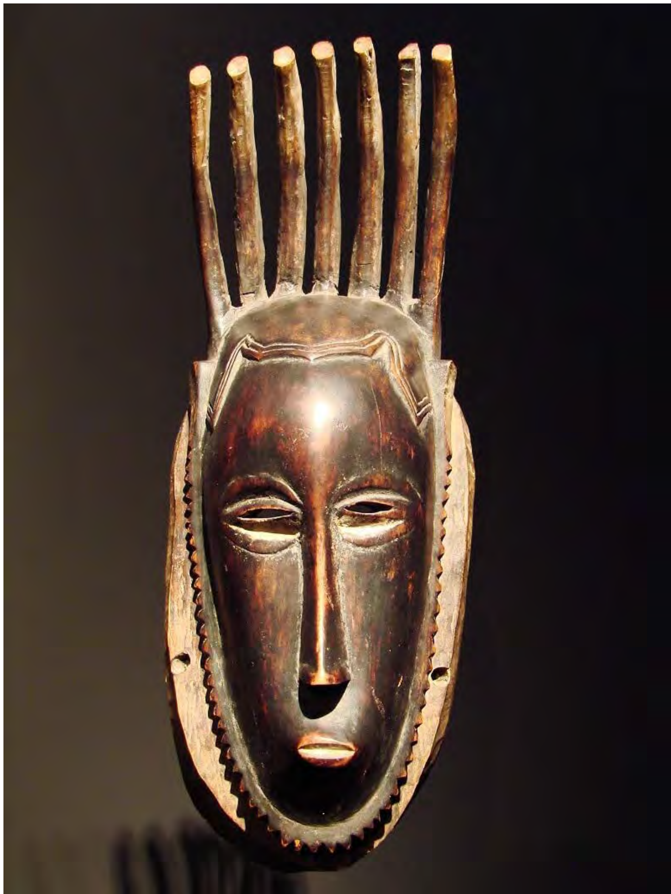
Hétszarvú maszk, Elefántcsontpart, Wikimedia Commons