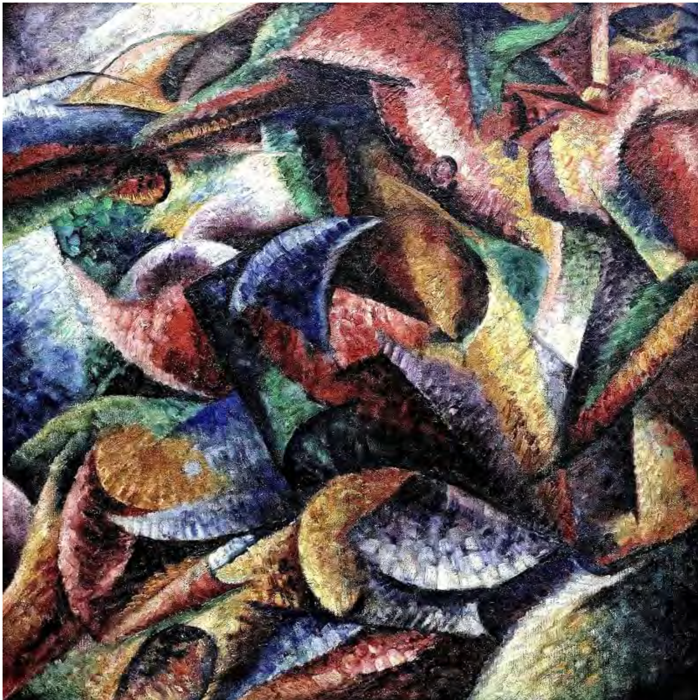
Umberto Boccioni: Az emberi test dinamizmusa, jean louis mazieres, flickr.com

tájékozódásról tanúskodó kötet új baloldali korszak felé mutat. A 60-as évektől napjainkig (Debord-tól Žižekig) tartó ívben szerzőnk a baloldali gondolkodás számos neves szerzőjét értelmezi, s hozza őket – minden különbségük ellenére – közös nevezőre. Mert a középpontban a politika és az ideológia átértelmezett szerepe, rehabilitációja áll.