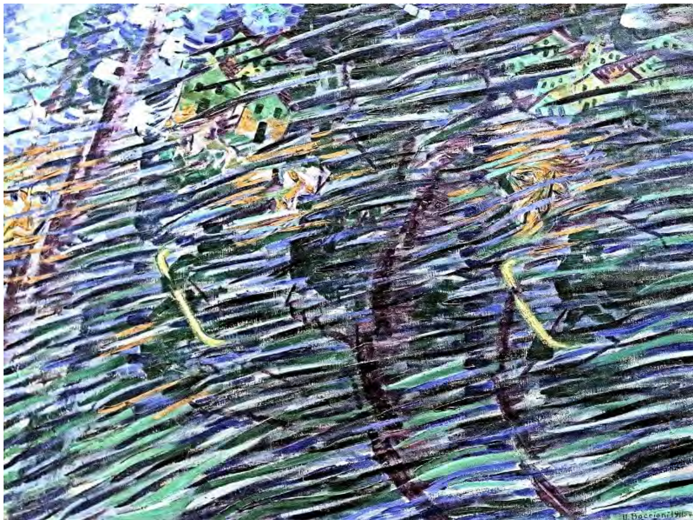
Umberto Boccioni: Lelkiállapotok I. Akik elmennek, jean louis mazieres, flickr.com

Az alap-felépítmény viszony ökonómiai determinizmusának elutasítása ezek szerint az osztályharc ortodox tézisének elutasítását, s ezzel a társadalom mint egész gondolatát is tartalmazza. Ahogy szerzőnk az első fejezetben kiemeli, a posztmarxizmus teoretikusai „a marxizmus 'ökonomista-determinista' és 'osztályista-politikai' hagyományát azonosították be a baloldal két alapvetően meghaladandó nézőpontjaként.” (33)