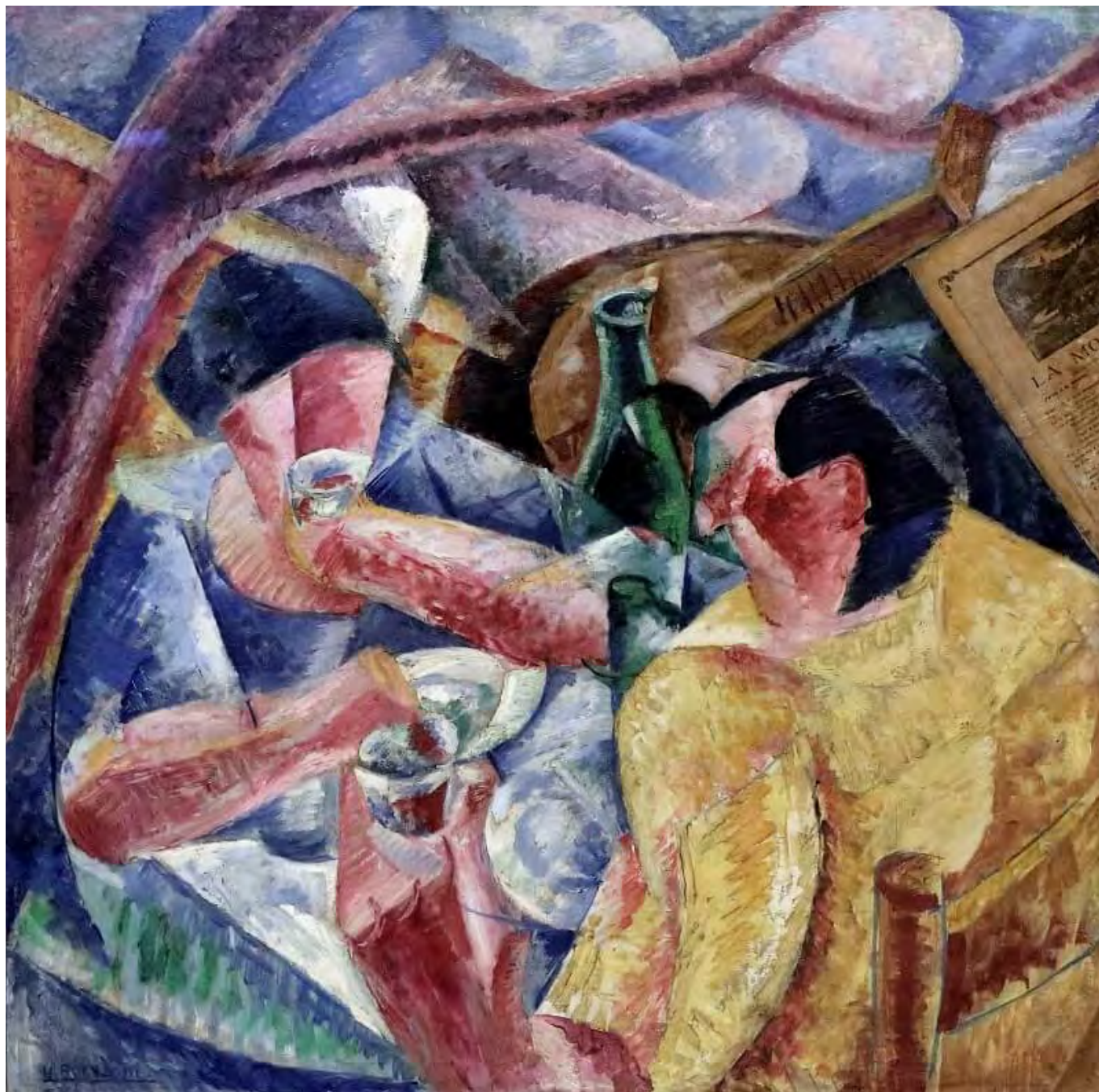
Umberto Boccioni: A pergola alatt Nápolyban

Idáig mondandóm nem tért el Kiss Viktorétól. Az egyetértést fontos hangsúlyozni, hiszen ezen a közös alapon nyugszik a téma továbbgondolása, amire most kísérletet teszek. A ma reneszánszát élő Polányi Károlyt, illetve 1944-ban megjelent A nagy átalakulás című művét szeretném bevonni a gondolatmenetbe. A marxizmushoz sok szállal kötődő, a szocializmus mellett mindvégig kitartó Polányit joggal tekinthetjük az első posztmarxista szerzők egyikének. Az osztályharc témájával szemben Polányi is „ a társadalom egységéből ” indul ki: „sem az osztályok születése – írja –, sem elhalásuk,