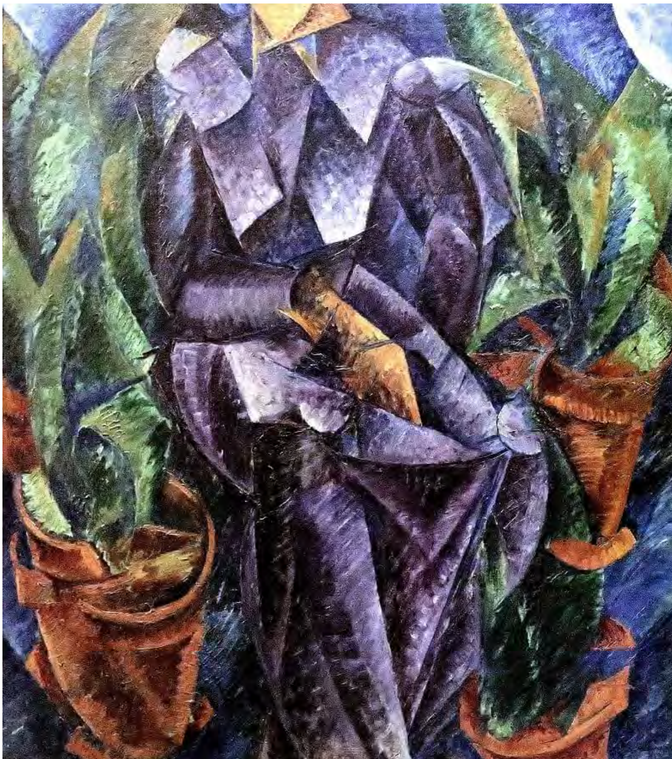
Umberto Boccioni: Spirális konstrukció

Mintegy kifejtve „a társadalom emberi és természeti szubsztanciájának megsemmisítésével” fenyegető liberális utópia működési elvét, Kiss Viktor ezt a folyamatot Deleuze-höz és Guattarihoz kapcsolódva másik oldalról világítja meg. A kapitalizmus – tolmácsolja a szerzőpárost – „a vágytermelés új módján nyugszik,