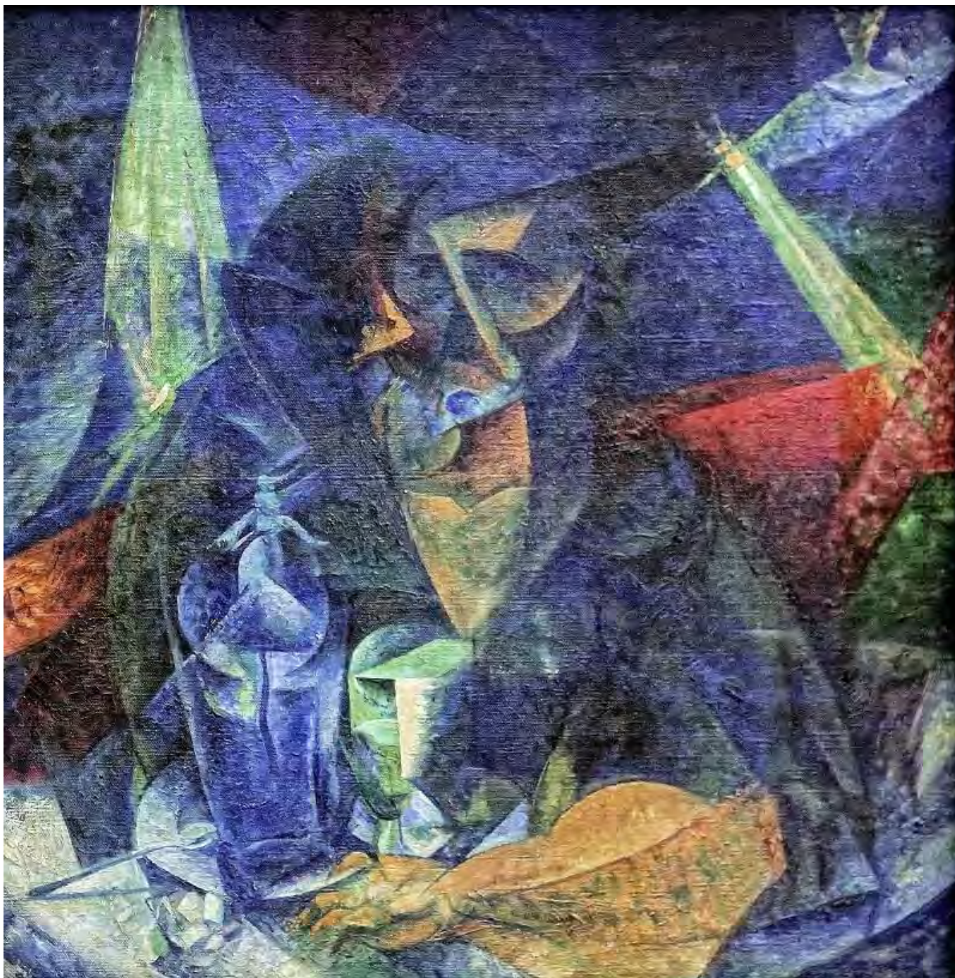
Umberto Boccioni: Nő kávézóban, jean louis mazieres, flickr.com

A globalizációt támogató erők oldalán ott van