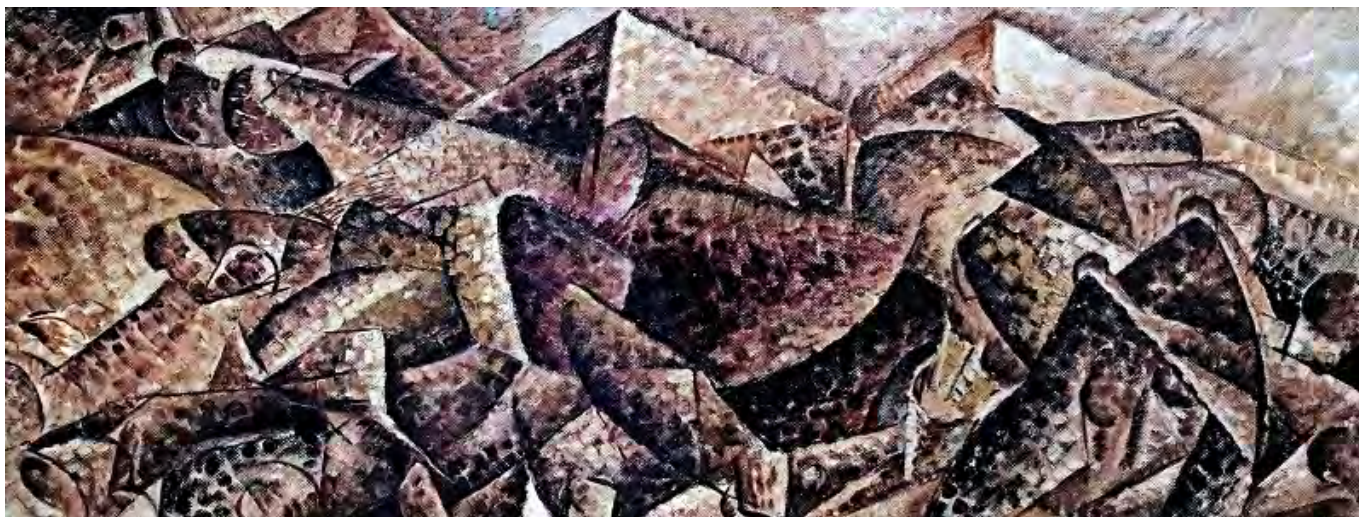
Umberto Boccioni: A lánzsák töltése, jean louis mazieres, flickr.com

Egyetértek tehát Kiss Viktornak az utópiákkal és a „kritikai ideológiákkal” szembeni fenntartásával és a leíró kritika melletti érvelésével. A kapitalizmus leíró kritikája arra törekszik, „hogyan beazonosítsa a ténylegesen létező politikai univerzumot az osztályharc korszaka után, és ebből bontakoztassa ki önmagát, ebből bontakoztassa ki a kritikai tudatot, és erre építse politikai stratégiáit”. (308–309) Ehhez a leíró kritikához próbáltam itt hozzájárulni, amikor kísérletet tettem az ideológiai erőter felvázolására, melyben identitásunkat az azonosulások és elhatárolódások sorozatában meg kell teremtenünk.