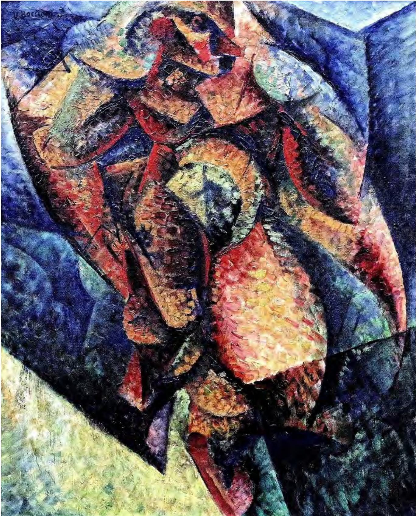
Umberto Boccioni: Emberi test. Dinamizmus