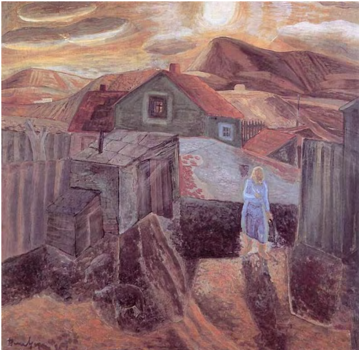
Bene Géza: Reggel, hung-art.hu

Kezdetben volt a róka, a görbői hegyen lakott, Görbő az Óperencián is túl van, meg az Üveghegyen is, ide mégis közel, a verandáról pont ellátni odáig, látni a kékes hegyet a messzeségben, pedig a környéken mindenütt csak dombok, kivéve a hegyet, ahol a róka él, akit, ha kimeresztem a szemem, egészen jól látok, integet nekem a messzeségből, onnan, ahová csak hetedhét országon át vezet az út.