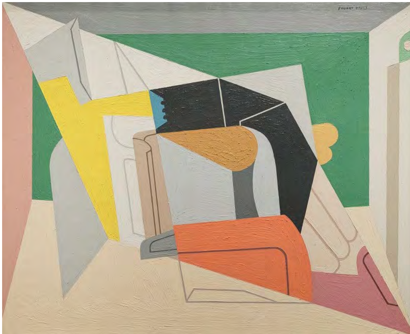
Stuart Davis: Tojástörő No. 2