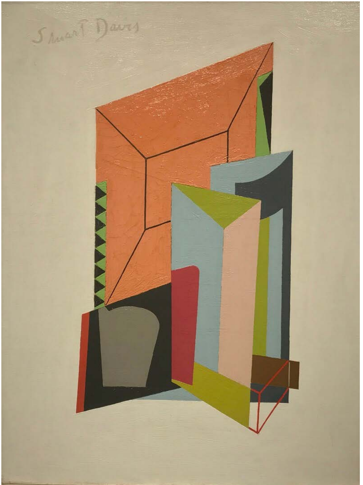
Stuart Davis képe