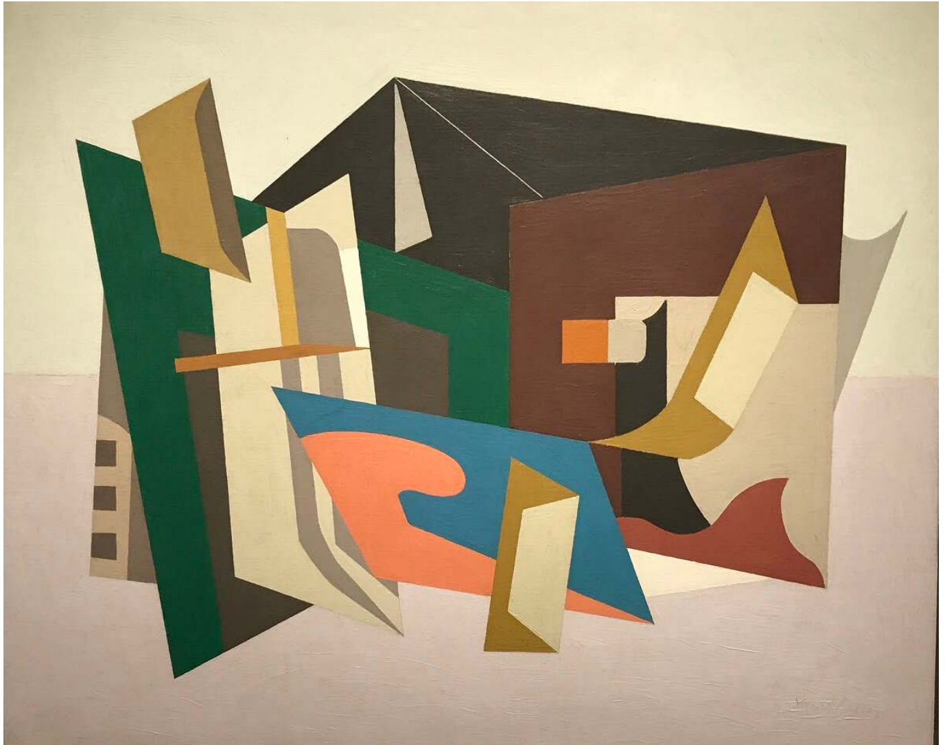
Stuart Davis képe, Daniel Hartwig, flickr.com

politikában a baloldal/jobboldal szembenállás tartalmi kritériumait manapság már nem lehet, illetve nem célszerű a megszokott értékötődések mentén megadni, mert az egymást keresztező és egymást metsző „elméletek” és „frontok” sokféleségével kell szembesülnünk. A felismerés döntő jelentőségű a napjainkban nálunk is egyre agresszívebb „kulturharc” értelmezésében.