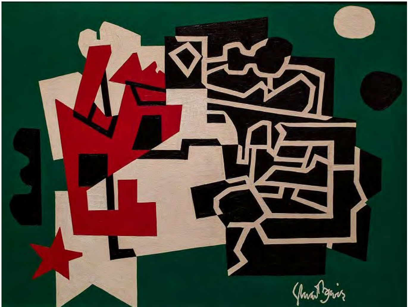
Stuart Davis: Memo No. 2

Alain de Benoist már a huszadik század hetvenes éveiben felismerte a Gramsci-féle hegemonia-elmélet jelentőségét (vagyis évekkel az újbaldali teoretikusok előtt!), és az olasz marxista gondolkodót követendő példaként állította a Franciaországban akkortájt megszerveződő Új Jobboldal szimpatizánsai elé. Igazat ad Gramscinak, a kommunisták tévednek, „(...) mikor feltételezik, hogy lehetséges az államot a szimpla politikai apparátusára egyszerűsíteni. Valójában az állam 'konszenzust teremt', vagyis nemcsak úgy irányítja az ügyeket, hogy igénybe veszi az államapparátust, hanem egyfajta implicit ideológia segítségével, amely olyan értékrenden nyugszik, amelyet magáénak vall és természetesnek tekint a társadalom tagjainak többsége. Vagyis ez a 'polgári' apparátus átfogja a kultúra egészét, az eszméket, az erkölcsöt, a hagyományokat, azaz kiterjed az egészséges emberi értelem egészére. Ezeken a területeken az állam nem direkt módon gyakorolja a hatalmat; az, amire itt az állam