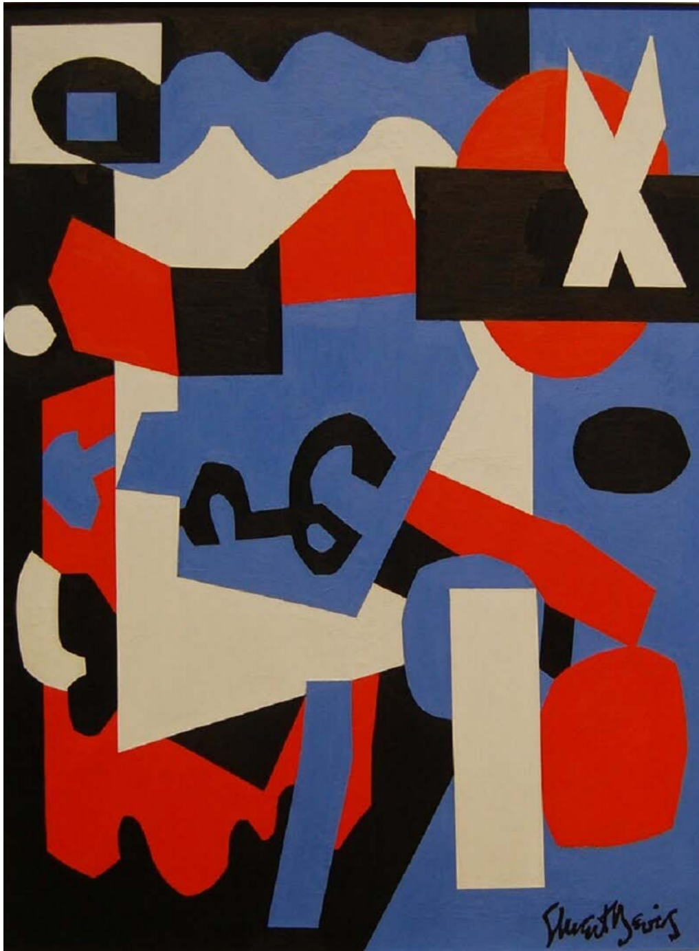
Stuart Davis képe, JR P, flickr.com

civiltársadalom fölött, és céljai elérése érdekében szinte sohasem riad vissza a kényszer alkalmazásától. „Keleten az állam volt minden, míg a civilizált társadalom megrekedt a maga embriószerű állapotában. Ezzel ellentétben Nyugaton egy egészséges és arányos viszony alakult ki az állam és a civilizált társadalom között, és az állam bizonyos megingásait egy robusztus civilizált társadalom ellensúlyozta. Az állam csak egy előretolt lövészárk volt, amely mögött robusztus erődítmények és kazamaták húzódtak meg.” [14]