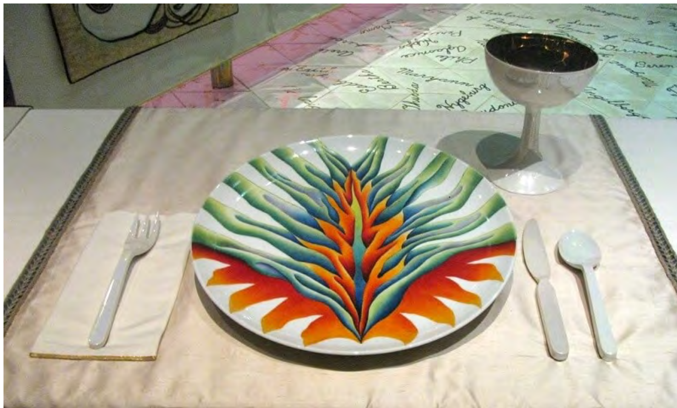
Szent Brigitta terítéke

A „vacsorán” a mitológiai és történelmi személyiségeket az „asztal” körül attribútumaik alapján kialakított, személyre szabott terítékek (hímzett asztalkendő, festett porcelán, serleg, szalvéta, evőeszköz) teszi egyedivé. Az iparművészeti tárgyakat az alakhoz köthető szimbolikus dekoráció és anyaghasználat jellemzi, ezzel a gyakran női munkának tekintett kézműves tevékenységüket a magas művészet körébe emeli. A terítékek kialakítása eleinte kétdimenziós, ahogy időben közeledünk a jelen felé, egyre inkább térbelivé válik, ez a folyamat érzékelteti a női emancipáció törekvéseit [4] .