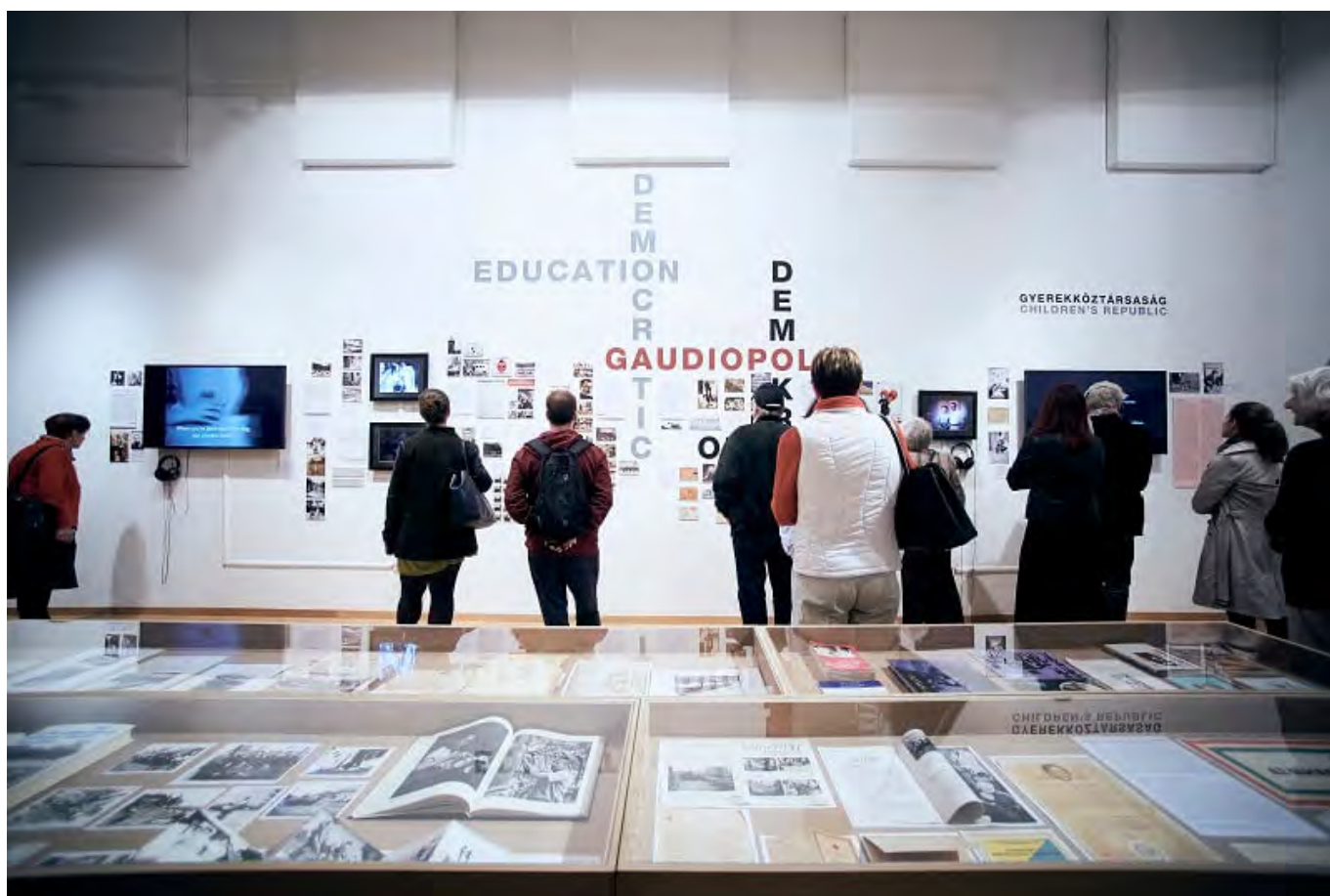
Valahol Európában (kiállítás).

budapesti városvezetésben változások kezdődtek, talán helyszín-ügyekben együtt tudunk működni egy-két önkormányzattal, ez is előrelépés. A bojkott sosem volt cél, hanem eszköz: arra, hogy megmutassuk, nem muszáj rossz kompromisszumokat elfogadni ahhoz, hogy magas színvonalú, nemzetközi léptékű és relevanciájú projektet hozzunk létre – még egy olyan kiszolgáltatott területen sem, mint a kortárs képzőművészet. A hazai civil társadalomban ezt sokan inspirálónak találják.