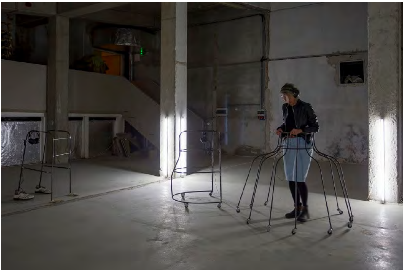
Játékok népe (kiállítás)

történelemben, akár jövőbeli lehetőségként. Mesterséges intelligenciáról, közösségi médiáról és annak a demokráciára tett hatásáról beszélnek; a szuverénról, egyéni, vagy akár nemzeti szinten; a mélyszegénység és a romák kulturális reprezentációja is szóba kerül. Ezek a témák a mai Magyarország fontos problémái. A vers mai értelmezésében a Levegőt! felkiáltás a klímakatasztrófára és a több irányból fenyegetett egyéni szabadságjogokra is utal.