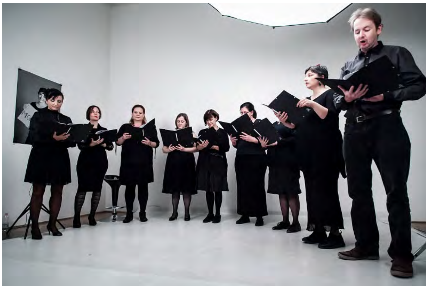
Előre menekülni (Öt alkalmas, élő adásban közvetített, nyilvános, tanácskérő látogatás).

idelátogató külföldiektől és a nemzetközi kulturális, kortárs művészeti médiában. Sokfelé hívnak külföldre, hogy beszéljünk az OFF-ról – ott elsősorban a működési struktúránk érdekes.