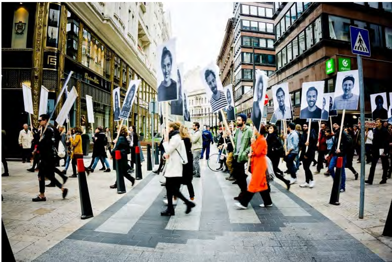
Gladness Demo. Örülünk, hogy demonstrálhatunk. Demonstrálás / felvonulás köztéren.