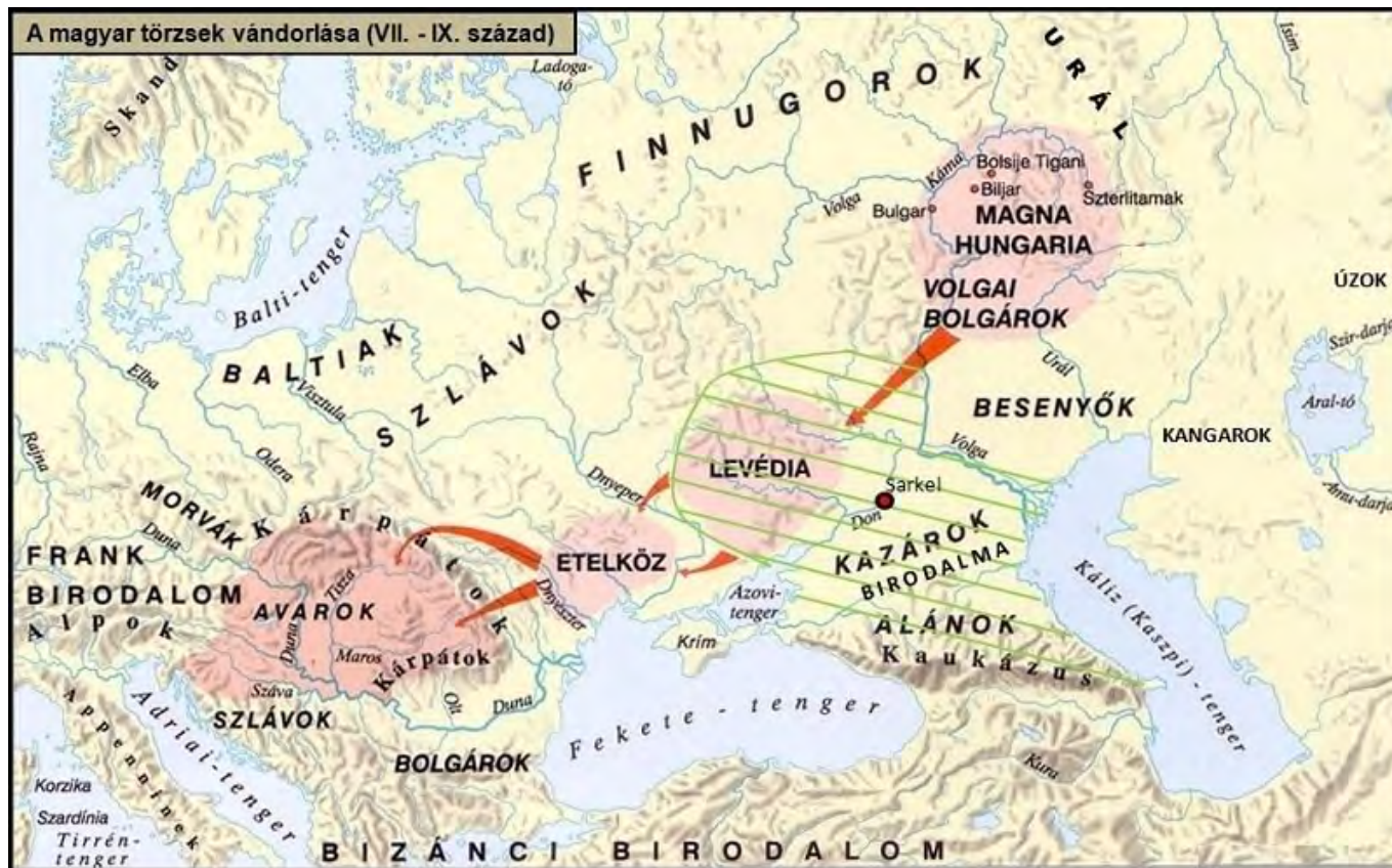
A magyarok bejövetele

Amikor már úgy-ahogy letelepedtünk a Kárpát-medencében, még mindig próbáltunk terjeszkedni nyugat felé. Ez az a kor, amelyet mi (óh, micsoda eufemizmus!) a „kalandozások korának” mondunk, holott egyértelműen gyilkos rablóhadjáratok voltak. Minthogy ekkor már kialakult, megszervezett államok és fejedelemségek voltak Európában, a „kalandozásoknak” kevésbé a terjeszkedés (azaz újabb lakhelyekre vonulás) volt a célja, sokkal inkább a sikeres rablás.