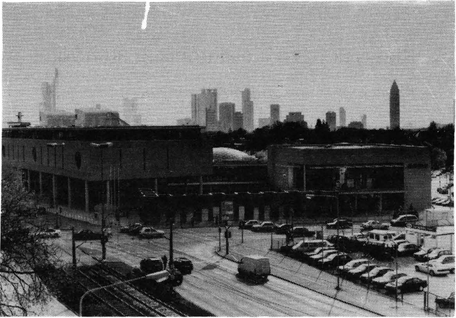
A könyvtár épülete a főbejárat oldaláról nézve