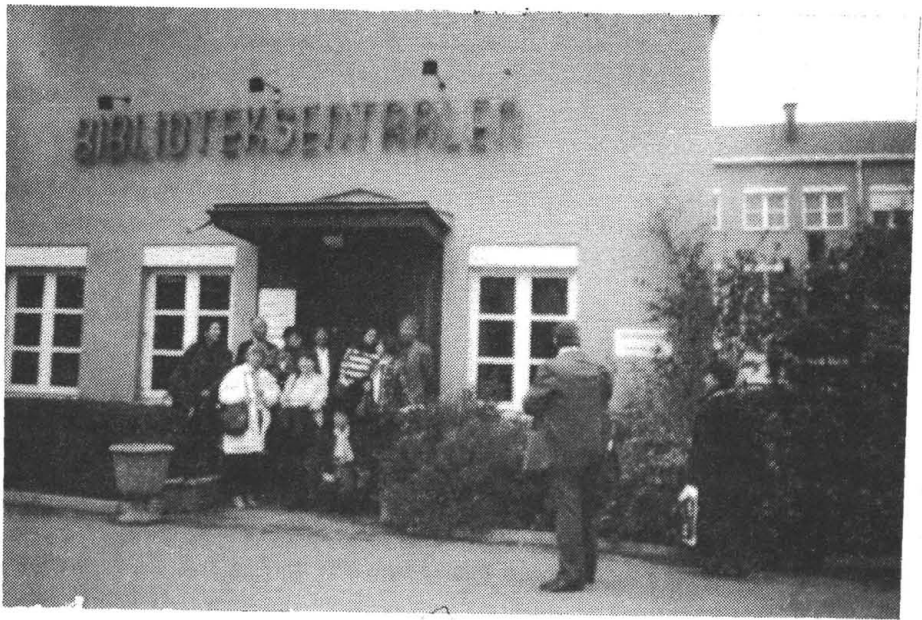
A Norvég Könyvtáros Egyesület központja

található. Ezen kívül ezen a szinten van egy klímaberendezéssel ellátott terem a speciális tárolást kívánó gyűjtemény számára. Az épületben számos megoldás segíti a mozgássérülteket és egyéb fogyatékos könyvtárhasználókat, mint pl. lassított lift a mozgássérülteknek, hangosbeszélő a liftekben a vakok és gyengénlátók használatára amellet, hogy a kiírások szövegei Braille írással is rendelkezésre állnak. A modern, elegáns bútorzattal és a legmodernebb technikával felszerelt egyetemi könyvtár a 21. század könyvtári igényeinek is megfelel.