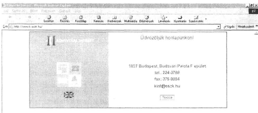
2. ábra: Az új nyitóoldal

Az új honlap összetettsége miatt a böngésző először egy nyitó oldalt jelenít meg, ahol tájékozódhatnak a látogatók az intézet elérhetőségeiről, majd innen továbblépve lehet eljutni a portálra.