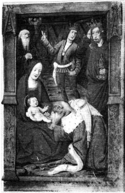
A Boldogságos Szűz Mária óraskönyvéből (15. sz.)