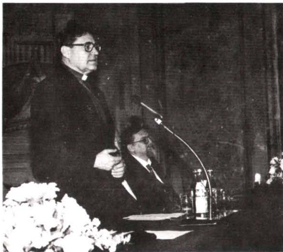
Képek az Egri Főegyházmegyei Könyvtár bicentenáriumi ünnepségéről