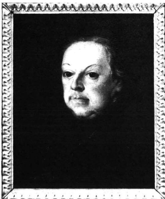
Gróf Eszterházy Károly püspök, a könyvtár alapítója

Gáspár-emlékülés, VI. Nyári Akadémia, MKE vándorgyűlésen szekcióülés, szakmai tanácskozás Kecskeméten, a „Tehetség gondozás könyvtárban, könyvtárral” elnevezésű pályázat eredményhirdetése, és felvázolja az 1994-es terveket (konferencia 1994. március 25–26-án Székesfehérvárott a Magyar Olvasástársasággal közösen az olvasásról mint tantárgyközi feladatról, dániai tanulmányút június utolsó hetében, felkészülés a körmenői vándorgyűlésre, a tisztújítás lebonyolítása). A körlevél végül felszólítja a tagságot tagdíjbefizetési kötelezettségének teljesítésére.